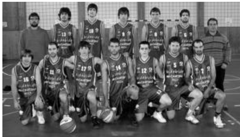
Tolosako Bidebide Ibizas saskibalo taldeko jokalaririk.