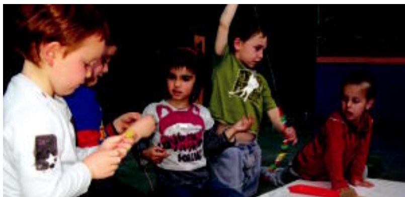
Lizartzako haurrek eskulaneekin jarri zuten martxan XXXI. Eskolaren Astea. ESTI EZEIZA

MENDIA Antolatzaileak «oso gustura» agertu dira jendearen erantzunarekin; Berastegin 46 haurrek 3 orduko ibilbidea egin zuten 4