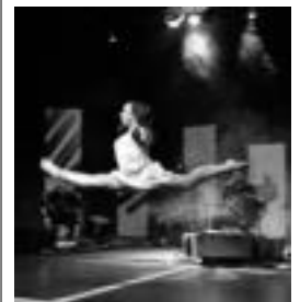
Emanaldiko une bat. HITZA

Hilaren 15ean, San Isidro egunez afari herrikoia egingo dute. Zarretxe Jatetxean 21:00etan izango da eta dantza eta kantuaz girotua izango da. Txartelak erosteko azken eguna hilaren 13a izango da eta 15 euro ordaindu beharko da. Barreterapia ikastaroa doan izango da baina izena udaletxean eman beharko da hilaren 13a baino lehen. Hilaren 17 eta 19an, 19:00etatik 20:30era izango da.