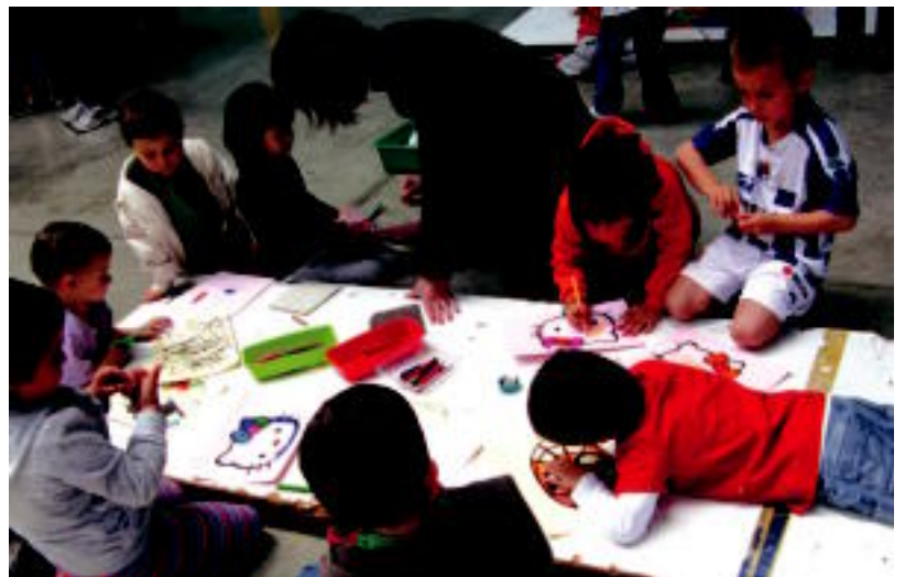
Lehen eta Haur Hezkuntzako ikasleek eskulanak egin zituzten pilotalekuan, atzo arratsaldean. E. EZEIZA