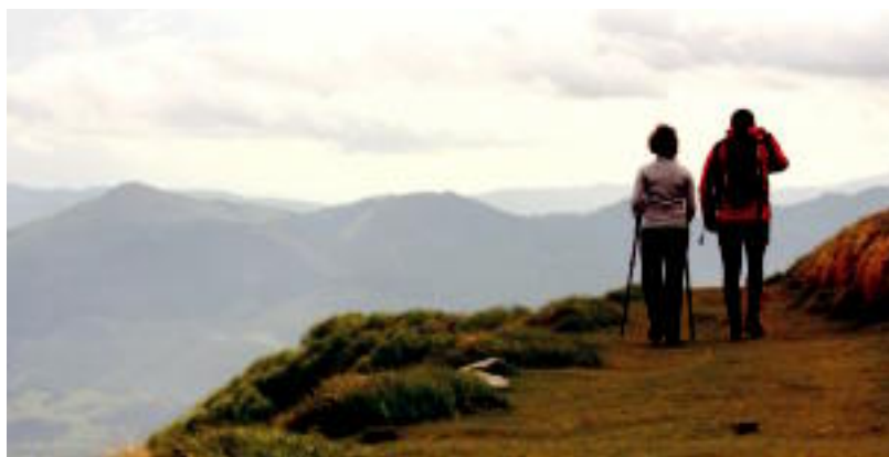
Erniopeko VII. mendi martxan paraje ederrak ikusteko aukera izan zuten. INAKI LOPETEGI