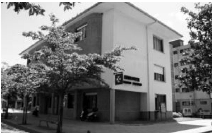
Eskualdean, Villabonako Osasun Zentroan izango luke eragina neurri berri honek. E. MAIZ

berri emateko. Berrobitarrek ere, aurretik izan dute landu beharreko gaia. Ikasturtean zehar, uraren inguruan lanketa ezberdinak egin dituzte. Udal ordezkariak aurrean zituztela aprobetxatuz, Berrobiko gabezien berri eman zieten. ESTI EZEIZA