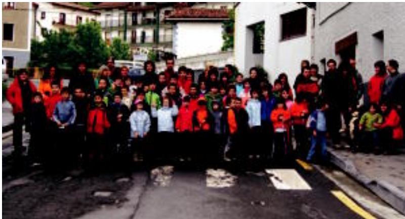
Berastegiko XVIII Mendi Martxan, herriko 46 neska-mutikok hartu zuten parte. LEIRE LABAÏEN

Mendia » Berastegin 132 mendizale irten ziren, 46 txikiaren ibiladiaz; Erniopekoan 310 elkartu ziren.