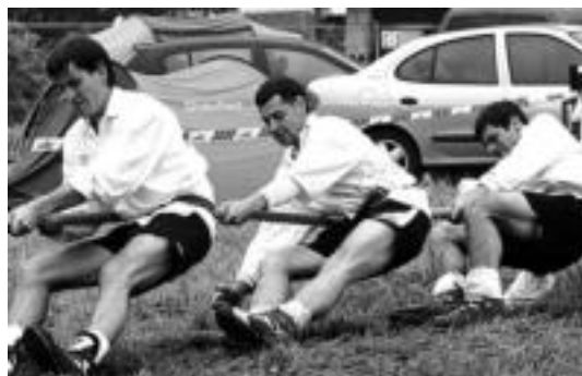
Aresoko tiralariak duela bi urteko Euskal Herriko Txapelketan. HITZA

1. Araba (Badaiotz) 2. Gipuzkoa (Ibarra) 3. Nafarroa Garaia (Imotz-Basaburu).