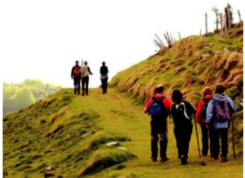
Ernio inguratzen duten 8 herrietako basabideak zeharkatu zituzten parte hartzaileek. INAKI LOPETEGI