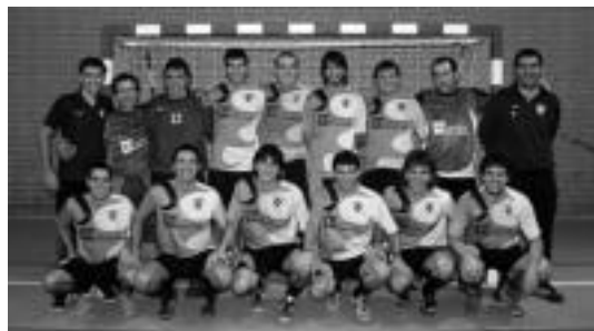
Villabonako Transportes Lakunza taldea.