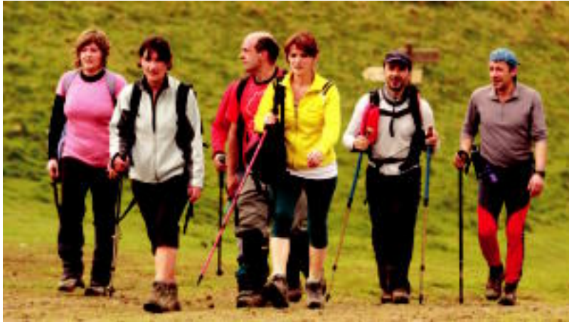
Eguraldi kaxkarra izan arren, 310 mendizale bildu ziren Erniopeko VII Mendi Martxan. INAKI LOPETEGI