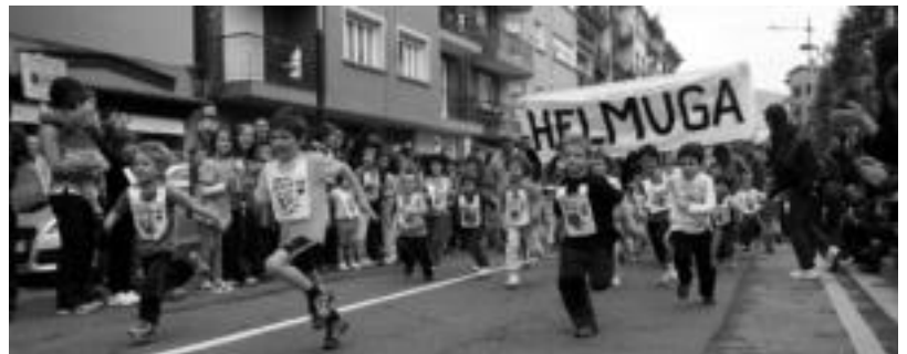
Haur Krosa egin zuten Malkar Plazan eta haur ugarik parte hartu zuten. Guztiek argazki bat atera zuten. E. MAIZ