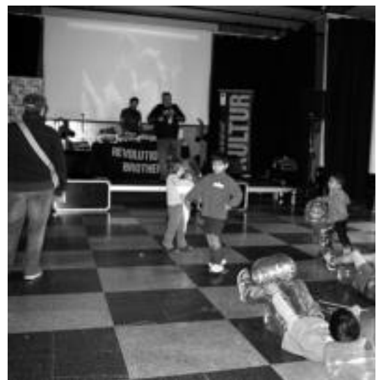
Guraso eta gaztetxoek reggae musikaz gehiago jakin ahal izan dute. E. MAIZ

maren baitako sei film ikusteko aukera izango da Topic Txotxongilo-en Nazioarteko Zentroan doan: Ahate pasa , Amona putz , Marisa , Limoncello , Eramos pocos eta 7:35 de la mañana .