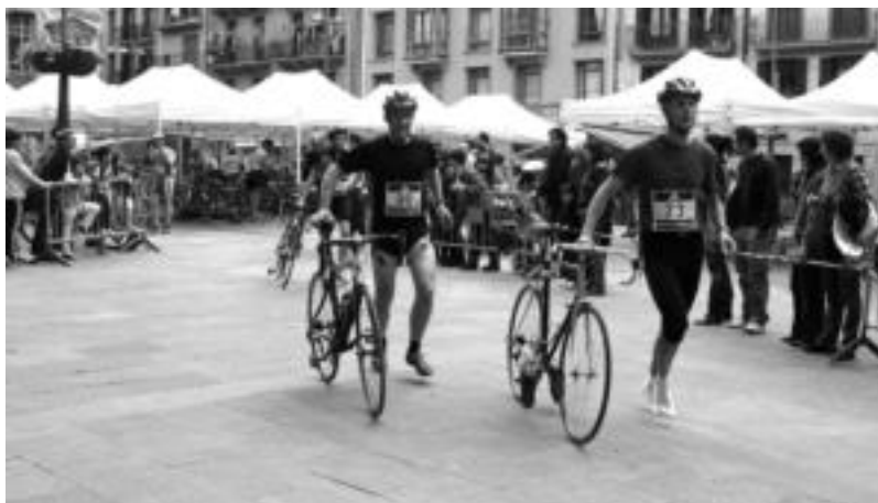
Bizikleta hartu eta 15 kilometroko itzulia egin zuten parte-hartzaileak.