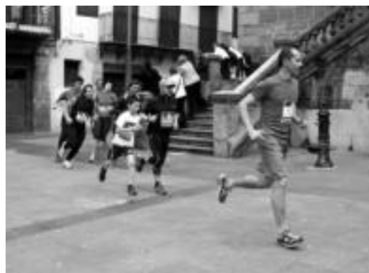
Alde Zaharrean zehar 4 kilometro egin zituzten korrika. ENERITZ MAIZ

Beraz, aurtengo emaitza ikusita, datorren urtean ere proba errepikatzeko moduan dira. Bederatzi garrenez egin dute aurtur Urkolaren omenezko Duatloia. 1997. urtean hasi ziren antolatzen, eta 2002. urtera arte egin zuten etenik gabe. Pasa den urtera arte, ordea, etenaldia egon baitzen iaz, eta orduan hartu zuen triatloi taldeak berriro antolatzeko ardura.