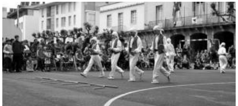
Ondoren, Loatzoko musikariak eta Oinkariko dantzariak izan ziren Errebote plazan. E. MAIZ