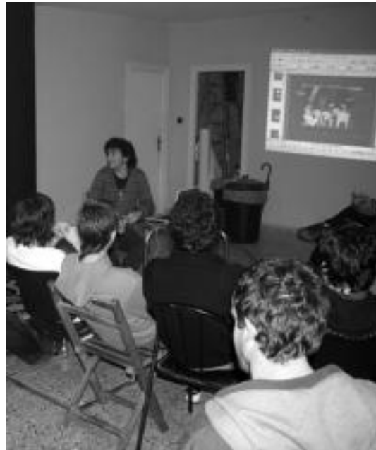
Kuban iaz egondako brigadista baten hitzaldia izan zen atzo, Otsabin. I. GARCIA

gertaeraz ('Masacre del Hospital Filtro' bezala ezagutzen diren gertakariak, non euskal errefuxiatuen aldeko mobilizazioetan bi hil-dako egon ziren) jabetzen den El Filtro, memorias de los refugiados vascos en Uruguay liburuaren aurkezpena eskainiko du», zehaztu dute. Gai horren inguruan solasaldia ere egingo dute.