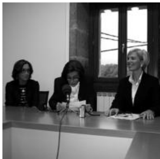
Otañoren bi bilobak eta alkatea; Txurik testu bat ere irakurri zuen. E. MAIZ