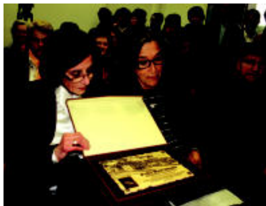
Otañoren bi bilobak Udalak egindako oparia eskuartean dutela.

TOLOSA 'Maiatza Borrokan' hitzaldi honekin hasiko da 2