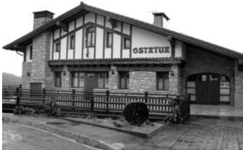
Sotoa, taberna, jangela eta lau gelek osatzen dute herriko plazan kokatuta dagoen Ostata. E. EZEIZA

Udal ordezkarien hitzetan, «bere garaian, zerbitzu hau mar-