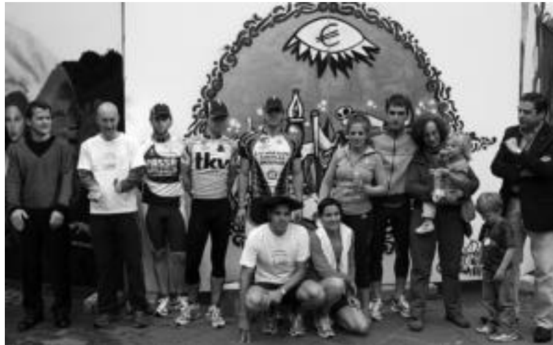
lazko duatloia amaitu ostean, antolatzaileak eta irabazleak. E. EZBIZA

Izen ematea bukatu ostean, 17:00etan emango zaio hasiera aurtengo Duatloi Herrikoari. Aurtengo, boxesak eta irteera Plaza Berrian kokatuko dira. Ibilbideari dagokionez, partaideek, hasteko 2 kilometro korrika egin beharko di-