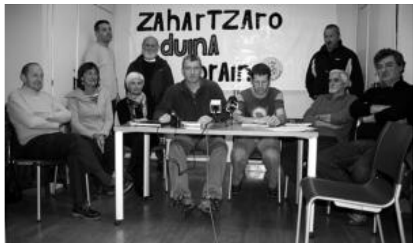
Zahartzaro duinaren aldeko plataformako hainbat kideren prentsa agerraldia herenegun. A. IMAZ