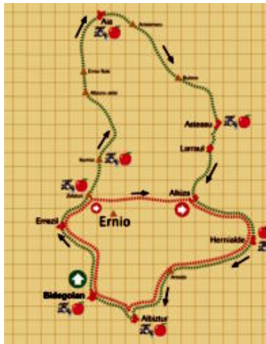
Berdez ibilbide luzea eta gorritz ibilbide motza. HITZA

Izena emateko aukera zabalik dago interneten www.erniozaleak.org helbidean. Bertan eskatzen diren datuak sartu behar dira eta gero, igandea, txartela jasotzerakoan 10 euro ordaindu behar dira.