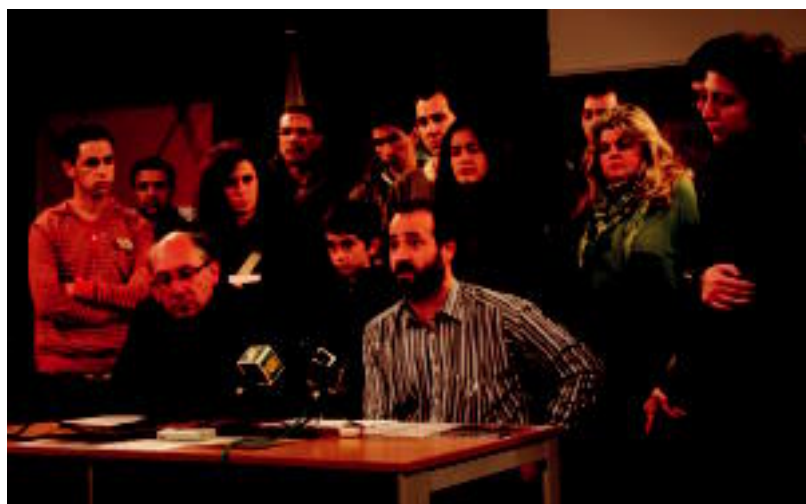
Tolosaldea Sahararekin elkarteko kideak 'Maiatza Borrokan' jardunaldiak aurkezten. I. TERRADILLOS

ASANBLADA Etzi, 12:00etan, Harizpe elkartearen lokaletan azpiegitura berriaren inguruan hitz egingo dute z