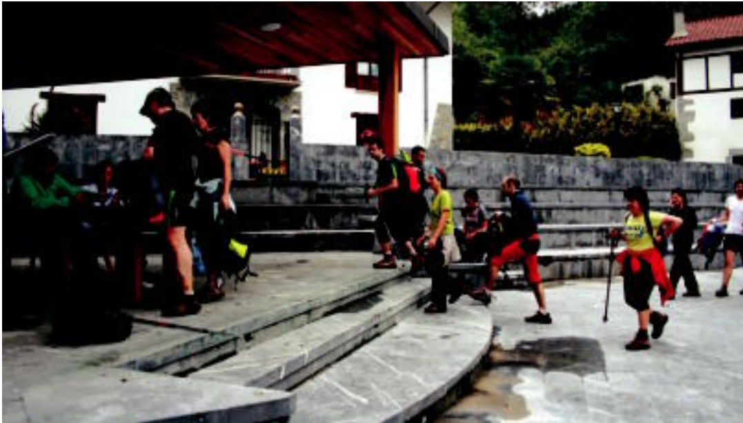
Orain bi urteko Erniopeko Ibilaldian mendizaleak Albizturko kontroletik pasatzen. E. EZEIZA