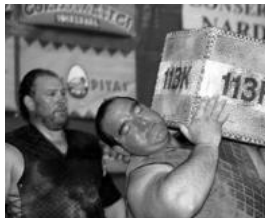
Besteak beste, Saralegi eta Perurena jaialdian izango dira. K. ALDUNTZIN

Hainbat urte pasa ondoren, bere ikasle izan diren hainbatek eta bestelako laguntza ugari jaso duten lagunak bildu eta ondo merezita duen omenaldia eskaintzea eraba-