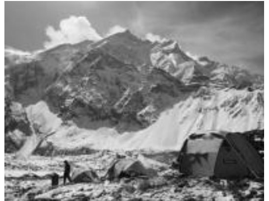
Annapurna, 'Uztaren jainkosa'. RTVE AL FILO DE LO IMPOSIBLE

dute, mundua mundu den artean, zortzi mila metrotik gorako jainkosek.