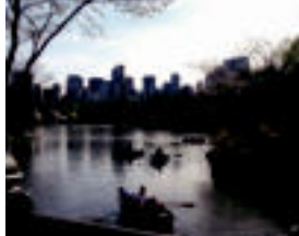
«New Yorkeko Central Parkeko lakua atzealdetan erakiri altu ikusgarriak ikusten direla». TERESA ZUBILA