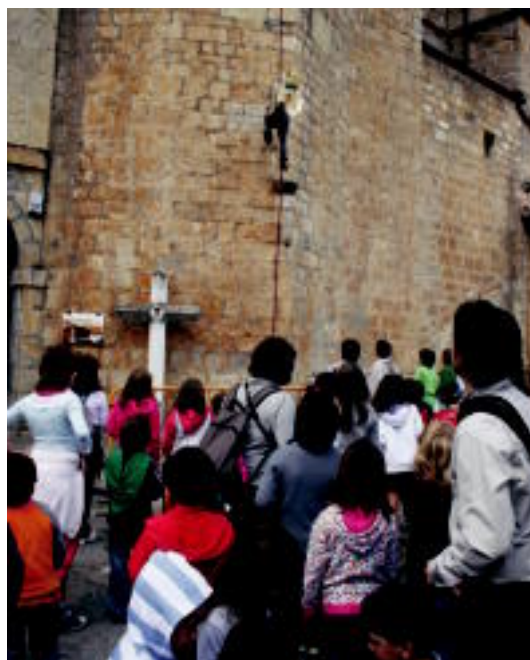
Asteasuko Elizmendi auzoan Simonen jaitsierarekin hasi dira jaiak. ASIER IMAZ

ABALTZISKETA Jaiaren ondoren 20.000 abere inguru ibiliko dira Aralarko parajeetan; hauetatik 18.500 ardiak izango dira 6