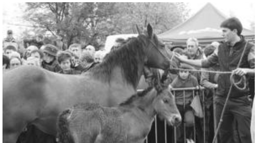
Gipuzkoako Zaldi eta Behor Txapelketa jokatu zen estreinakoz, atzo goizean, Larraitzen. E. EZEIZA

KAZETARIAK (Erref.: 2010-LPKAZ) Berria egunkariak kazetariak behar ditu ordezkapenentarako lan poltsa osatzeko.