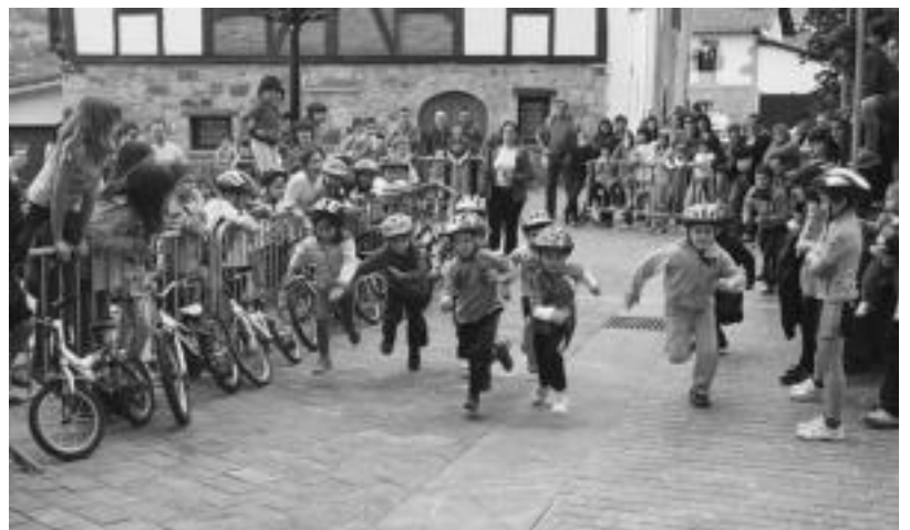
Asteasuko Elizmendi auzoko jaietan haurrentzako duatloiak arrakasta handia izaten du urtero. A. IMAZ

BALIARRAIN » Txekor jatea egiteko herriko frontoia bete zen atzo Baliarrainen. Kanpoan eguraldia ez bazen oso atsegina ere, bazkarian giro ona izan zen nagusi. E. EZBZA