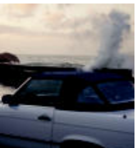
«Autoa Biarritzeko portuan izeneko argazkia bidali du Javierrek. IVAR OTSO