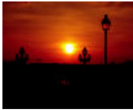
Pariseko ilunabarri ateratako argazkia. ANNAURE AZCARRA