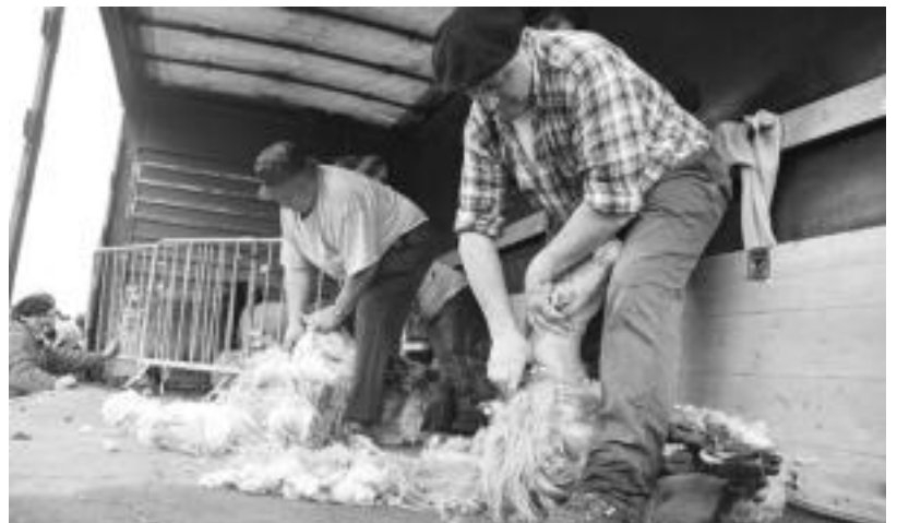
Bi amezketar, guraizeak eskuan hartuta, nor baino nor aritu ziren ardiei ilea moztzen. E. EZEIZA