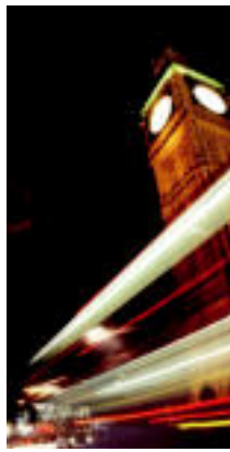
Argazkiaren Londresko Biggen-en, bertako autobusa eta Metro-ko barria. IGAZTEN DIA GAZZA. JAKOIN OZTELLA