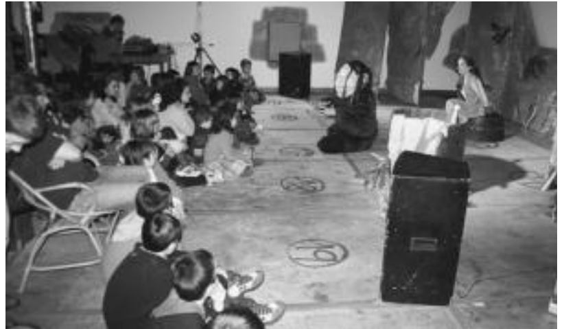
Tartalo Orexako udaletxearen ganbara izan zen atzo. I. GARCIA

Gaurkorako Orexan gaztelu puzgarriak, bertso saio interesgarria eta afari merienda egin ondoren, erromeria izango dute. Elizmendiin meza, hamaiketako, toka txapelketa, trikitalariak, herri kirolak, buruhandiak eta Simonen igoreraren ondoren erromeria izango dute gau aldean.