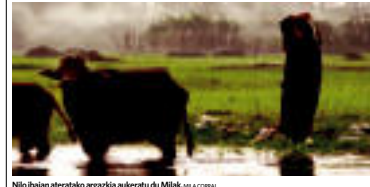
Nio bilain ateratako argazkia aukeratu du Mialak. ALA CORRAL