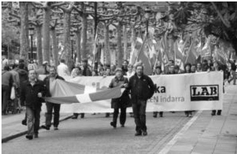
Dozenaka lagunek parte hartu zuen LAB sindikatuak Beasaindik Ordiziara antolatutako manifestazioan. ESTITXU IMAZ

LABen arabera «aurtengo Maiatzaren Lehena testuinguru berezi batek markatuta dator: batetik krisiaren erdian kokatuta gaude, murriketa, erreforma eta botere ekonomikoaren eraso artean. Besteetik, aldaketa politikoi bultzada emateko fasean gaude, bete bete-an». Horregatik, lehenik eta behin egoeraz daukaten kezka adierazi nahi izan zuen LABeko idazkari nagusiak. «Azken langabezi datuek erakutsi dute egoera okerrera doala eta horren aurrean hartu nahi dituzten sakoneko neurrien inguruan kezka eta salaketa adierazi behar dugu. Ez gara lan eskubidea eta pentsio eskubidea murritzetez soilik hizketan ari. Bi horiez gain, orain langileoi gure eskubideen defentsan aurrera egiteko ezinbestekoa eta funtsezkoa dugun negoziazio kolektiboa be-