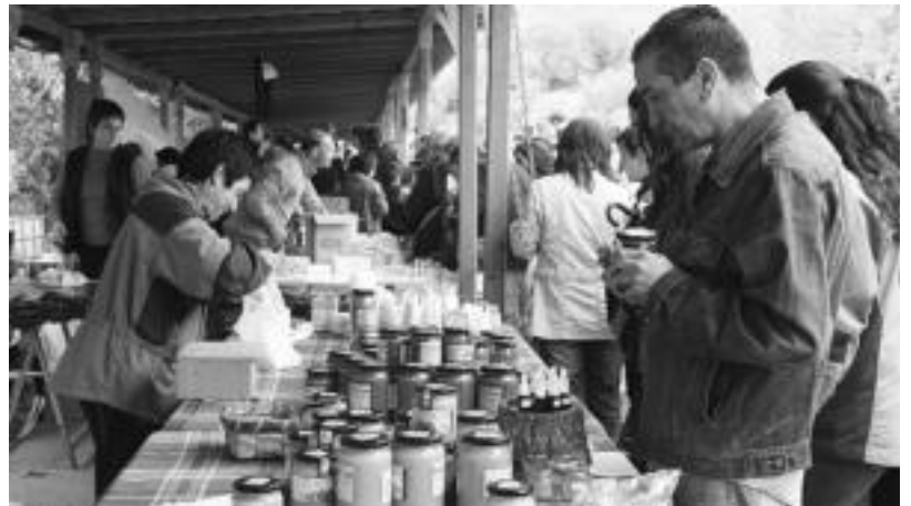
Artisau lanak eta bertako produktuak erosteko aukera izan zen Aralarko magalean.

Aimendi izan zen azkarrena. Lana osatzeko 14 minutu eta 50 segundo behar izan zituen. Honek, mozketa gutxiago egin arren, Egoarre biziago aritu baitzen, bakoitzean ile gehiago kentzen zuen. Zenbaiten esanetan, hala ere, «lan txukunagoa egin zuen Goitiak».