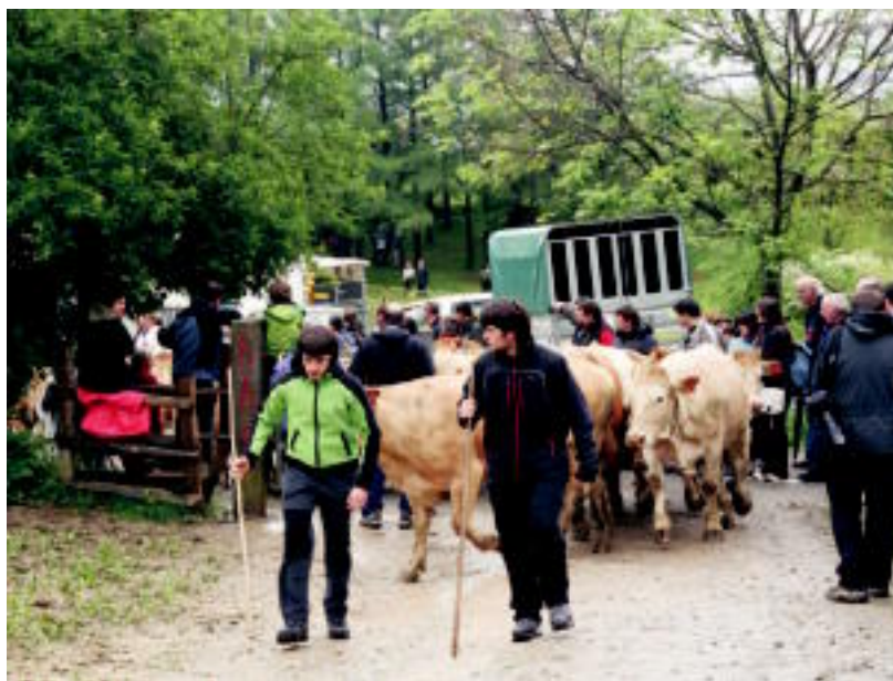
Larren irekierak jende eta abere ugari elkartu zituen Larraitzen. ESTI EZEIZA