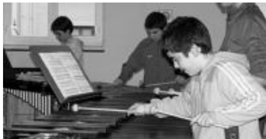
Instrumentu oso ezberdinak jotzen ikasteko aukera ematen du Eskolak.

Musika Eskolako ikasleak direnak, bainan instrumentua aurten