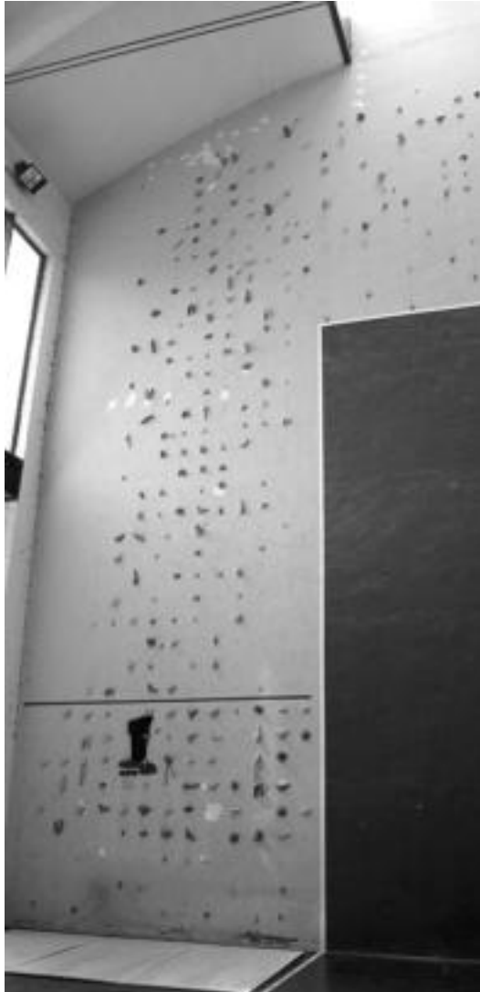
Frontoian atzeko paretan egin dute rokodromo berria. Hamaika metroko altuera du. I. GARCIA

Panel horien eta paretaren artean koltxonetak jarriko dituzte. Hala nahi duenari, boulderra egiteko aukera ematen dio horrek, hau da, sokarik gabe heldulekuetan ibiltzea. Hori bai, marra gorri bat margotuta dago eta hortik gora ezin da igo sokarik gabe. Aurki, rokodromoaren alde batean erabilera arauak jarriko dituzte eta baita egin daitezkeen bideak eta hauen zailtasunak ere. Rokodromo egiteak eta udaletxearen ondoan dagoen parke txiki bat berritzeak