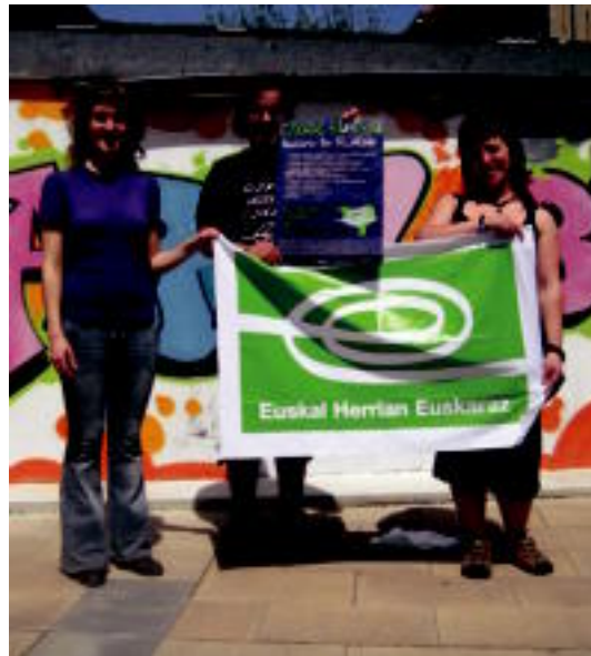
Maiatzaren 8an izango da Villabonako Lehen Euskaraz Bizi Eguna. HITZA

Bukatzeke, festa eguna antolatuko da eta horretan parte hartuko duten taldeak eta pertsonak zehaztu behar izango dira. Maiatzaren 8an izango da Villabonako Lehen Euskaraz Bizi Eguna. HITZA