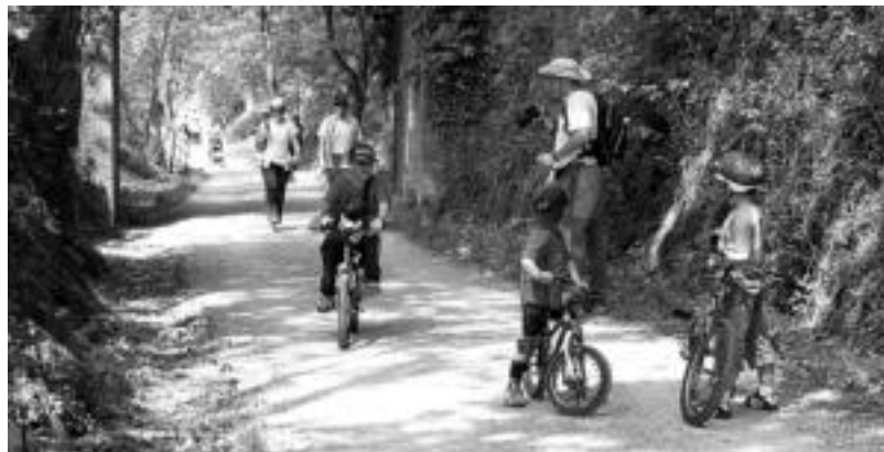
Ibilaldi ezberdinak egin ahal izango dira bihar goizean; honez gain, beste hainbat ekitaldi ere izango dira. N. GARZIA

Leitza » Udalak eta Plazaolako Partzuergoak antolatuta, ibilaldiak, hamaiketakoak, pailazoak eta musika izango dira.