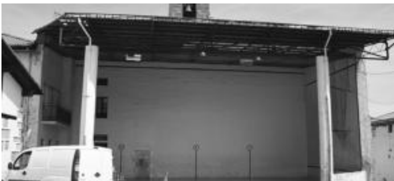
Bidegoianen, Goiatz auzoan kokatuta dagoen pilotalekua berrituko dute.

Aipatu inbertsioen kostu osoa 351.948,26 eurotako da, baina horietatik 350.000 euro Foru Aldundiak jarriko ditu eta gainerakoak Bidegoiango Udalak.