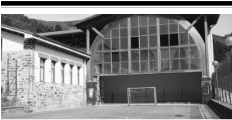
Elduainen pilotalekua eta futbol zelaia konpontzeko asmoa dute jasotako laguntzarekin. E. EZEIZA