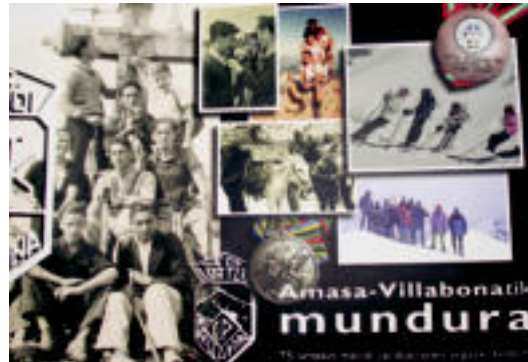
Amasa-Villabonatik mundura liburu. Barnean, dvd-a darama. E. MAIZ

Inork erosi nahi izanez gero, 15 euroren truke salgai jarri dute herriko toki ezberdinetan: Aizkardi Elkarte, Amasako Iturri-Goxon, Villabonako Xaldu eta Xiker