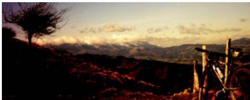
IKAZTEGIETA • Koldo Saez de Egilazek argazki hau bidali du: «Auza-Gazteluko lepotik Aizkorri. Egun ederrak egin ditu inguruko parajeak bisitatzeko».