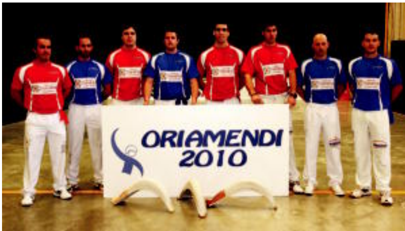
Oriamendi enpresaren jardura gaur bertan hasiko da, 16:00etatik aurrera egongo den jaialdiarekin. JOSEBA ZABALZA

tema bat dauka igotzeko eta altxatzeko, lagungarria oso adineko erabiltzaileentzat». Gelaren barruan egokitutako bainugela dago. Horiiek horrela, gelen %50ak gela pilotuaren azalera bera izango dute. Era berean, Alondegia Tolosa zentroaren lanak «erritmo onean» doazela argitu dute, eta beraz, udaran bukatzea espero dute.