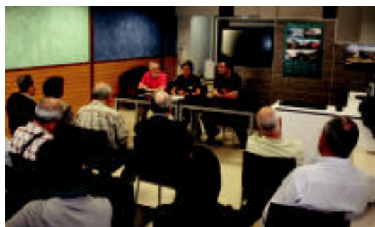
Mendi elkartearen lokal berrian egin zuten lanaren aurkezpena. E. MAIZ

VILLABONA 'Amasa-Villabonatik mundura' izeneko liburua eta dvd-a aurkeztu zituzten Aizkardi Mendi Elkartearen lokal berrian 5