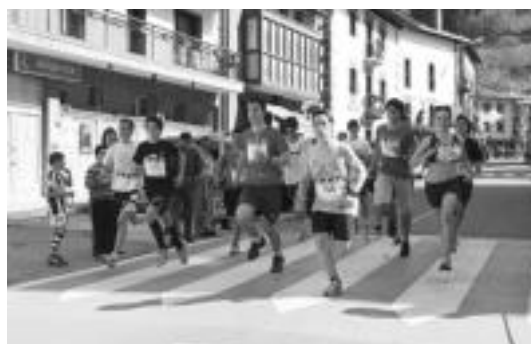
Junior mailakoak irteera puntuan. ESTI EZEIZA