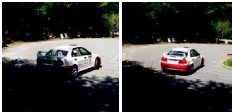
Ikuskizuna eskaini zuten auto gidariek atzoko Ñañarri Rallysprintean. ASIER IMAZ