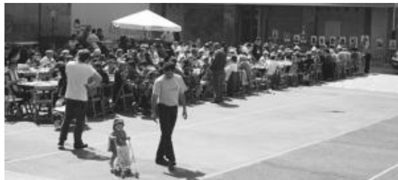
Errebote plazan bertan egin zuten bazkaria Aiztondora Egunean bildutakoek. A. IMAZ