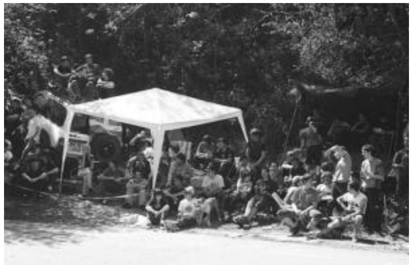
Ikusleentzat edozein txoko ona zen Rallysprintaz gozatzeko. ASIER IMAZ