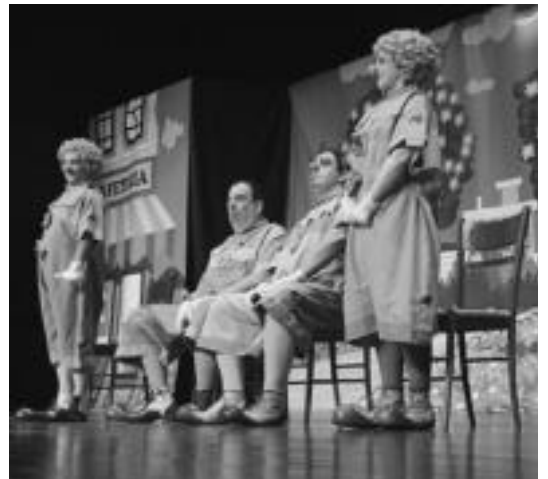
Mokolori iragan larunbatean pailazoek egindako omenaldia. I. TERRADILLOS

Tolosaldeko eta Leitzaldeko HITZAn jarri eta Gipuzkoako beste 4 Hitzetan DOAN agertuko da