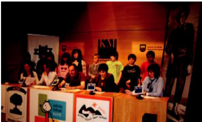
Imaz Bertsolaria eskolako ikasleak izan ziren, besteren artean, atzoko aurkezpenean.

ERREAKZIOA Bildarratzek eta Azkuek, Alkateak eta Hirigintza zinegotziak, Udalaren ikuspuntua azaldu dute 3