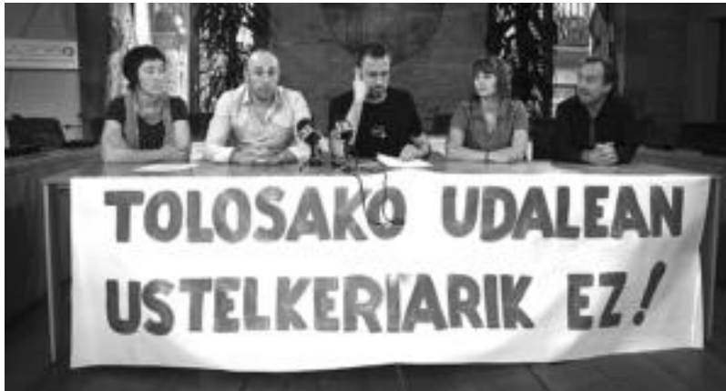
Tolosako Ezker Abertzaleko hainbat kidek prentsurrekoa eskaini zuten herenegun. ASIER IMAZ

Epaia honela aztertu zuen herenegun Aitor Iztuetak: «Gure helegitean 10 puntu agertzen ziren: