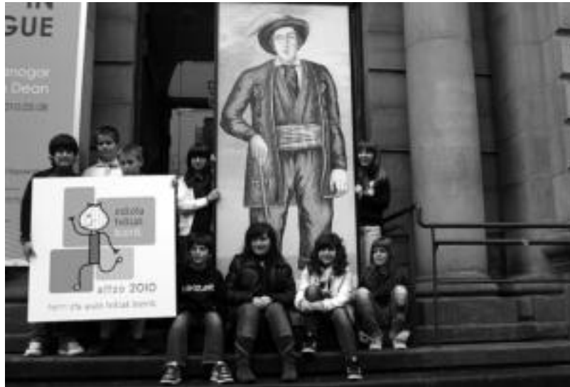
Imaz Bertsolaria eskolako ikasleak festaren leloarekin eta Altzoko Handiaren irudiarekin. I. GARCIA

patzen da eta aurtengoa 23.a izango da. Orain arte egindako 22 festetatik erdiak eskualdean egin dira. Egun eskola txikien koordinatzaileak 26 eskola daude Gipuzkoan eta guztira 1.200 ikasle dira. «Festaren helburua eskola txikietako haur, guraso eta irakasleak elkarrekin egun eder bat igarotzea da», azaldu du Karrerak. Olanok gaineratu duenez, «txikiak izanik denon batura horrek egiten gaitu handi». Hori azpimarratu nahian eraman zuten Altzoko Handiaren irudia prentsaurrekora.