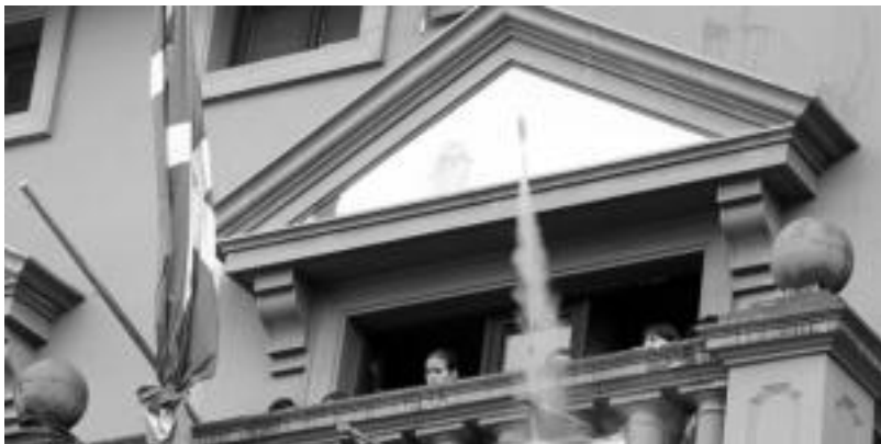
lazio festei hasiera eman zien txupinazoaren irudia. I. GARCIA

200 euroko saria jasoko du irabazten duen kartelaren egileak eta lanak aurkezteko azken eguna hilak 26a, astelehena, izango da.