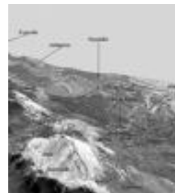
Aratz mendiko planoak. HITZA

Irteera Ibarra-ko plazatik egingo dute. 08:30ean abiatuko dira. Ibarra-ko taldeetako kideek jende oro gonbidatzen dute txangoan parte hartzera, eta gogoratu arazi, beti bezala sorpresatzen bat izango dela. Informazio gehiagonahi duenak 652 71 58 00 telefono zenbaki-