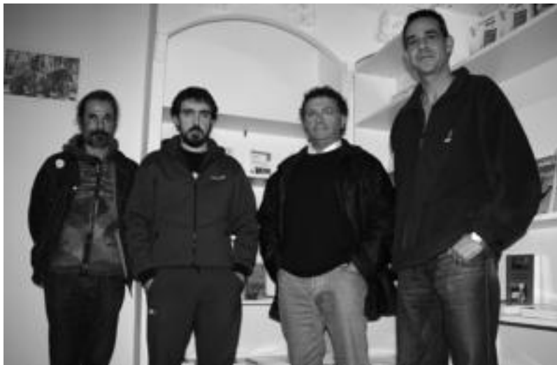
Hainbat liburu aurkeztu dituzte Engels Ateneoan, horien artean 'Manifestu Komunista'. I. TERRADILLOS

gesek eta erreformistek sistema honen onurez hitz egiten digute, existitu daitekeen sistemarik hobereena kapitalismoa dela ziurtatzen digute. Ontzi berdinean gaudela, krisian denok -bai burgesak bai langileak- sakrifikatzen ari ga-