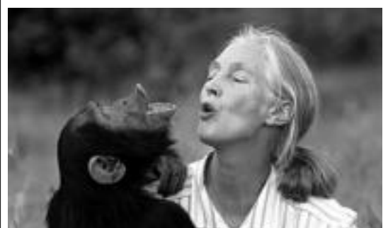
Jane Goodall Tanzanian txinpantze batekin. HITZA

■ Ileapaintzailea. Ibarra 0 ilea-paindegi batek laguntzailea behar du. metxa2@yahoo.es . 609 79 27 87.