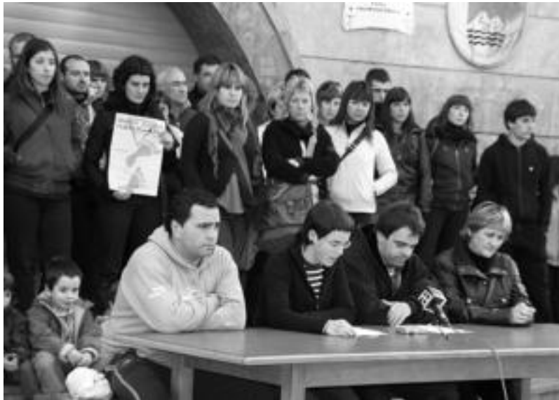
Atzo iluntzean Ibarrako hainbat talde eta elkarte bildu ziren, larunbaterako ekitaldien berri emateko. E.E.

Larunbaterako jaialdia antolatzearen asmoa, Udalak hartutako azken erabakien ondorioz sortu zen.