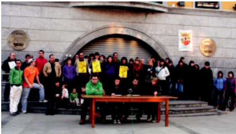
Ibarrako 22 eragiletako hainbat ordezkari herriko plazan. ESTIEZEIZA

ERAGILEAK Besteak beste Alurr, Sendi Ekintza, AAM, Txiribitu eta Gazte Asanblada aurkitzen dira zerrendan »