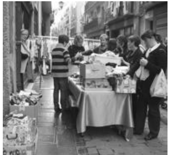
Kaleetan ere, jendeak zer ikusia eta erosia izan zuen. E. MAIZ

■ Euro 1. Sarrera ordaindu beharko da baina, Txurrerian 6 txurro edo herriko 16 tabernetan sarreraren truke pintxo bat jateko aukera izango da.