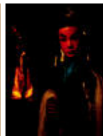
Sheng pertsonaiek gizon ederrak izan ohi dira.1