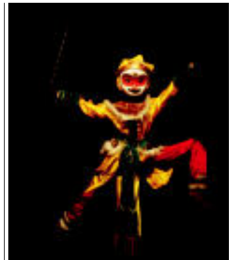
Shen Gual pertsonaia berezia da, hainbat trebezia izaten baititu.1