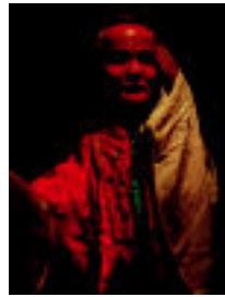
Lao Shen pertsonaiek jakiduria irudikatzen dute.1