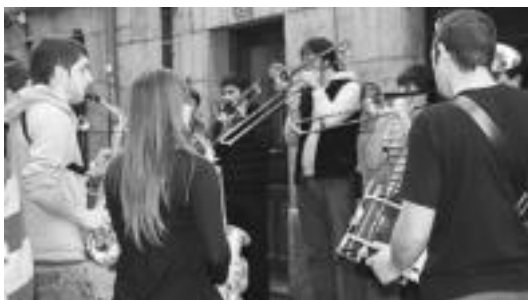
Kaleak animatzeko lana Bonberenea Txarangarena izan zen. E. MAIZ