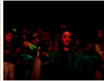
Mota askotako Dan-ak daude: neska xarmagarrietatik hasi eta gerlari ausartetaraino.1