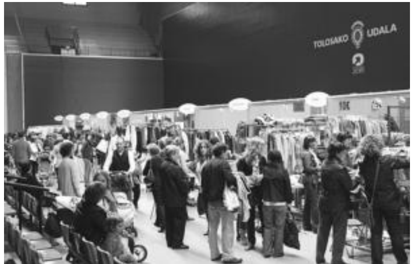
Beotibar pilotalekuan ez zen jenderik faltatu. 10:00etan jendea atea zabaltzeko zain egon zen. E. MAIZ

Musika eta etxerako produktuen kasuan, jende gehiena ikustera mugatzen zela adierazi zuten, baina arropa eta oinetakoekin kasuan, orokorrean salmentekin gustura agertu ziren. Sartzeko euro bat ordaindu behar izateak