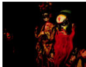
Ilusleei emozioak sorrarazteko ardua izaten dute. Jing pertsonaiek.1