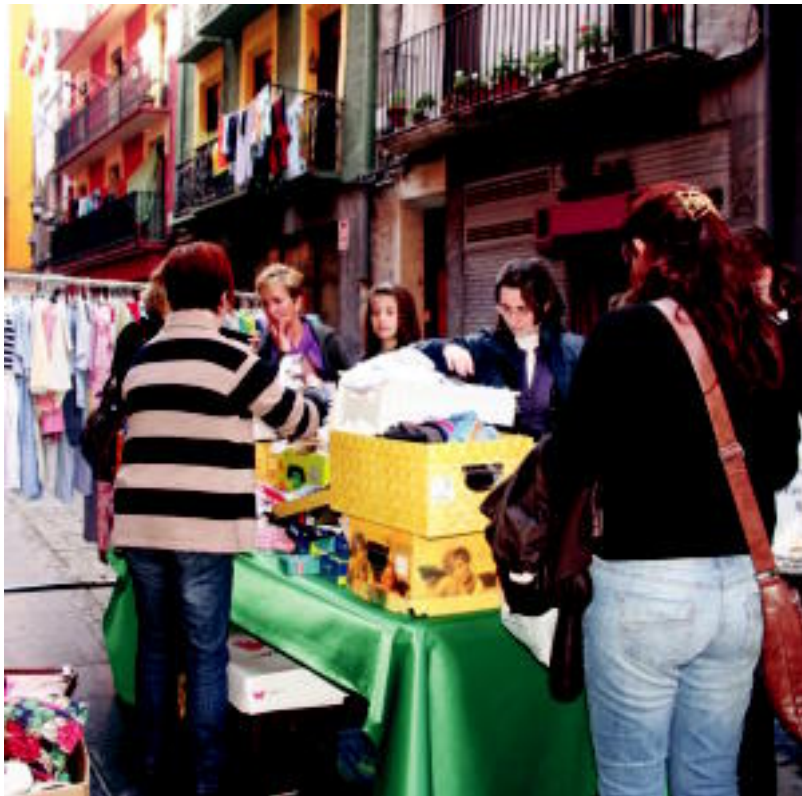
Stock and Braderie ekimenak jende ugari erakarri zuen atzo Tolosara. ENERITZ MAIZ