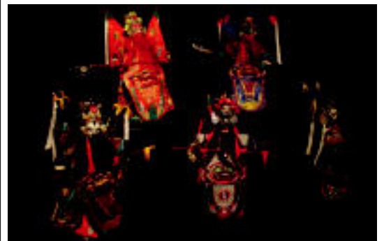
Topic-en ikusgai daude txinatar txotxongiloak.

ALEGIA Udalak eta hainbat merkatarik plastikozko poltsak ordezkatu nahi dituzte 7