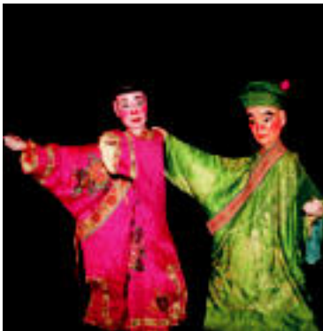
Chou da pertsonaia dibertigarri eta ahilena, eta zintzoa nahiz gaiztoa izan daiteke.1