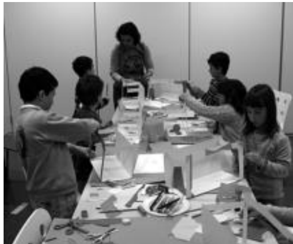
Atzo paper antzerkia egiten hasi ziren tailerrean parte hartzen ari diren 15 gaztetxoak. Gaur euren ipuinetako pertsonaiak egingo dituzte. I. TERRADILLOS

Teknologiaz inguratutik bizirik garen garaia hauean ia pentsaezina dirudi gaztetxoak ordenagailurik edota bideojokorik gabe dibertitzen ikustea. Berrikuntza horiekin, ordea, bigarren maila batera igarotzen dira betiko jokoei gordetzen dituzten ezaugarriak, hau da, sormena lantzea, irudimena piztea, gauzak tartekatzen ikastea edota hezkuntzan eragitea bezalakoak. Bada, balore horiek gaztetxo nahiz helduei ari dira sustatzen egunotan, Topic Txotxongiloen Nazioarteko Zentroan, paper antzerki tailerrean.