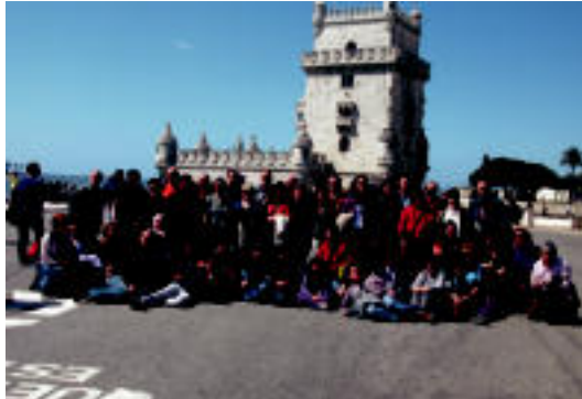
Turismoa egiteko aukera izan dute Abesbatzakoeak. Argazkian, Lisboan. HITZA

Alegia » Portugaleko Evora herriko abesbatzak gonbidatuta, Aste Santuan izan dira, besteak beste, euskal abestiez osatutako kontzertua emanez.