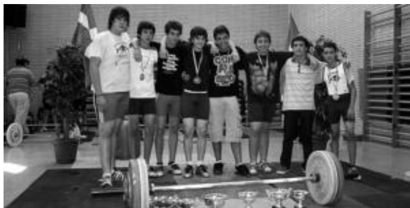
Irailaren Gipuzkoako Txapelketa jokatu zuten Villabonan bertan.