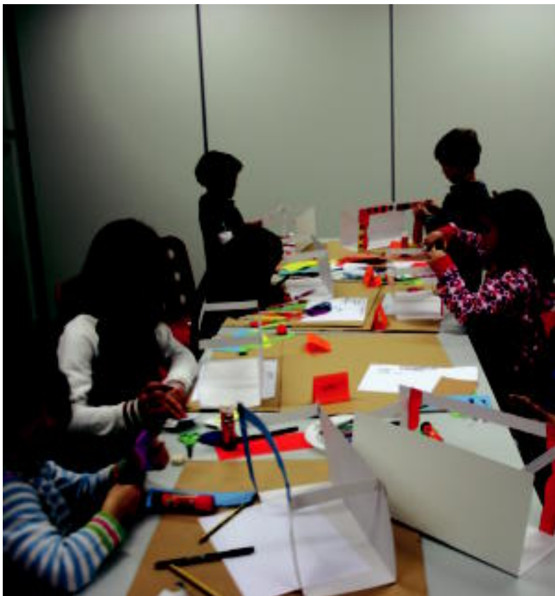
Gaztetxoak ederki ari dira Topic-en egun hauetan; bihar izango dute euren lana pazartzeko aukera. I. TERRADILLOS