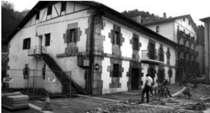
Herri Zentroa egiteko Aierbenea etxea berrituko dute. I. GARCIA

Beste inbertsio garrantzitsua Espainiako Gobernuak bultzatzen