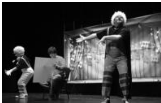
Tatxin eta Tatxan Tolosako Leidor antzokian. ESTI EZEIZA

Haur eta gaztetxoei zuzendutako programazioaren baitan, Hau natura! Airea, lurra eta ura txotxon-