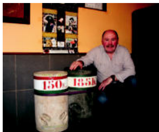
Adunako Uztartza Jatetxean harriak ikusgai daude. E.MAIZ