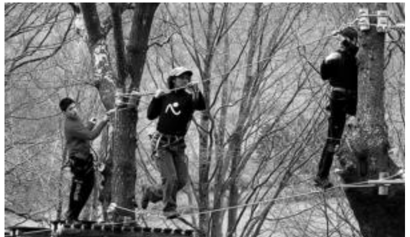
Txindokiko itzala Larraitzeko abentura parke berriak bisitari ugari izan ditu. HITZA

Turismo bulegoaren esanetan, gorakada honetan zeresana izan dute Topic zentroak eta ireki berri den Larraitzeko abentura parkeak; «eskualdea helburu erakargarriago bihurtu dute eta lagungarri izan dira bisitariak gure eskualdea aukeratzeko garaian».