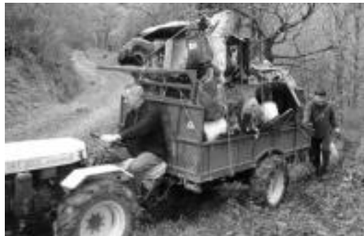
Urtero traste ugari aurkitzen dituzte inguruak garbitzerakoan. HITZA

Izan ere, «urria egiten duenean, zaborretan ura kutsatu eta ondoren ur horrek erreka kutsatzen du. Zabor kutsakorra kentzea ezin-