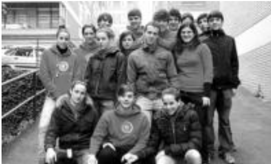
Tolosaldea Igeriketa Kirol Taldeko igerilariak. HITZA