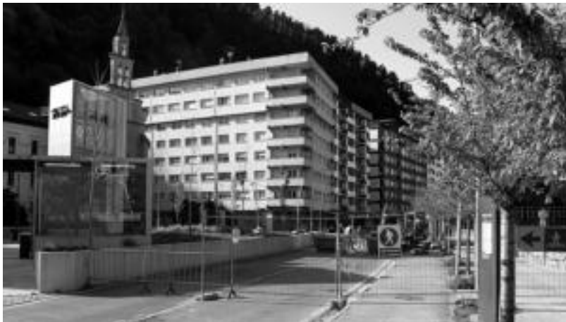
Kolektorearen lanak apirillean amaituko direla aurreikusten dute Tolosako Udal ordezkariak. ASIER IMAZ