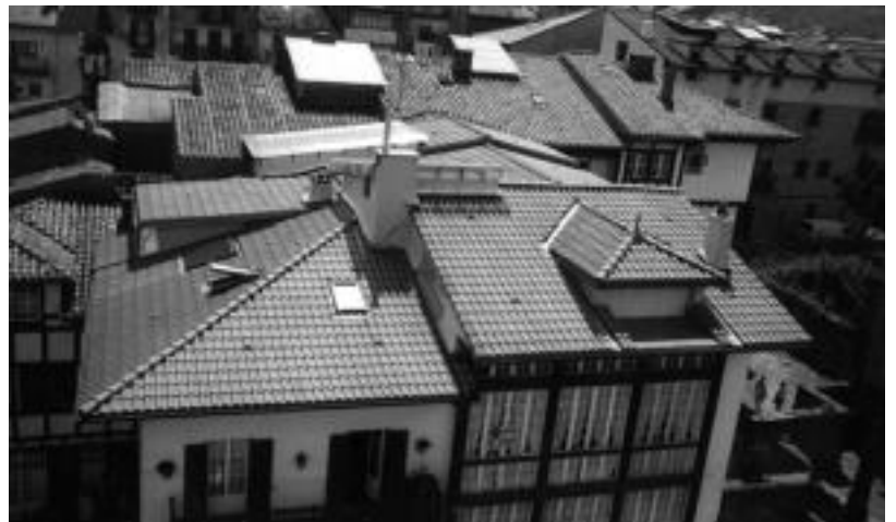
Teilatuak dira Pagola eraikuntzak enpresaren berezitasuna; irudian, Hondarribian egindako obretako bat. HITZA