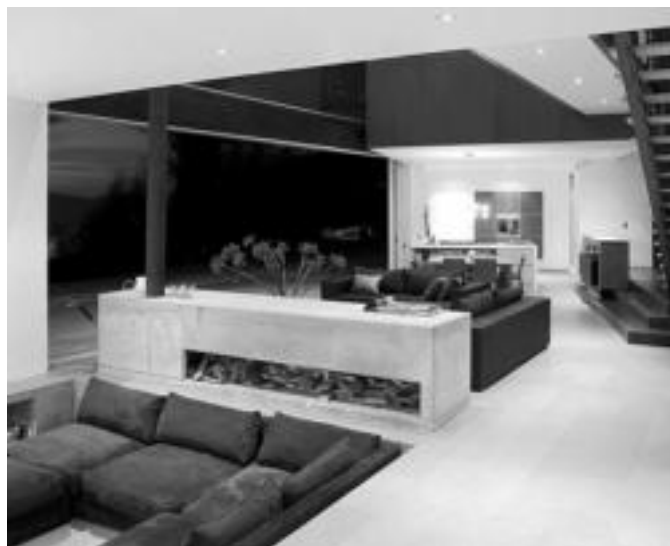
Egongela argi baxuak jartzeko etxeko guinea da.