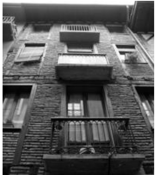
Letxu kaleko etxebizitza baten aurrealdea berritu dute Pagola-koek. E. EZEIZA

Bai, nahikoa. Horregatik segurtasunari garrantzia handia ematen diogu. 2000. urtean erdi mailako lan segurtasuneko agiria jaso genuen.