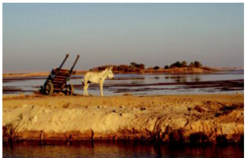
Egipton ikuspegi zoragarriez gozatu ahal izan dute.