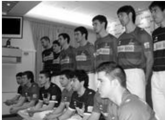
Atzo aurkezpenen izan ziren pilotariak. ASEGARCE

Bi enpresek atzo aurkeztu bazuten ere, Promozio Eskuz Banakako Txapelketa honetako lehen partidak jada jokatuak daude eta badakigu zein pilotari diren aurrera doazenak. Finala, ekainaren 13an jokatu da eta bitartean pilotari guztiak elkarren aurka jokatu