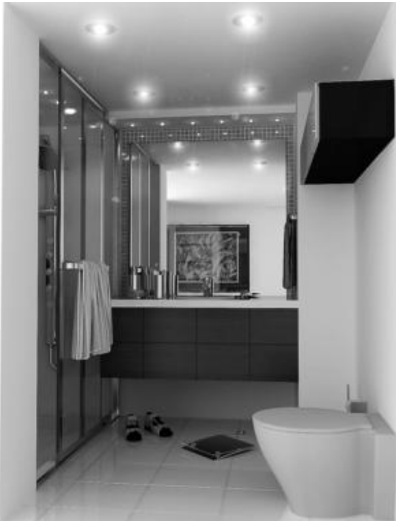
Komunean argi biziak behar ditugu, eta normalean asko jarri ohi dira.

Logelaren kasuan, zonaldearen arabera ezberdintasunak daude, erabilpen nagusien artean, lo egitekoa eta janztekoa baitaude. Honenbestez, «ohearen inguruan ez