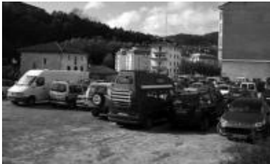
Beheko Biden egingo dute eraikina.