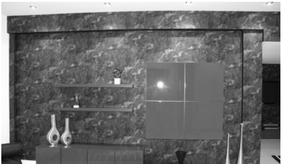
Gelei ukitu berezi bat emateko, egun papera erabiltzea modan dago; gelako hormetako batean jartzen da hau, eta gainontzekoak margotu egiten dira. HITZA