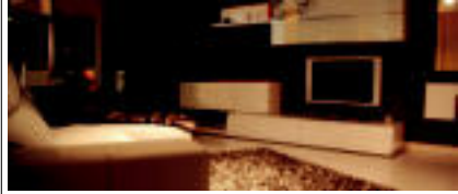
Lehen ez bezala, egun altzariak txikiak izan ohi dira.