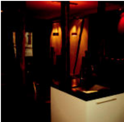
Txuria eta beltza asko ikusten dira azkenaldian. Egura bezalako ulitu tradizionalak ere oso gustuko ditugu.

Altzari handien errepertarioa zi-tzian lehen, eta zuten neurritan ar-bera antolatzen zen ia guztia. Egun, berri, nekaz ikusiko ditugu horrelakoak. Beharren eta joroen arabera, etxe antolatzeo modia asko aldatu da. Iraupen zehatzik ez dute beldurak dira, eta gustatu ala ez, lehenago ala beranduago betiristen dira gurera.