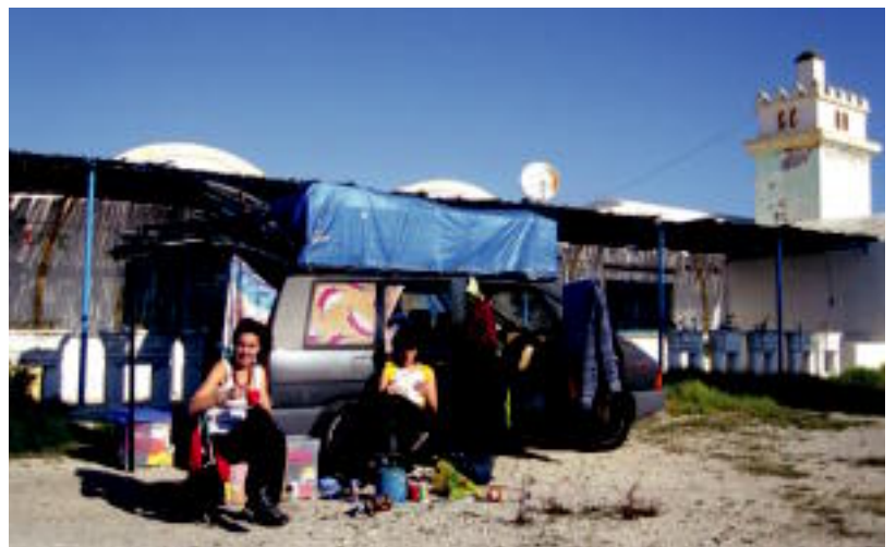
Tunis izan zen Afrikako abenturako lehen lurraldea. Abenduan izan ziren bertan.

■ www.afrikatxakanam.blogspot.com . Euren abenturak Interneteko helbide horretan jarrai daitezke. Argazki ugari ikusteaz gain, iritziak ere sar daitezke.