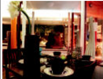
Egura beti ikusten den elementua da, azkenaldian gutxiago ikusten den arren.