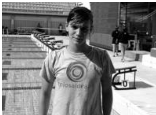
Marta Alonsok bi domina lortu zituen. HITZA