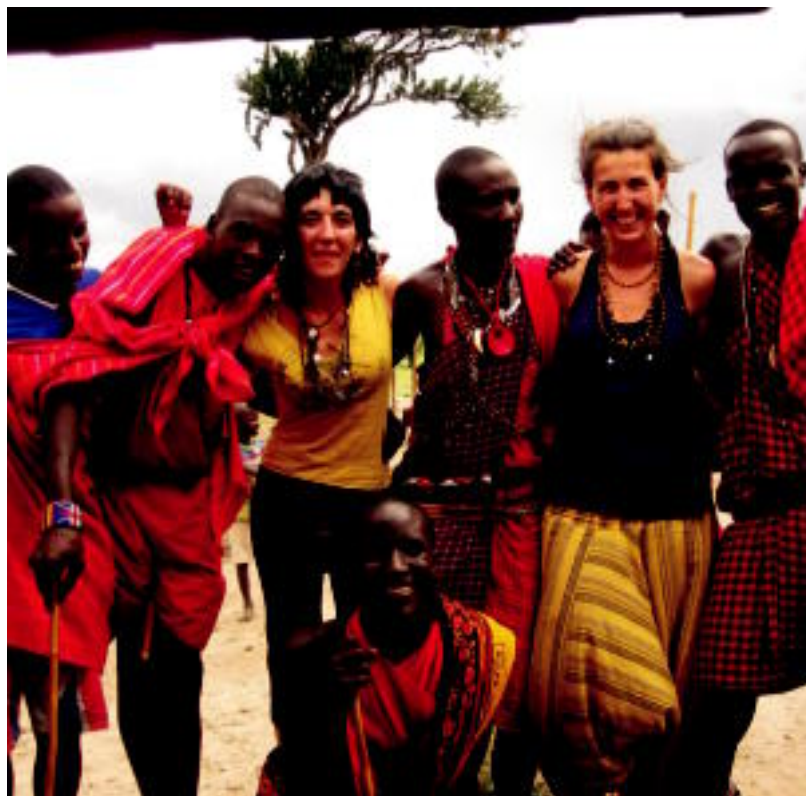
Billabonatarrek Kenian daude une honetan, Sekenan izena duen herrian, Masaiekin elkarbizitzen. HITZA

'AFRIKATXAKANAM' 'Ama Afrika' izan zen lehen bidaiaren izena, oraingoan Wolof hizkuntza aukeratu dute 4-5