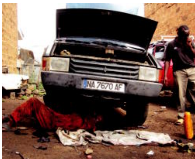
Milika kilometro ari dira egiten euren furgoneta zahharrekin. Arozotxo batzuk ere izan dituzte.