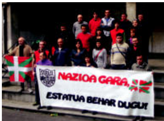
Anoetan ere Aberri Eguneko martxara joateko deia egin dute. HITZA

Apirilaren 4an, Aberri Egunean, bi martxa izango dira Independentistak aldeak deituta. Bata Irundik Hendaia joango da eta bestea, Hendaia-Itzurunera, Bidasoa zeharkatuz. Leloa Nazioa gara, Estatu behar dugu izango da eta bi martxak 11:30ean elkartuko dira. Horiek horrela, Adunako Udalak