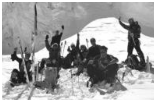
Pasaban eta taldekideak bigarren kanpalekura bidean.

Oinarriko kanpalekuan atsedean hartu ondoren, indarberrituri daude berriro. Gailurrera begira jarrita daude, eta guztia aurrerazi bezala badoa, apirilaren 10erako egitea espero dute.