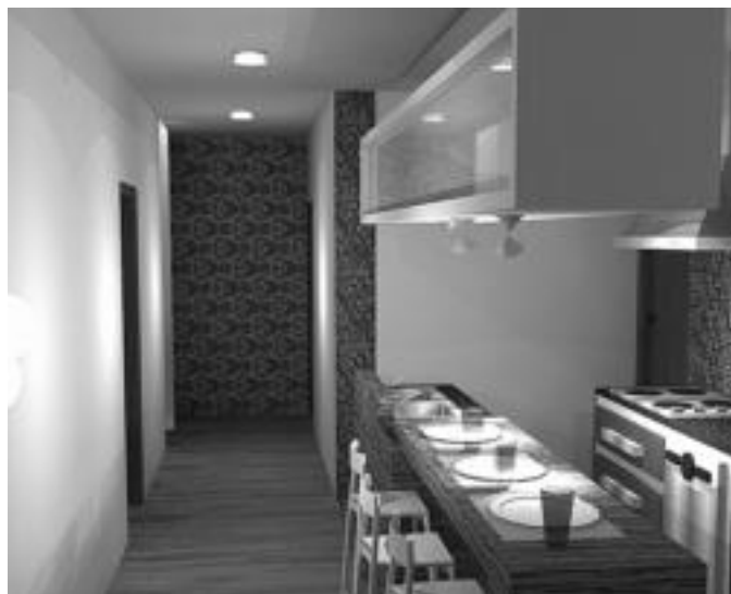
Sukaldean ere argi biziak jarriko ditugu, beharrean egoten baikara bertan.

Argi instalazioak ez ezik, musika sareak edota telebistarenak ere jartzen aritzen dira Ibarra argi-lanak-en. Diotenez, geroz eta gehiago jarri ohi dira musika sareak etxeetan. Etxeko gela guztietan edota norberak aukeratzeko duen txokoa jartzen dituzte bozgorailuak. Horrekin batera, telebistaren eta telefonoaren kableen instalazioa ere hartu beharko dugu kontuan, «instalazioak epe luzean izaten baitira». Horretan ere gehiago pentsatzen da gaur egun, eta instalazioaren hoditerian lekua utzi ohi da aurrera begira edozein motako kablaren bat erraz sartu ahal izateko.