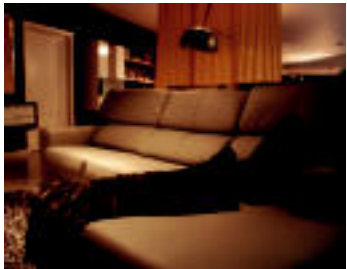
Sofa da egongelako elementu garrantzitsuena eta horren arabera antolatuko dugu gainerakoa.