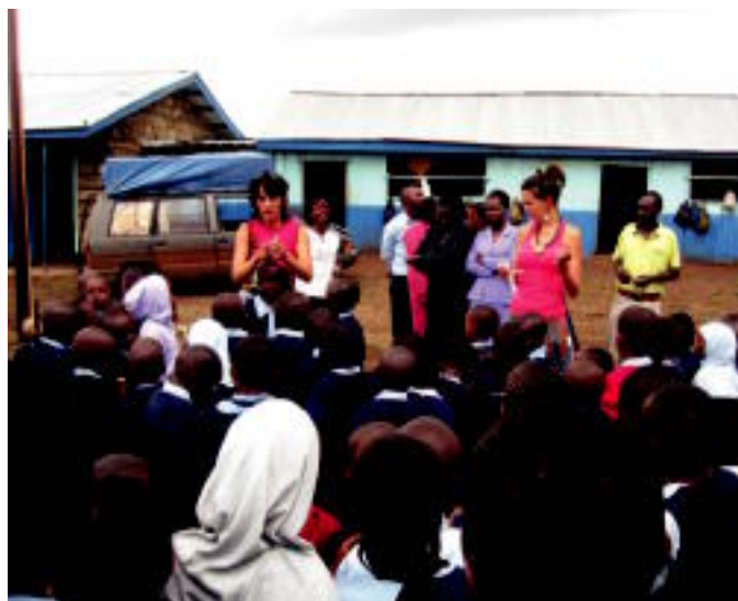
Keniako ikastetxe batean materiala banatzen gatzetxoaren artean.

Une honetan Masaiekin gaude Kenian. Hemendik, Victoria laku inguruko herrixka batzuk bisitatzea joango gara, eta gero Ugandara. Handik, ziurrenik Ruanda eta Tanzania, ondoren auskalo! Mapa oso handia da eta lurralde interesgarri piloa ditugu inguruan. Gure asmoen arabera, uztaierako bueltatuko gara etxera, eguzkiaren epeltasunera badaezpada ere. [kar, kar] Baina, hori ere auskalo!