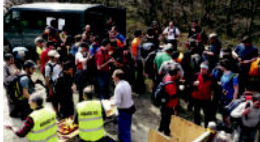
Guztira 1.136 pertsona bildu ziren herenegun. HITZA

bertako egunkaria egin zaitez harpidedun!