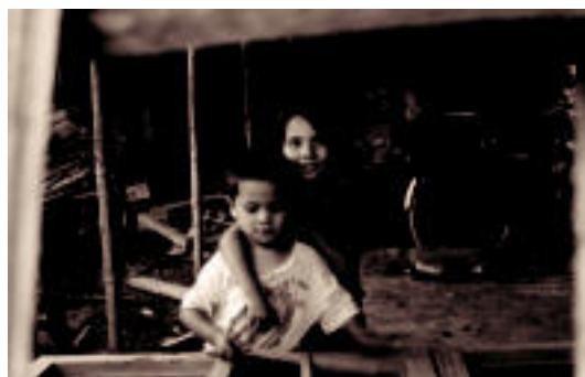
X. edizioan parte hartu zuen argazkietako bat. HITZA

LEHIAKETA Aste Santuetan ateratako argazkiak apirilaren 28ra arte bidali ahal izango dira 4