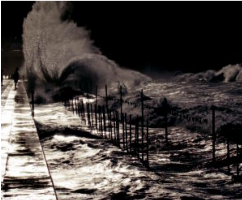
Kerrek eta Ainarak Zarautzen ateratako argazki honekin irabazi zuten X. HITZA Argazki Lehiaketa. HITZA

Aste Santuen oporraldia ere iritsi da eta urtero bezala TOLOSALDEKO ETA LEITZALDEKO HITZAK Argazki Lehiaketa antolatu du. Hamaikagarrena izango da eta hiru sari izango dira. Maiatzaren 9an argitaratuko ditugu irabazleak.