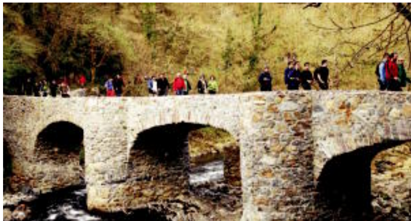
Eguraldi bikaina egin zuen, eta horrek ere jendea parte hartzerantz animatu zuela uste dute antolatzaileek. HITZA

■ Partaide kopurua. 1.136 lagun; 897 gizonetako eta 239 emakumezko. ■ Ibilaldi luzeko partaideak. 677 lagun; 597 gizonetako eta 80 emakumezko. ■ Ibilaldi motzeko partaideak. 459 lagun; 300 gizonetako eta 159 emakumezko. ■ Partaide federatuak. Guztira 698 lagun; 582 gizonetako eta 116 emakumezko. Ibilaldi luzean 517 atera ziren eta motzean, berriz, 181.