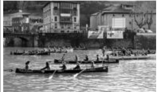
Tolosara Ligako bandera ekartzeko aukera handia dute. HITZA

Sutargi, Izena duen guztia omen da eta Bideak lanaren ondotik laugarren ikuskizuna du Gernika Aukeran dantza konpainiak.