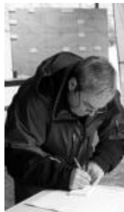
Auzotarrak ekarpenak egiten. N.L.

euoren truke, edota egunean bertan bestela, 12 euroan. Helburu bera izango dute bi ekitaldiek, Sahararen alde dirua biltzea, Tolosaldea Sahararekin elkarrekin bultzatzen ari den hezkuntza proiekturako, hain zuzen.