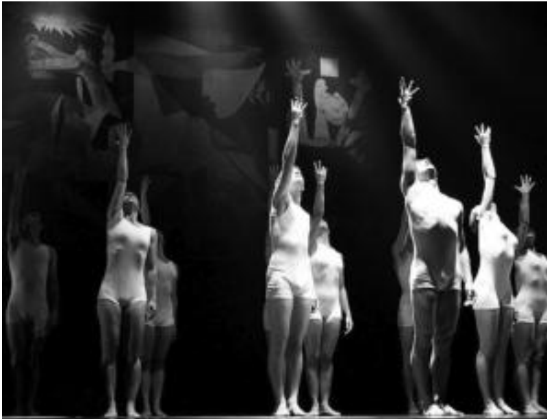
Bonbardaketa eta Picassoren 'Gernika' margolanen oinarrituriko lana da. ANDONI TEBAR