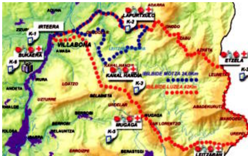
Ibilbide luzea eta motzak zeharkatu dituen eremuak.

Ibilbide motzaren kasuan 24 kilometro eta 1.150 metroko desnibela izango ditu. Irteera ordua, 08:00etan izango da eta ibilbidea Villabona, Otieta, Lapurtxulo, Astabizkar, Amasola, Praxku, Kanal Handia, Lastur eta Villabona izango da. Kasu honetan, bost orduetan bukatzeko moduko ibilbidea dela diote antolatzaileek.