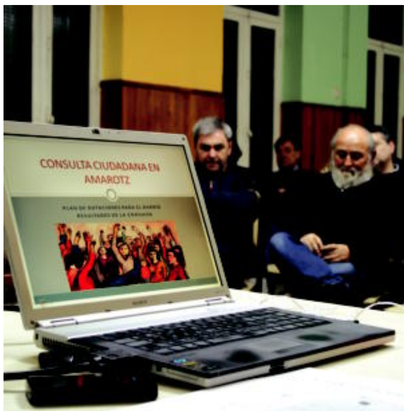
Galdeketa emaitzak aurkeztu dituzte Amartzeko Auzetxean. A. IMAZ