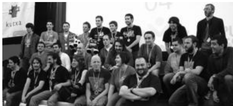
Gipuzkoa Encounter 4 topaketako lehiaketetako irabazleak.

Gipuzkoa Encounter topaketa herenegun egin zen sari banaketarekin amaitu zen. Hainbat salletan banatu zituzten, eta horien artean, Modding lan onenari emandakoa, Ciberfrikik irabazi zuen.