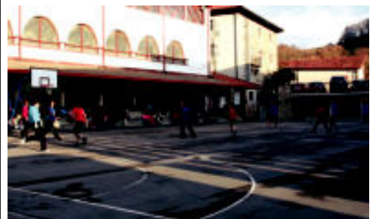
Ostiralean herriko gazteen arteko futbol partidak izan ziren. E. MAIZ

TOLOSA Amalur ekimenaren baitan Ander Izagirrek bere bidaien inguruan hitz egingo du 3