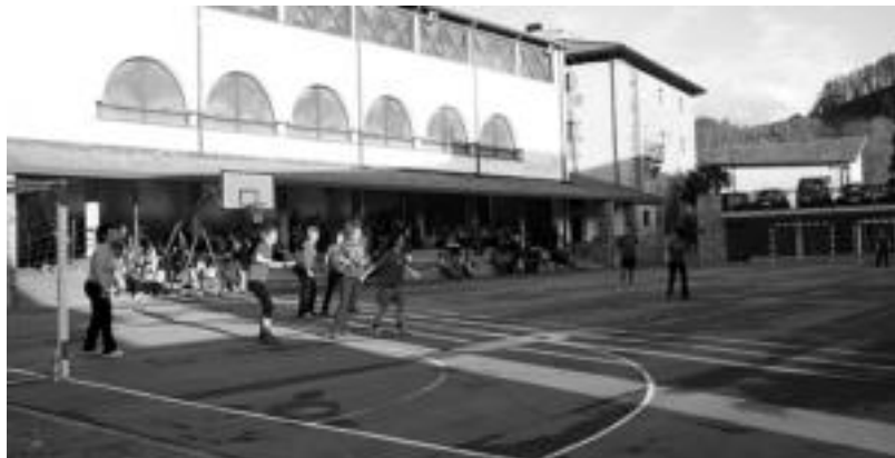
Ostirlean herriko gazteen artean futbol partidak jokatu zituzten; alde batetik neskena, eta bestetik, mutilena. E.M.

Berastegi » Asteburuan ospatu dituzte Urepel elkarteak antolatutako Gazte Festak; gustura daude antolatzaileak.