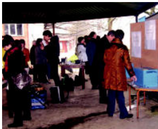
Auzo galdeketa egunean, auzotar asko pasa zen bertatik. HITZA

Auzoaren inguruko galdeketak gai desberdinen inguruan egin zi-