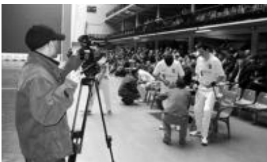
Aurrera-Saiaz eta Aurreraren arteko Berria Txapelketaren finalerdia. A. IMAZ

Emaitza honekin lidergoan galdu zuen Laskorainek. Orain dela aste batzuk lortutako abantaila dezentz murriztu zaion arren, norgehiagoka zuten eta erabakigarri ugari gelditzen dira oraindik gorako oilarren artean, honek esan nahi duenez edozein momentutan aldatu daitezke berriro boladaren norabidea. Lanean jarraitzea egokitzuten da oraindik.