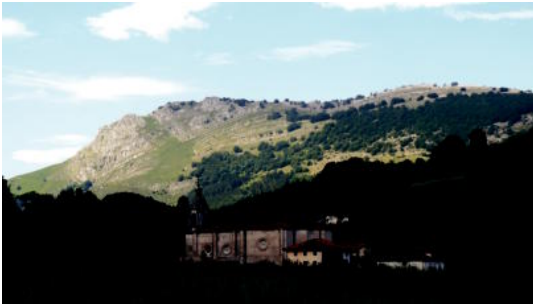
Bidegoian herriaren atzean, Ernio mendia. E. MAIZ