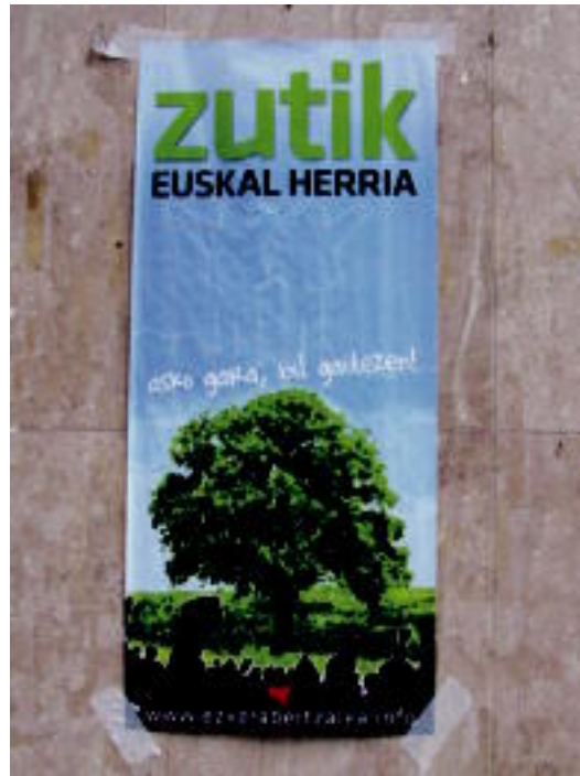
Ezker abertzaleak 'Zutik Euskal Herria' agiria ari da aurkezten. HITZA