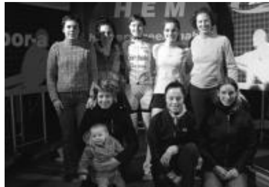
Tolosarrak Zarauzko taldearen aurkako kanporaketan.