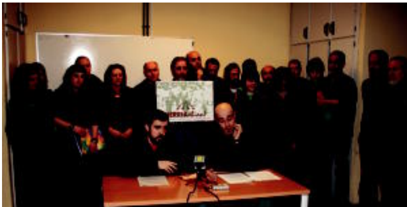
Eskualdeko gizarte eragile desberdinetako ordezkari ugari bildu zen atzoko agerraldian.

BIGARRENA Geldialdiaren osteko hurrengo partida bihurtan jokaturako du Eibarko Astelena pilotalekuan 5