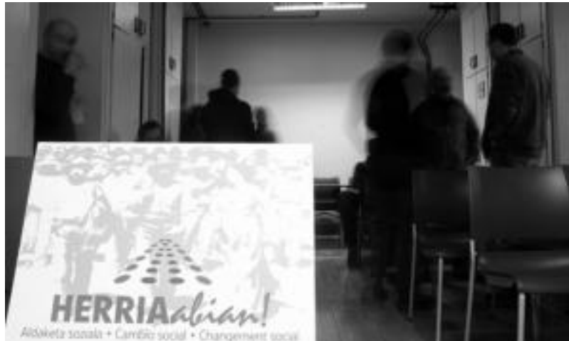
Eskualdeko gizarte eragile desberdinetako ordezkariak atzo, Tolosako Kultur Etxean.

«Krisia delakoaren aitzakian paitzen ari garen erasoaldi atzerakoari aurre egiteko, aldaketa so-