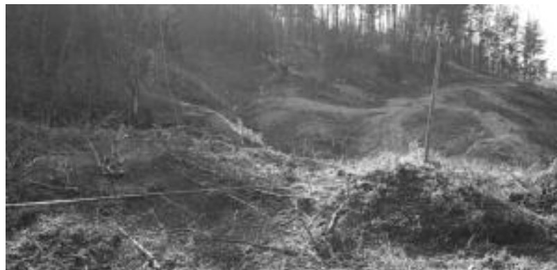
Tolosako Ugane auzoan, Ikaztegieta inguruan, zuhaitzak errotik moztu dituzte AHT egiteko.

Lurjabe batzuen egoera ikusita Elkarlanak hauek «ezin ditzakegu laguntzarik gabe utzi» esan du, «beraiekin bat egin behar dugu» nabarmenduz eta pasaden otsailaren 6an Tolosa zeharkatu zuen