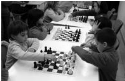
Xakean ikasi eta jokatzeko aukera izango dute anoetarrek. I. GARCIA

Aste Santutako oporretan, xakeaz gozatu edota xakean jokatzeko ikasteko aukera izango dute anoetarrek. Alde batetik, xake taulak