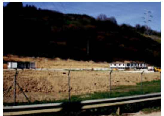
Ugane auzoan hasi dituzte jada AHTren lanak. E. MAIZ

TOLOSA Egun batzuk girora egokitzen egon eta gero iritsi zaie erronkari aurre egiteko unea; hilabete inguruko epean iritsiko dira gailurrera 3