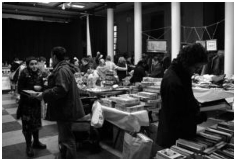
Lehenengo egunetik gerturatu zen jendea Kultur Etxean jarri zuten Merkatu Txikira.

Jasotako babesak Nikaraguako proiektuaren alde lanean jarraitzeko indarra ematen diela azaldu dute, horregatik, Tolosan antolatzen diren San Joan jaietako eta Gabonetako Azoka Berezietan izango dira beste urteetan bezala. Bestalde, Kutxan duten kontu korronte zenbakia (2101 0081 1501