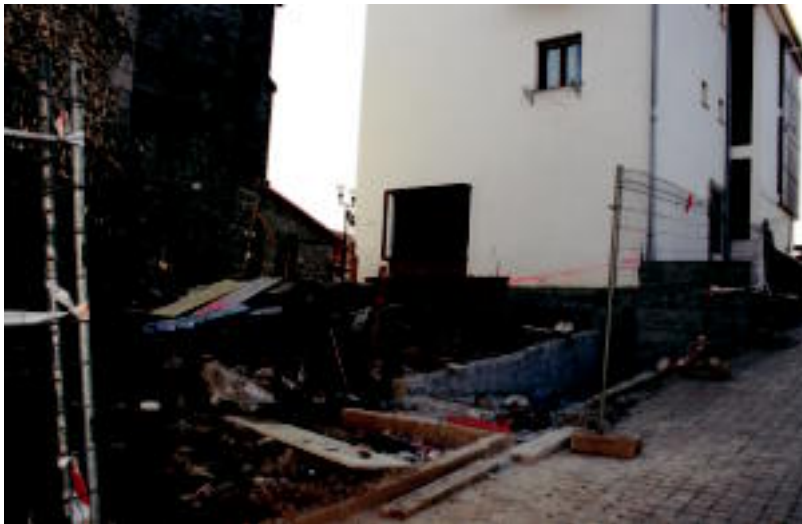
Herriko plazan dagoen eraikinean egingo dituzten Musika Eskolako gelek atzeko aldetik izango dute sarrera. E. MAIZ