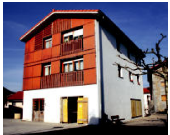
Herriko plazan dagoen eraikinean egokitze lanak ari dira egiten. E. MAIZ