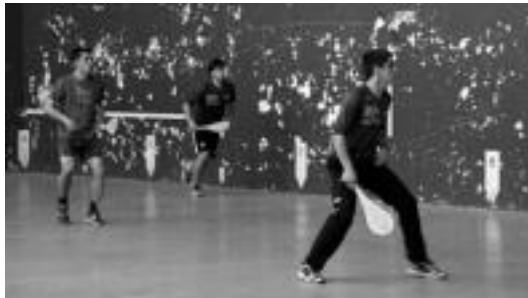
Etzi, pala txapelketako finalekin ekingo diete jaiak. NEREA URBIZU

Ostegunean, lehendabiziko egunari amaiera emateko, Tolosaldeko bi talderen kontzertuak izango