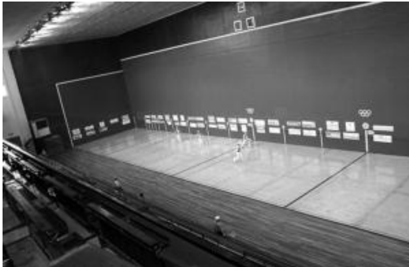
Galarreta frontoian garai berri bat hasiko da apirilaren 1etik aurrera. HITZA

«guk esan genion gauza guztien gainetik erremontearen segida nahi genuela. Ez genuela baloratu duela ordainduko zituzten gurekin zituzten zorrak. Konturatu ziren serio gindoazela eta ez genituela gure interes propioak bakarrik begiratzen. Guk bai benetan erremontearen alde begiratzen genuela, beraiek ez zutena egiten».