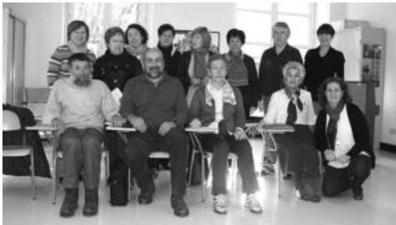
Esperientzia Eskolako ikasle, irakasle eta koordinatzailea Tolosako Musika Eskolan. ASIER IMAZ

Mugabe elkarteak antolatu du Tolosako Esperientzia Eskola, hirugarren urtez jarraian. 50 urtetik gorako pertsonen zuzendua dago eta bertan izena emateko aurretik ez da behar titulazio akademiko-