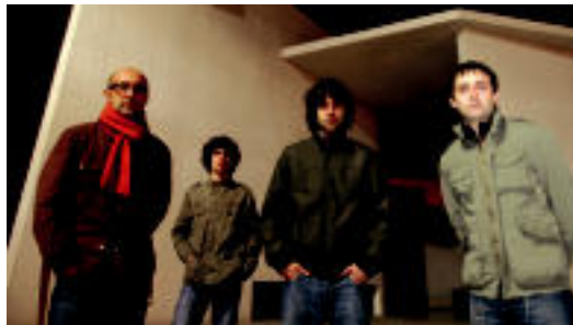
Bide Ertzean taldea lan berria prestatzen ari da. HITZA

rizango dira eta baita Eskoriatzan ere. Elorrion Ateneoan bihar eskainiko dute zuzeneko 22:30etik aurrera eta Eskoriatzan berri, Unibertsitatean izango dira ostiralean 22:30ean.