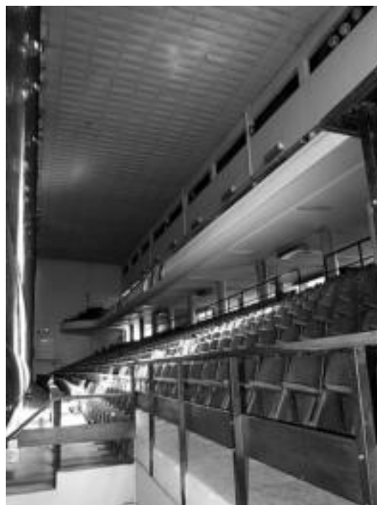
Samperrek, besteak beste, Galarretaren eserlekuak aldatuko ditu. HITZA

Erremontea desgertzeko arriskuan egon da. «Pena handiena horrela bukatzea zen», dio pilotari elduaindarrak. «Ostegunetan oraindik oso txukun dabil pilotalekua jende aldetik eta pena bat izango zen bukatzea. Etorri direnak uste dut lanerako etorri direla. Uste dut lana eginez aurrera aterako dugula». Gazteluk ere baikor begiratzen dio geroari: «Guretzako oso garrantzitsua da erremontea aurrera segitzea eta pixkanaka, gauzak ondo badoaz, goraka joanen da. Ateak itxita badaude, deus ez dago, eta irekita segitzen badute beti aukera bat dago».