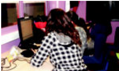
Topalekuan Encounterren irauten duen bitartean Usabalen egongo diren jokoa jarriko dituzte.

Usabal kiroldegia hilaren 18an zabalduko dira atek. Gipuzkoa Encounter IVeko partaketa gehi- nak orduan iritsiko dira Tolosara, inoagaruzio ofiziala baino aurreratzen lehena, bezar. Antolatzaileen esanetan, atek egun bat lehena gozabaltzaren arazoak prestatu- n aurkitzen da: «Lo egiteko kanpin-dendak jartzen dituzte alda basteik, besteak, garrantzi- tsuena, ordengailuak prest jarri behar izaten dira, lehen eguneko lehen egunetik guzuzten heste- ko. Hiru egunetarako hamaika ekitaldi antolatu ditu Tolosako Udalak Usabalen. Euskelamagel- kartaren laguntza eta koordinat- zioarekin, Tolosako hainbat giza- te eragile ere jaiarekin bat egitea erabaki dute.