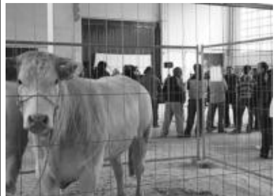
Ferialekuan, Udaberriko biga enkantea. A. ALTUNA

Independentziaren inguruko egun pasari amaiera emate aldera, gaueko 22:00etatik aurrera, DJ Independence-ren musika saioarekin festa giro ederra izan zuten gazteek Ibarako gaztetxean goizalderarte.