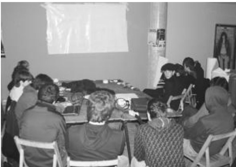
Sanblaspiko elkartearen, gazteak eztabaidan. A. ALTUNA

13:30ak aldera eman zioten amaiera aurtengo Udaberriko Bigen Enkanteari.