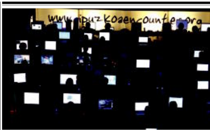
Gipuzkoa Encounter IV Tolosan burutuko da hilaren 19an, 20an eta 21ean. Europa iparraldetik datorren haizeak gogor astinduko ditu Usabal kiroldegiko ormak. Hala eta guztiz ere, antolatzaileek aterik ixteko asmorik ez dute.