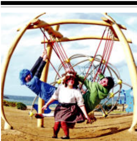
Anoetan eta Ibarran eskainiko dute bertsoxongiloek ikuskizuna. HITZA