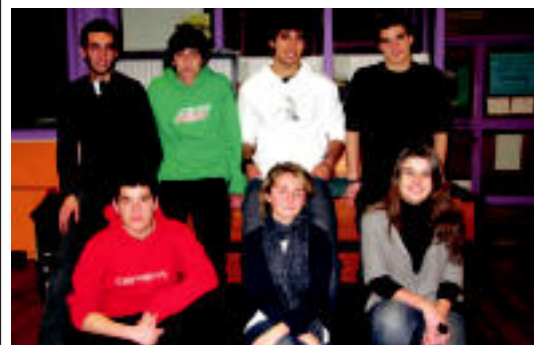
Hiru ikastetxeetako ordezkariek. ESTIEZEIZA

BERRIA TXAPELKETA Aurrera-Saiazek eta Zazpi Itturrik elkarren aurka jokatuko dute bihar 6