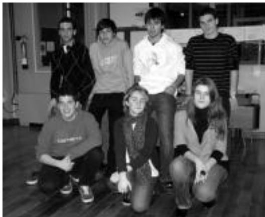
Etziko jaia antolatzen aritu diren ikasleetako batzuk. E. ZEIZA

Udaleko Gazteria sailaren eskutik iritsi zitzaizen Tolosako Batxilergoko bigarren mailako ikasleei festa berezi bat egiteko proposamena. Gazteek ideia ona zela iruditu aurrera jarraitu zuten, eta antolatzeari ekin zioten. Udalak «ikasleen bidaia ekonomikoagoa izateko helburuz» azpiegiturak, materiala, baliabideak eta antolaketaekin laguntzeko ardura hartu du, eta hori guztia aintzat hartuta,