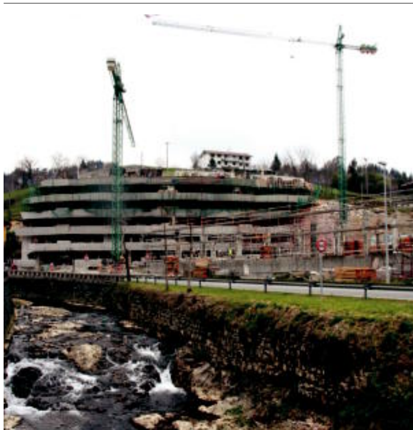
Lehen zerrategia zegoen lekuan, Zizurkilen, etxebizitzak eraikitzen ari dira.