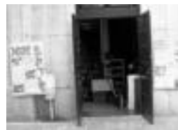
Kendu dituzten bi kartelak. HITZA

GIZARTEA » Amarotz Auzo Elkarteak adierazi dutenez, herenegun gauean Merkatu Txikia itxtean kartelak kanpoan utzi zituzten ahazturik, eta hurrengo egunerako desagertu egin ziren. Bada, kartelak eraman dituenak Kultur Etxera buelta ditzan eskatu dute, «euruntzat esanahi berezia baitute».