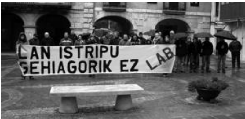
Alegiako plazan elkarretaratzea egin zuten atzo, lan istripuz hildako azken langilearen heriotza salatzeko. IMANOL GARCIA