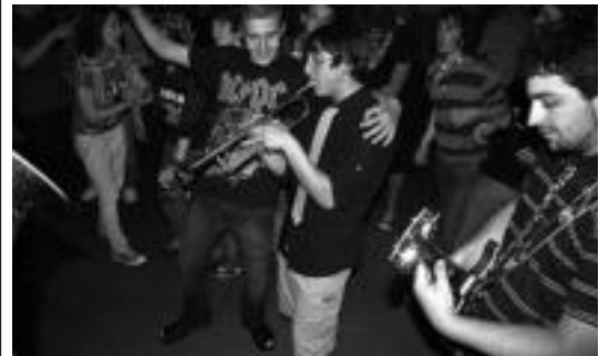
Ska doinuak ekarriko ditu bihar Tolosara, Luz de Putas taldeak. HITZA

Nire gustukoak diren ipuinak dira, saioetan kontatzen direnak. Ñorñoak ez dira izaten behintzat, ez baitaizkit gustatzen. Bizitzako gauzak agertzea gustuko dut, hau da, edozein haurrei gerta dakiokena. Autolaguntza gidaliburuak ez zaizkit gustatzen. Horregatik, tradiziozko ipuinak irakurtzen ditut askotan, gauzak alda baititzaket hauetan.