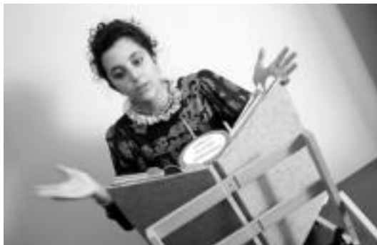
Tailerra amaitzen antzezlanaren egingo dute guztiek elkarrekin. HITZA

Haurrei zuzenduriko tailerra sei urtetik gorakoentzat izango da. Antzerki txiki bat egingo dute, eta pertsonaiak eraikiko dituzte nahi duten hori kontatzeko eta mani-