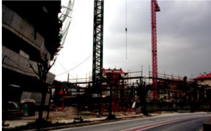
Asteasurako bidearen ondoan ari dira etxebizitza libreak eta babesekoak eraikitzen. E. MAIZ

Etxebizitza batzuk babes ofizialekoak eta besteak, libreak izango dira. Babeseko etxebizitzaren kasuan, «zozketa guztiak eginda daude baina krisi garai honetan, jende askok maileguak lortzeko zailtasunak izan ditu eta atzera egin behar izan dute. Hala ere, ze-