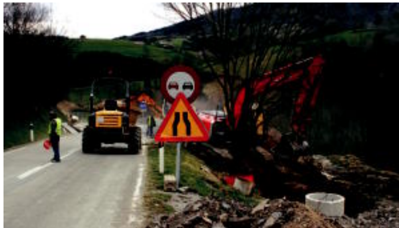
Saneamendu lanak burutzen ari dira egunotan Abaltzisketatik Amezketara doan bidean. I. GARCIA

Abaltzisketa » Udalerrian gauzatu diren eta gauzatuko diren proiektuen berri eman die Udalak herritarrei.