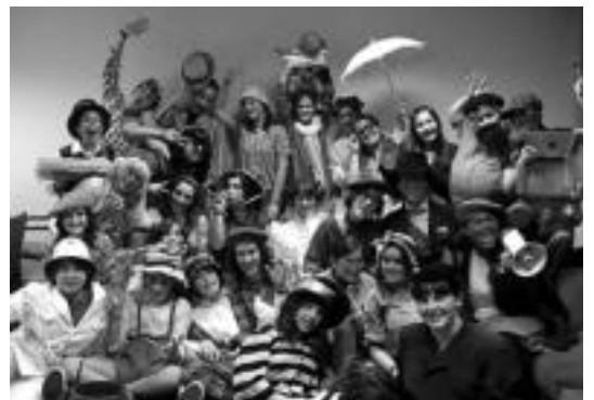
Hodei Truk abesbatzako kideek aurrera jarraitzen dute ETBko saioan.

Honez gain, Udal ordezkariak, 2010ean egin beharreko ekintzen inguruan herritarren parte-hartzea ezinbestekoa dela ikusten dute, lehentasunak ezarri eta berastegiaren behar eta nahietara ahal den neurrian erantzuteko behintzat.