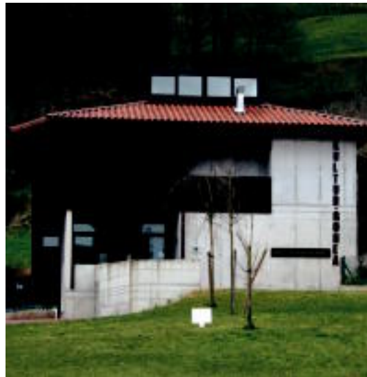
Antton Amonarritz kultur etxean kokatzen da, Larraulgo Eskola Txikia.