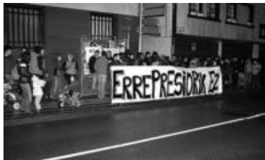
Atxilotetak salatzen elkarretaratzea egin zuten plazan, atzo. A. IMAZ