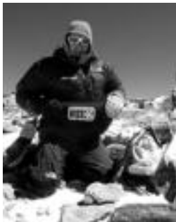
'Boli' Aconcaguako gailurrean. HITZA

Gaztelu » 20:30etik aurrera ongietorria, afaria eta Aconcaguako diapositiba emanaldia izango dira.