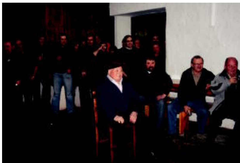
Sarasola Sagardotegian herenegun egin zuten sari banaketa ekitaldia. HITZA