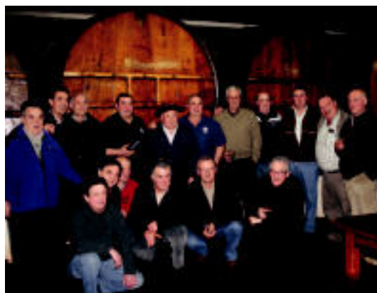
57 eta 76 urte arteko gizek osatzen dute Kupela Sagardozaile Taldea.

TOLOSA Astelehenean izango da Emakumearen Nazioarteko Eguna eta eskualdean ere eguna ospatzeko ekitaldi ugari antolatu dituzte 2-3