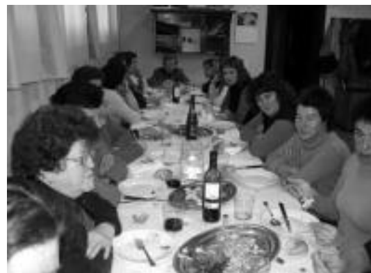
Herri askotan afariak egingo dituzte martxoaren 8a ospatzeko. HITZA

Egun guztian zehar eskualdeko aldarriak bilduko dituen murala pintatzen egongo dira plazan. Arratsaldean herriko haur eta gazte- txoek murala margotzeko aukera izango dute. 20:30ean ailegatu da Mundu Martxa Leitzara, eta harrera ekitaldia egingo da. Herriko plazan dantzariak, Jeiki Abesbatza eta bertsolariak izango dira. Honez gain, testigantza liburua osatuko dute herriko emakumeen aldarrikapen ezberdinekin. Ondoren, Atekbeltzan afaria egingo dute. Sarrerak Torrean eta Gaztañagan egongo dira salgai 10 euroren truke hileren 10a bitartean. Gaur, kontzertuak egingo dira: Komo tu eta talde sorpresa.