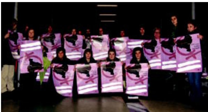
Ekitaldi ugari izango dira datozen egunetan Emakumeen Mundu Martxaren harira. E. EZBIZA