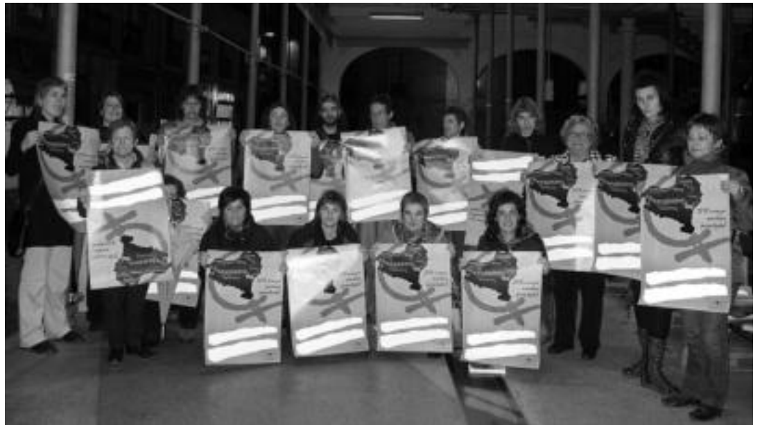
Atzo arratsaldean Tolosako Zerkausian aurkeztu zituzten Emakumeen Mundu Martxarekin lotuta eskualden antolatu dituzten ekimenak. E. EZEIZA

Emakumeen Mundu Martxa hemendik egun gutxira helduko da eskualdera. 2000. urtean, «milaka arrazoi zituztelako» elkartu ziren estreinakoz eta hortik bost urterekin berriro. Aurtun, hasiera horretatik hamarkada bat igaro denean, Euskal Herriko Mugimendu Feminis-