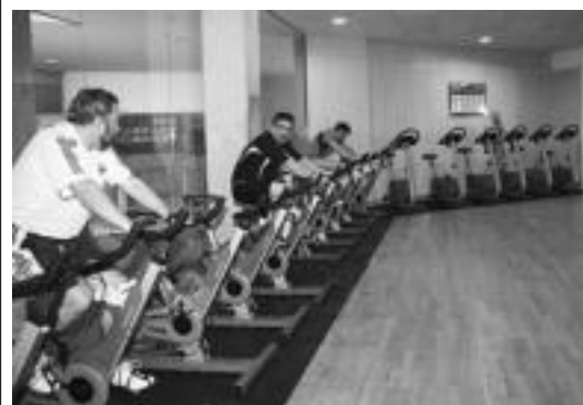
Entrenamenduaren arabera ariketa ezberdinak egingo dituzte. E. EZEIZA

Aipatutako proiektua aurrera eramateko gutxienez 9.000 euro bildu nahi dituzte Amarotz Auzo Elkartekoek. Horregatik, berriro tolosarren elkartasunari dei egiten diete.