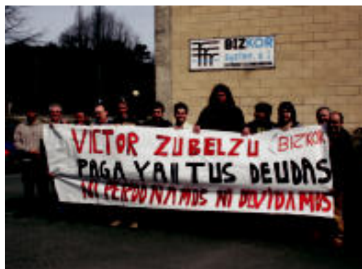
Enpresaren atarian elkarretaraztea burutu zuten atzokoan. E. MAIZ

Bizkor System-etik kaleratutako 23 langileek zor dieten dirua eskatu dute