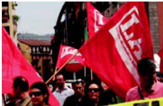
LAB sindikatua langileen aldeko borrokan. E. EZEIZA

Horiek horrela, LABek «langile klase guztiaren mobilizazio bateratuan oinarritutako borroka emateko unea dela» uste du. «Patronalaren ofentsiba gelditzeko eta go-