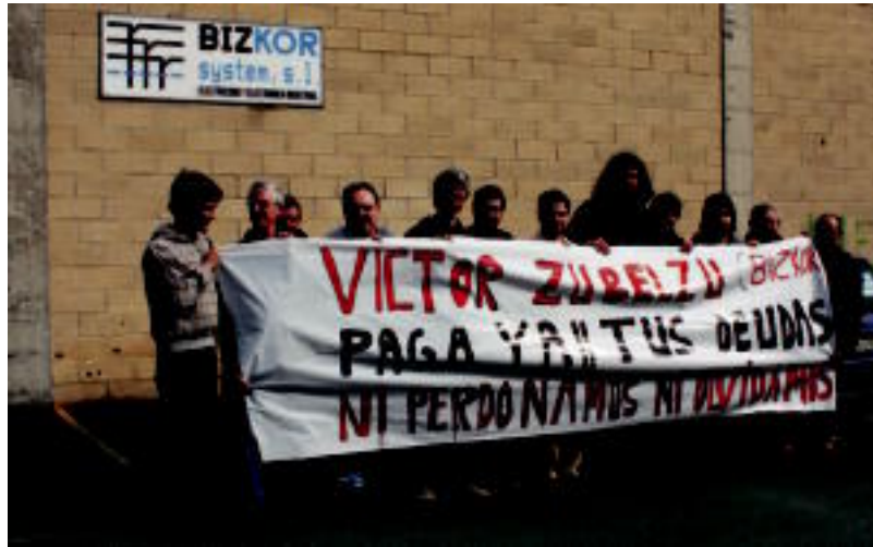
Bizkor System enpresaren aurrean kaleratuak izan diren langileetako batzuk. E. MAIZ

Aipatu bezala, urtarrilaren 26tik Anoetan dagoen Bizkor System enpresako 23 langileak kalean daude. Lanik gabe eta sei hilabeteko soldata, dietak eta kilometroak kobratu gabe geratu dira. Atzo, kale-