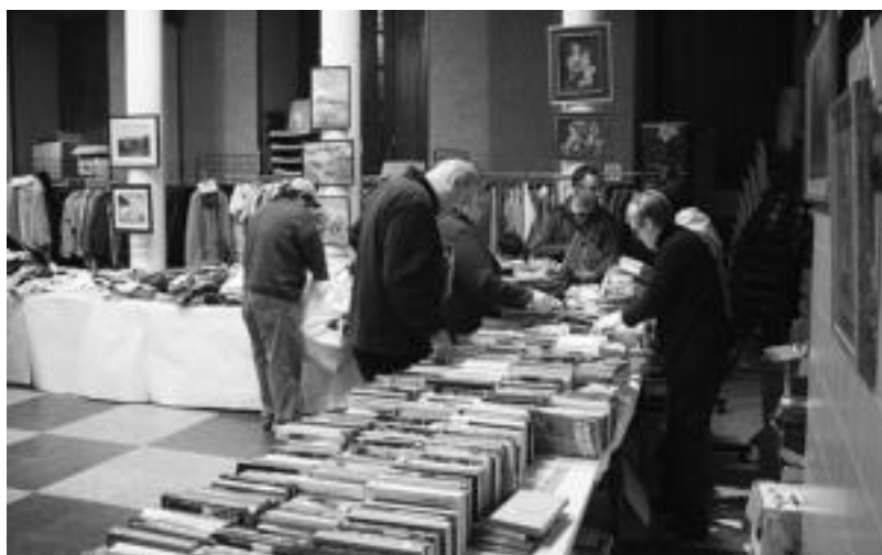
Nikaraguako Malpaisilloko zonaldera bideratuko da aurten ere, Merkatu Txikian bildutako dirua. I. TERRADILLOS

KULTURA ■ Eusko Legebiltzarreko Kultura eta Gazteria saileko kideak Tolosan izan ziren atzo, Topic bisitatzen. 11:00k aldera iritsi ziren eskualdeko hiriburura, eta udaletxean, harrera egin zieten udal ordezkariak. Ondoren, Alde Zaharra bisitatu zuten eta erosketak batzuk egiteko aprobetxatu zuten. Hiriko gune esanguratsuenetako batzuk ikusi ondoren, Txotxongiloen zentroa, bertako zuzendarien eskutik, ezagutzeko aukera izan zuten. Egunari bazkari eder batekin eman zioten amaiera. i.t.