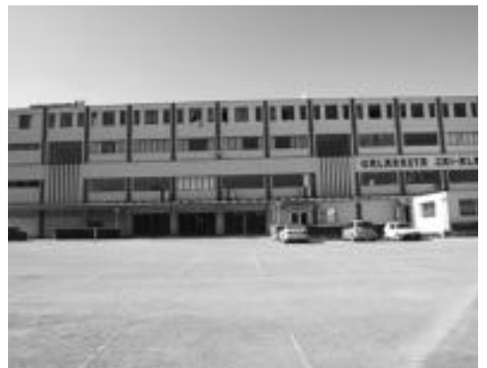
Hernaniko Galarreta pilotalekua martxoaren 31n itxiko dute.

Azkenik, ondorengo egunetan egingo diren mobilizazioetan parte hartzeko eskatu dute Amnistiaren Aldeko Mugimendutik.