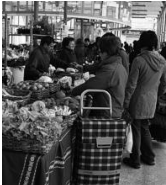
Ohi bezala azoka jendetsua izan zen atzokoa Tolosan. A. IMAZ

Bestelako produktuak, gazta eta ogiaren kasu, joan den asteokoetakoan mantendu ziren.