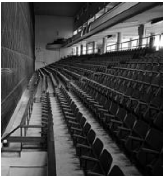
Galarretaren etorkizuna zalantzan aurkitzen da.

Erremontea ikuskizun polita eta gustagarria da eta irauun behar harko luke nere ustez!