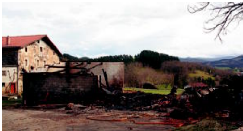
Asteasuko Gorua baserriaren ondoko biltegia guztiz erreta. E. MAIZ