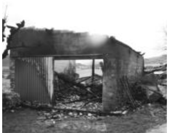
Baserriaren ondoko biltegia guztiz erre zen. E.M.A.Z

Biltegia, besteak beste, baserriko material ezberdinak gordetzeko erabiltzen zuten. Baita, sutarako egurra, belarra eta jabeen bi autoak gordetzeko ere.