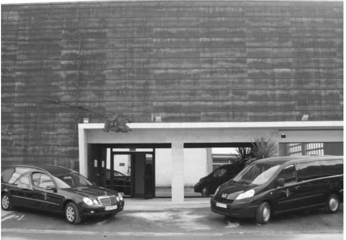
Oriako Ehorzketak eraikinaren sarrera. A. ALTUNA