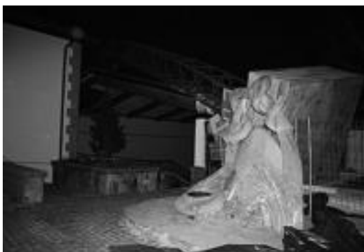
Plazan zegoen garabiak frontoiko teilatua bukatu zuen. A.I.M.A.Z

eta oraingoan, Tolosako dultzainarien laguntza izan zuten. Jende asko elkartu zen atzokoan eta guztiak kantuan aritu ziren kaleetan geldialdiak eginez. E.M.A.Z