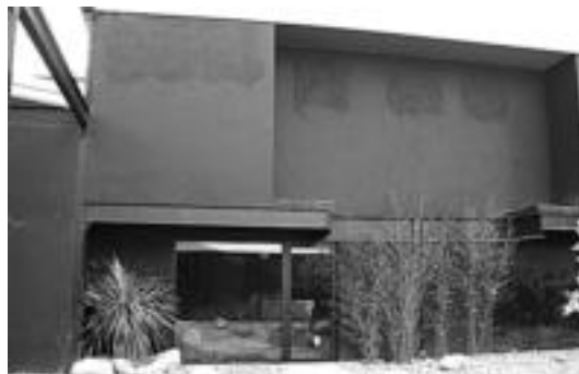
Beilategia jarriko duten eraikina. A. ALTUNA

Beilategia egiteko labe berezi eta berritzaileen erabiliko dituzte, «ahalik eta zerbitzu onena eskaintzeko eta ingurugiroari ahalik eta kalte gutxien eragiteko».