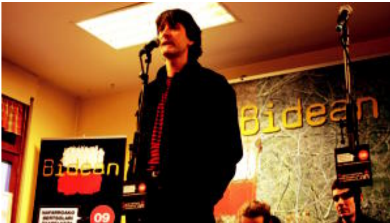
Nafarroako Bertsolari Txapelketan hiru leitzar hasi ziren, egun 'Luze' bakarrik gelditzen da. HITZA