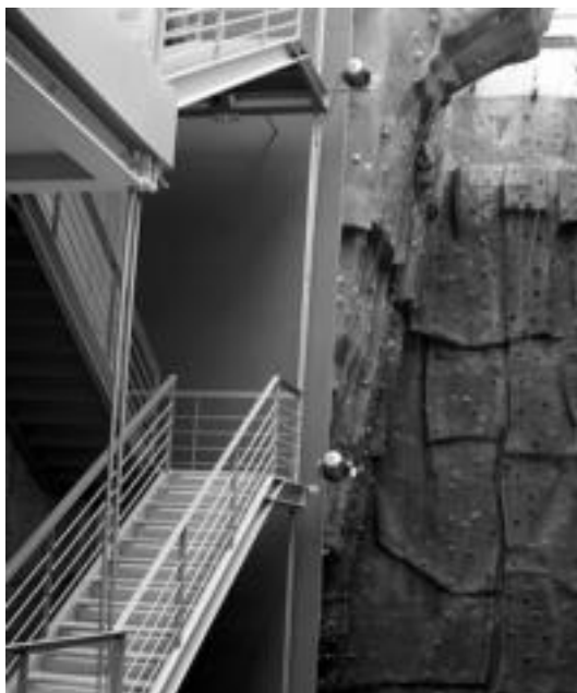
Berrikuntzen artean, rokodromoan ibilbideak aldatu dituzte. E. EZEIZA

Inauterietan jendea parrandan eta jai giroan murgilduta egon den bitartean, Usabal kiroldegian hainbat aldaketa eta berrikuntza egiteko aprobetxatu dute. Astebetez itxita egon da kiroldegia eta, egun