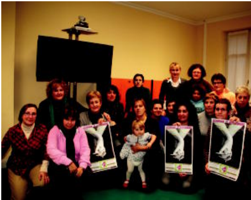
Hutsunea Betez elkarteak kideetako batzuk, kasu honetan, azaroak 25eko eguna antolatu zuten. E. MAIZ