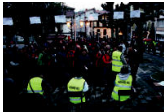
Iaz, ibilaldia hasteko irteera eman zain parte hartzaileak. AIZKARDI

Informazio gehiago nahi izanez gero, 943 69 44 58 Gazte Bulegoko telefonora deituz eskuratu daitezke.