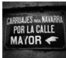
Kendu duten kartela. HITZA

Duela hilabete batzuk Tolosako Gorriti plazan zegoen kartel bat kendu egin zuten, eta horrek eztabaida sortu du herritarren eta be-