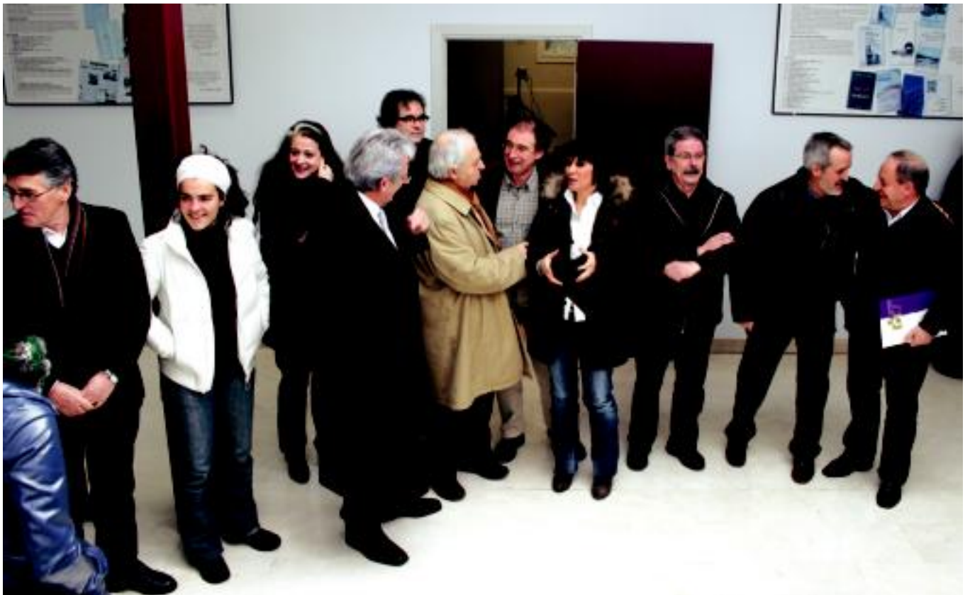
Duela zazpi urte itxi zuten 'Euskaldunon Egunkaria'; Andoaingo Martin Ugalde Kultur parkean atzo ekitaldia burutu zuten. GARI BERASALUZE

TOLOSA Egunkariaren sostengu taldeak kazetaren aldeko eguna antolatu du gaur 18:00etan Plaza Berrian 7