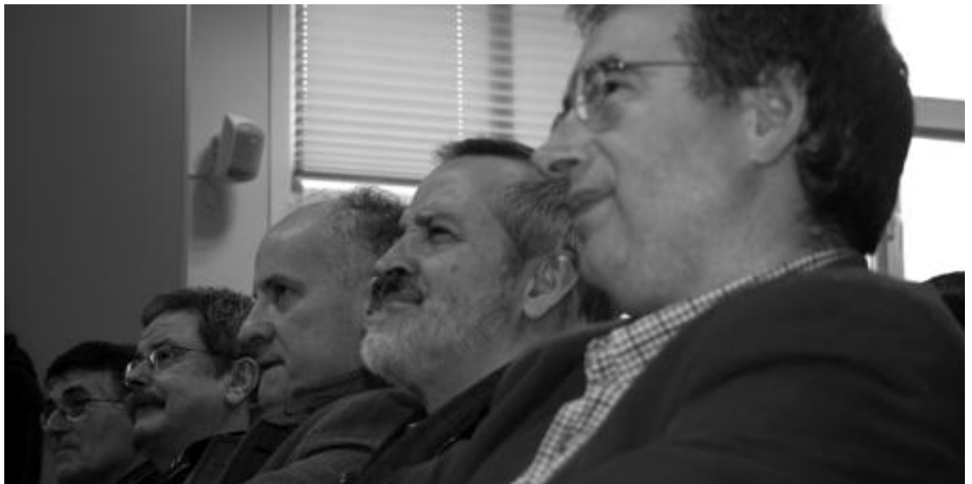
'Egunkaria auziko' bost auzipetuak atzo Andoaingo Martin Ugalde Kultur parkean. Itxieraren zazpigarren urteurreneko ekitaldian babes zabala jaso zuten.