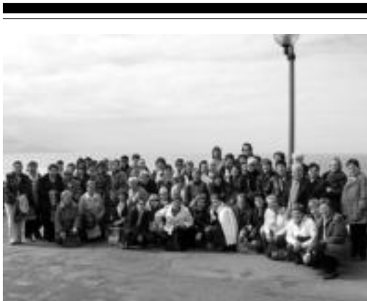
Lapurdira irteera egin zuten Zizurkilgo emakumeak. HITZA