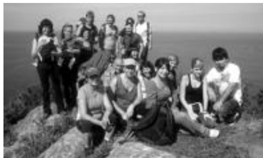
Ibartarren bigarren irteeran kilometroetara joan ziren mendiz. HITZA

Oraingoan Urdazubi, Zugarramurdi eta Sarako kobak ikusiko dituzte. Beti bezala, adin guztietako jendea elkartuko da, eta «giro ezin hobez gozatu ahal izango dute» antolatzaileen esanetan. «Inorkanpoan gera ez dadin», bi ibilaldi prestatuko dituzte, bata luze eta-