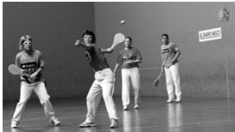
Frontoi Motzeko Emakumeen Gomazko Paletako Txapelketa finalerdien atarian aurkitzen da.