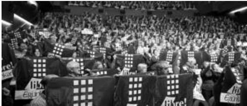
Pasa den urteko azaroan egin zuten Egunkaria -ren aldeko jaialdia Donostiako Kursaalari.

Bihar, 18:00etan hasiko da ekimena Plaza Berrian. Hiru ordu in-