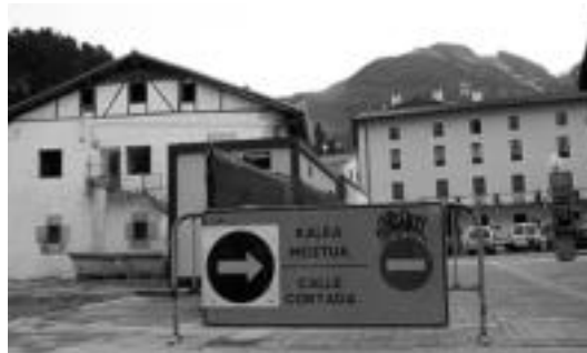
Obretako kartelak ere euskaraz egon behar dute. I. GARCIA

ko ikastaroak, adibidez, euskaraz izan beharko dute».