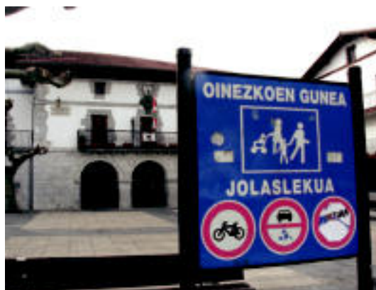
Herriko plazan dagoena bezala, errotuluak euskaraz egon behar dute. I. GARCIA

ZIZURKIL Udalak emakumeei zuzenduriko autodefentsa ikastaroa antolatu du martxoaren 20ean; izena emateko epea zabalik dago 4