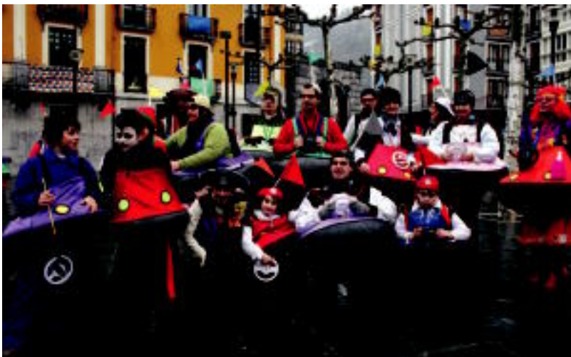
Auto-txoekak barratik aldegin zuten festaz gozatzera. I. TERRADILLOS