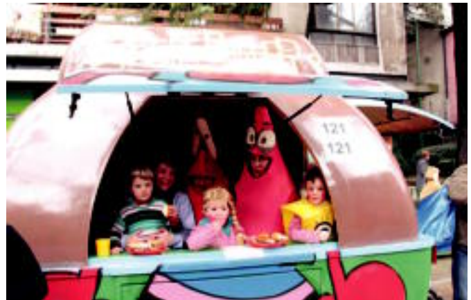
Bob esponja eta bere lagunek jatetxea jarri zuten San Frantziskon.