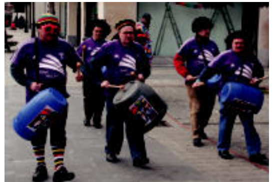
Musika egiteko edozer erabiltzea zilegi da Inauterietan. I. GARCIA