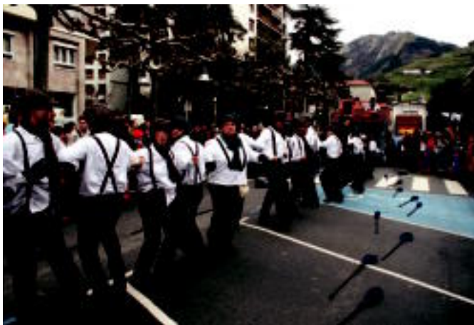
Karrozekin ateratzen direnek beraien dantza-ikusizunak egin ohi dituzte. ASIER IMAZ

eguna atzokoa izan zen. Beraz atzo zer? Eguraldi hobea; karrozak goizean goiz kalean jaiak sortuz; jendea gustura hauei begira; esamesak han eta hemen; txarangak ohi bezala bihotza saltoka jarritz; xexenak zezen-plazan; parrandaren jarrapena kalean; sardina; txosnak eta tabernak... eta gaur, hurrengo urteko Inauterien zain.