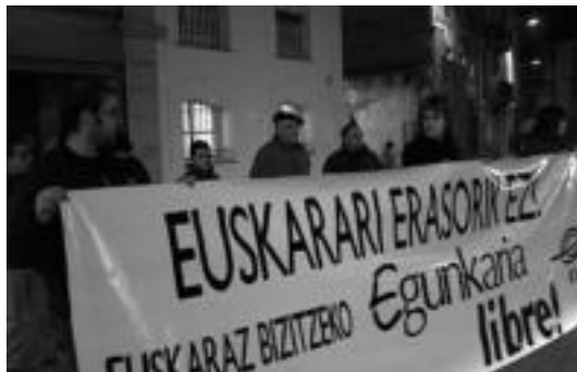
Euskal Herrian Euskarazek Villabonan egindako elkarretaratzea.