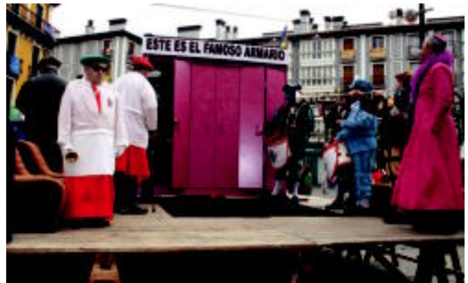
Armairutik zein aterako begira aritu zen jendea. A. IMAZ

Amaitu dira aurtengoak ere. Gaurko egunean Tolosa ia hutsik egoten da eta taberna zein denda gehienak itxita. Festaren ajea nagusitzen da eta pasatako jai egunen errebasoa egin eta gero, hurrengo urteko Inauterien zain geratzen da Tolosa.