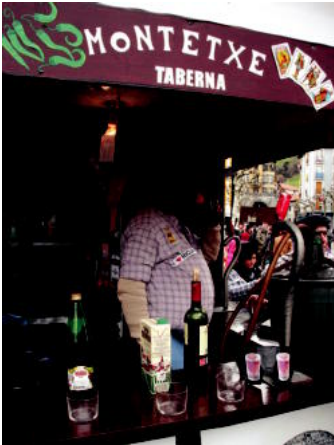
Txikitozaleek Montetxe taberna jarri zuten martxan ardoa sustatzeko. I. GARCIA