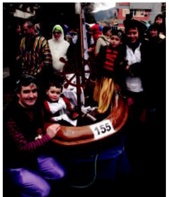
Pirata izatea odolean eramaten da zenbait familian. I. GARCIA

@ Argazkiak. HITZak aurtengo Inauterietan ateratzen dituzuen argazkiak jaso nahi ditu. Bidaltzen dituzuen argazki guztiekin bilduma osatuko dugu eta webgurean izango dituzue ikusgai. Bidali argazkiak tolosaldeko-hitza.info helbide elektronikora: www.tolosaldeko-hitza.info