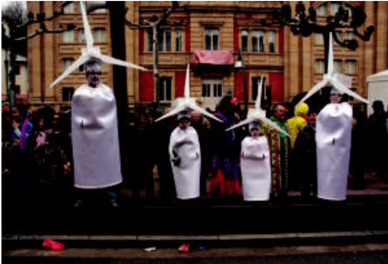
Atzo egindako eguraldi haizetsua ondo baliatu zuten haize-errotek.