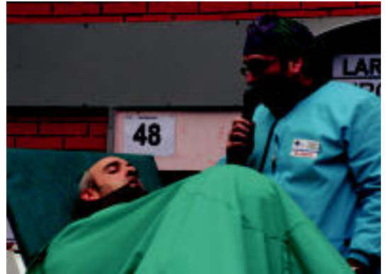
Antzezenik ez zen falta atzokoan ere. I. GARCIA