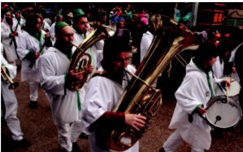
Txarangek, beti bezala, kaleak alaitsu zituzten. I. GARCIA