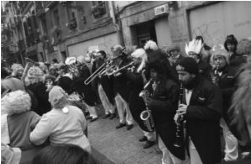
libildetan zehar geldialdiak egiten zituzten, baina Musika Bandakoek jotzen jarraitzen zuten. E. EZEIZA