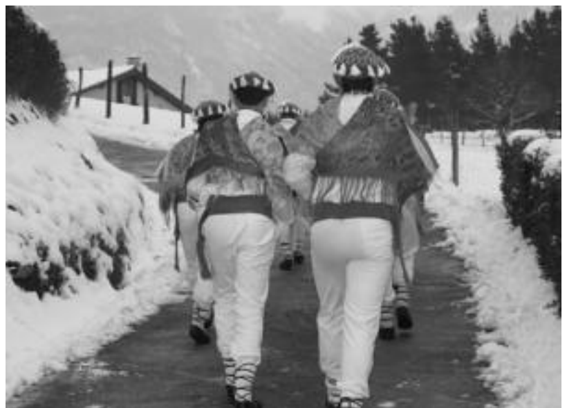
Poltseroak atariak garbitu zituen txantxoek dantza zezaten; irristakor zegoen lurra atzokoan.

Tolosaldeko eta Leitzaldeko HITZAn jarri eta Gipuzkoako beste 4 Hitzetan DOAN agertuko da