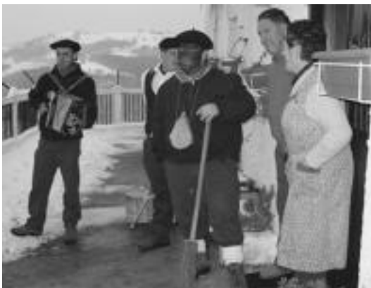
Abaltzisketako baserrietan gustura hartu zituzten txantxoak. N. LATABURU