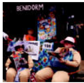
Benidormeko hondartza irudikatu zuten batzuk. L. MAIZ