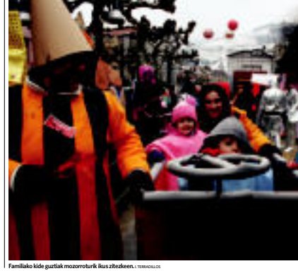
Familako kide guztiak mozorroturik ikus zitezkeen. L. TERRACOLLOS