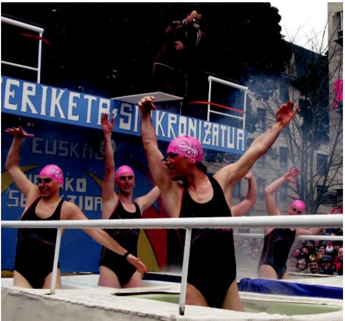
Elurra, hotza, izotza... bezalako hitzak nagusitzen ari dira Inauteri hauetan. Hala eta guztiz ere, ibartar eta tolosar hauek bainujantzian irten ziren kalera atzokoan.

ASTELENITA Konpartsen lekua aisialdi taldeetako haur eta gaztetxoek hartuko dute gaur 11:00etatik aurrera 4-5