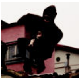
King Kong gorila Fronton jatekoaren kanpoaldean jarri zela. L. LATAURU