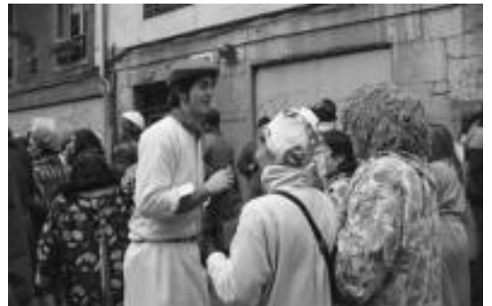
Alde Zaharreko kaleak saltoka igarotzeko, zatoa ere atera zuten batzuek. E. E.