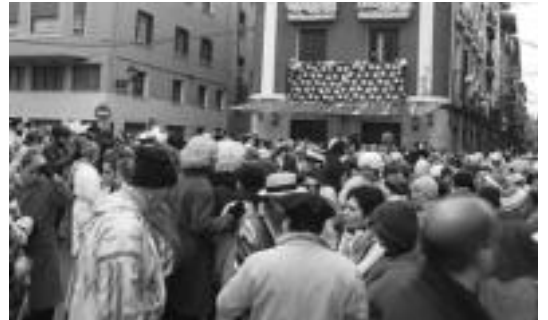
Ehunka lagun jaiki ziren atzo goizean, Dianarekin dantza egiteko. E. EZEIZA