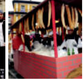
Modu berezian aritu ziren hauek ogia egiten. L. TERRACOLLOS