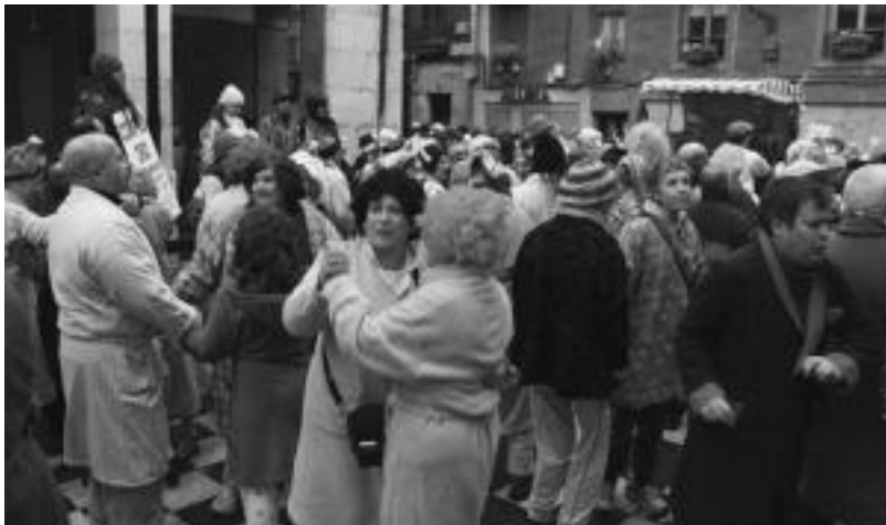
Elurra egiten zuenez, Berdura Plazara iristean asko aterpera sartu ziren, bertan lasai dantza egiteko.