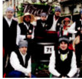
Ardatzile hauek ere ez zuten Zaldunita Eguna galduta nahi izan. L. TERRACOLLOS