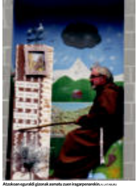
Atzokoan eguraldi gizonak asmatu zuen ingarpenarekin. L. LATAURU