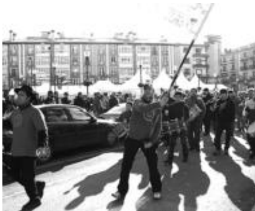
Txaranga badatorrela iragarri banderola astintzen du Golbanok.

Gozatzeko eta ongi pasatzeko bost egun. Dena den, nire kontu egiten dut lana eta hau jaiarekin uztartu beharra izaten dut. Inauterietatik zer nabarmenduko zenuke?