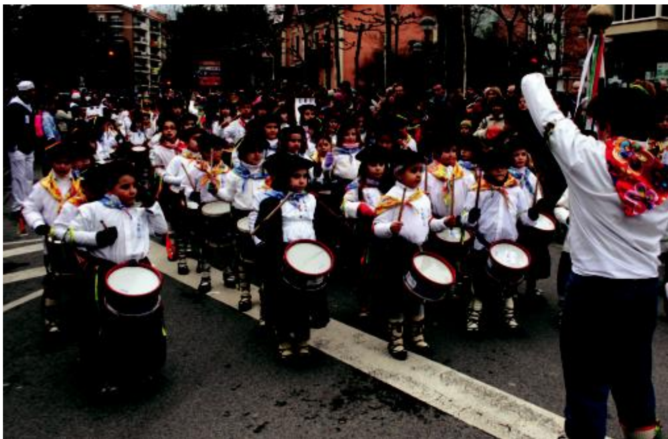
Ehunka ume elkartu ziren atzo danborrak astintzeko; Geltoki kaletik irten ziren eta San Frantzisko pasealekutik barrena Triangulora joan ziren. I. TERRADILLOS

HELDUAK lazko jendearen erantzuna ikusita aurten ere 19:00etan egin zuten helduek euren kalejira 4-5