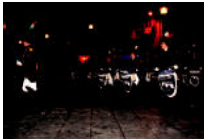
Helduen Danborradaren hasiera ikustean jende ugari izan zen Triangulo plazan...