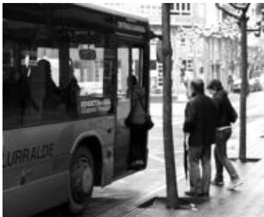
Autoa ordezkatzeko aukeretakoa bat autobusa da.