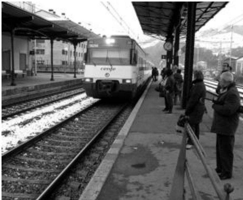
Festazale askok erabiltzen du trenea Tolosako Inauterietara joateko. I. GARCIA

Autobusean gero eta gehiago Inauterietan zerbitzua luzatu egiten du Tolosaldea Bus enpresak ere. Ohiko zerbitzua bederatzia arte bada, jai hauetan hamarrak