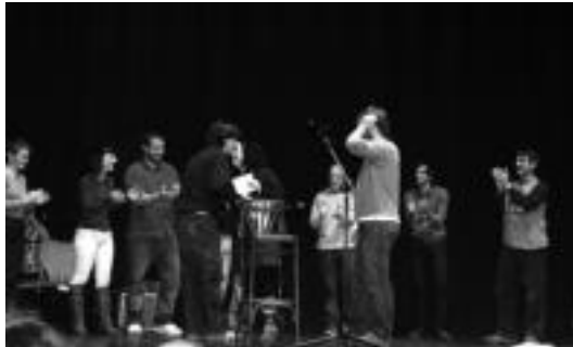
Parte hartzaile guztiak taula gainean, sariak jasotzen.

Villabona » Gurea guztiz bete zen zazpi parte hartzaileen lanak ikusteko; bigarren edizio bat egingo dutela aurreratu dute.