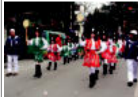
Danborren dainura dantzan aritu ziren...