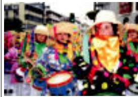
Tolosako hiruko kaleetako ehunka gaitzek hartu zuten parte...