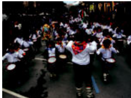
San Frantzisko kale oso hartu zuten Haur Danborradak. Kale alboetan jendetza hurbildu zen ikustera...