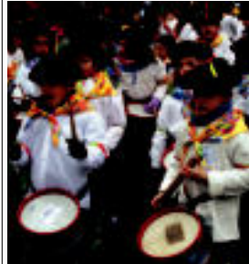
Danborradariekin aurreko gogotsu ziren gaitzetako...