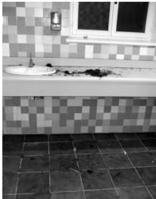
Gisa honetan topatu zuten komuna.

«Zilegi al da, zenbaitek bizikidetzarako oinarriko arauak hausten jarraitzen duten bitartean, gainerako herritarrek zerbitzu hori gabe utzi behar izatea?», galdetu dute Udal arduradunek. Villabonako Udalak gogoetarako deia egiten die, eraso hauetan parte hartzen dutenei eta villabonatarrei orokorrean. Erasoaren arduradunak nor diren ez jakitun izanik ere, haiek egindako kaltearen ordaintzaile izatea izango da justuen.