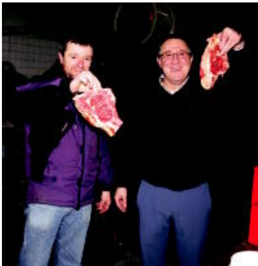
Lanean hasi aurretik dena prest eduki behar da, txuletak barne. A. IMAZ

Inauterien azken egunetan txosna 18:00etan irekiko dute. Jai bertatik agurtzeko aukera egongo da.