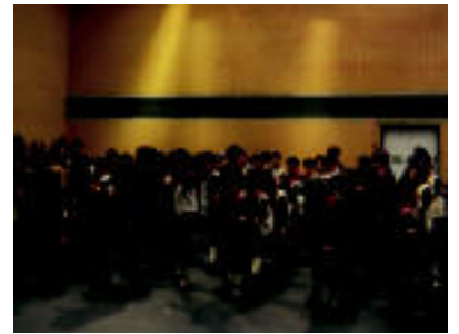
Fleming eta Jesusen Bihotzakoez Villabonako kiroldegian eskaini zuten emanaldia, herenegun. HITZA