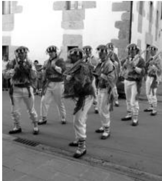
Amezketan mahoizko galtzekin eta alkandora txuriekin ateratzen dira eta Abaltzisketan berriz, ezkon-mantoi koloretsua eramaten dute soinean. N. URBIU