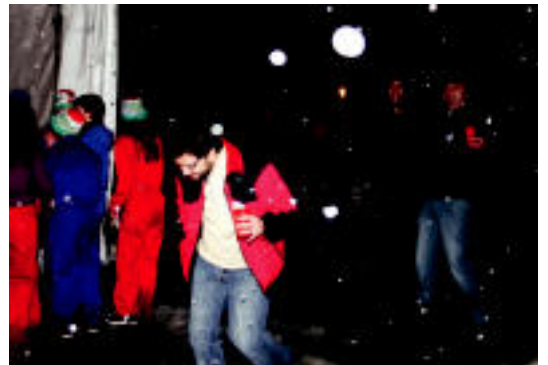
Txiletik etorritakorik ere bazen txosnetan Ostegun Gizenean. A. IMAZ

Tabernaz gain, Tolosako Txozna Batzordeak Inauterietarako bere egitarau propioa osatu du.