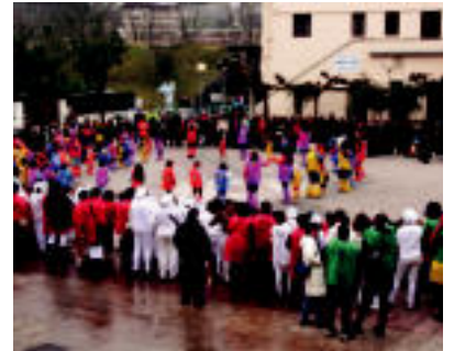
Zizurkilgo eskola guztiak plazan elkartu ziren.