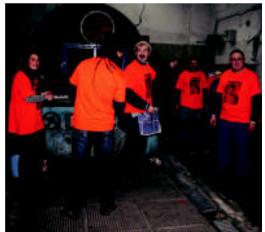
Abastosen hainbat boluntario dabilta lanean, Elkartasun Sagardotegian. A. I.