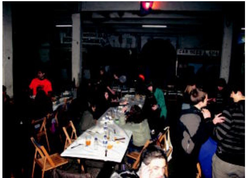
Ikasleen afariak tarteko, Ostegun Gizenean ehun lagunetik gora elkartu ziren Elkartasun Sagardotegian. A. IMAZ

Sagardoa Isastegietakoa da eta hiru kupeletan egoten da, bakoitzak inguruko mendiaren izena darama gainera, kokapenaren arabera. Ardozaleek ere bere kupel-txoa aurkituko dute Abastosen, «ardo ona gainera».