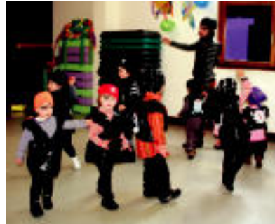
Adunan txikiak pirataz jantzita dantzatu zuten. E. MAIZ