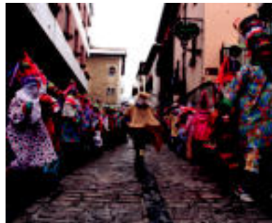
Asteasun desfilea eta dantza egin zuten. E. MAIZ

Villabonako Udalak antolatutako konpartsa desfilea ospatu zen eta Jesusen Bihotza eta Dr. Fleming-ek hartu zuten parte. Eguraldi elurtsuarengatik emanaldia Olaederra kiroldegian egin zuten.