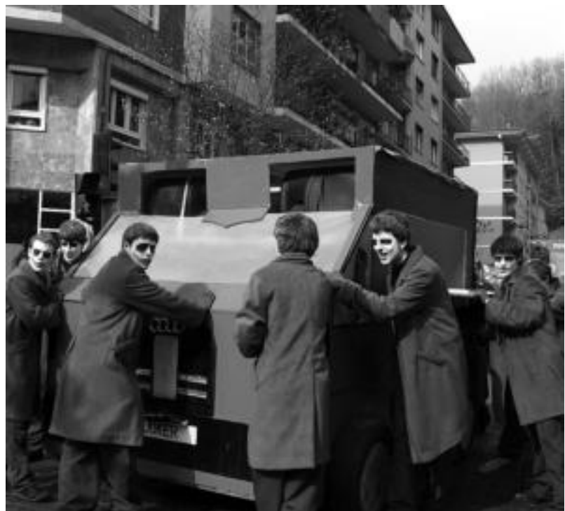
Karroza, konpartsa eta aisialdi taldeak urtero bezala kalean ibiliko dira. ESTIEZEIZA

ko Inauterietan: Txiribitu, Tenteek, Kazkabarra, Atsedena, Kiri-kiño eta San Bernardo.