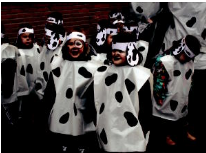
Asteasuko eta Amezketako haurrak ere mozorrotu ziren Ostiral Mehean. E. MAIZ-N. LATABURU

ELKARTASUNA Tolosaren erdian, Abastosen, ohi bezala Sagardotegia zabaldu dute Inauterietan 5