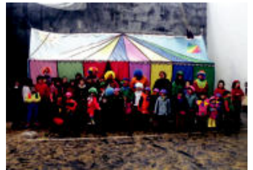
Abartzaketara zirkoa heldu zen herenegun. HITZA

Atxik jolas-joko-kirolari!, atxik herriari!