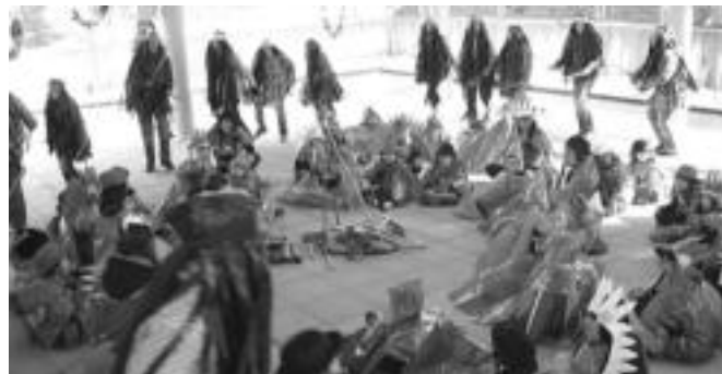
Berrobiko ikasle eta irakasleak indioz jantzi ziren eta suaren bueltan dantzatu ziren. HITZA