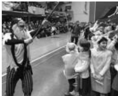
Tolosako Laskorain, Samanigo eta Hirukideko eskolako ikasleak eta baita Albizurrekoak ere.