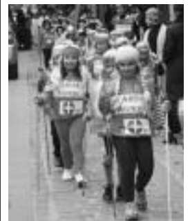
Pasa den urtean ere mozorrotu ziren Asteasun. I. TERRADILLOS