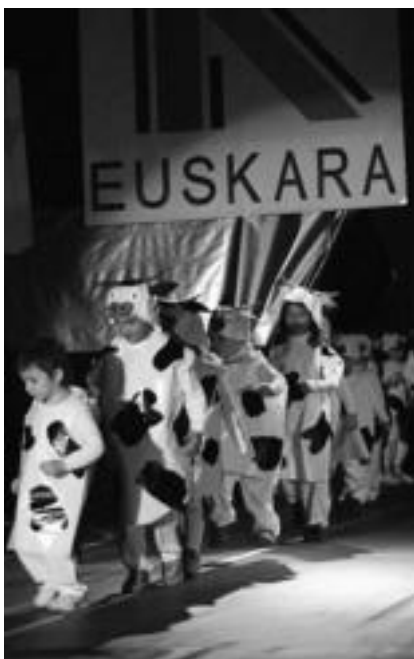
Anoetako ikasleak herenegun egin zuten emanaldia. HITZA