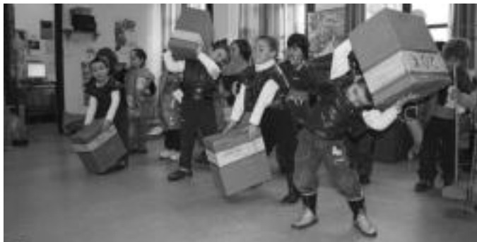
Alkizako txikiak lanbide ezberdinez jantzi ziren eta beraien ikuskizuna eskaini zuten.