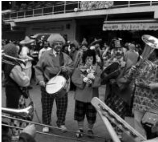
Txarangek ez dira faltako; gogotik egingo dute lan bihartzik aurrera. I. GARCIA

Tripa, Tolosano eta Arco Iris txarangekin, Plaza Zaharretik Zezen Plazara. ■ 16:30. Zezenak Zezen Plazan; txaranga ariko dira ikuskizuna alaitzen. Ondoren kalejira. ■ 19:00. Dantzaldia Berdura Plazan Tolosano, Poca Tripa, Tolosano eta Arco Iris txarangekin. ■ 21:30. Iturritxiki Plazatik zezen-suzkoa irtingo da. ■ 23:30. Plaza Berrian Lain eta Hesian taldeen kontzertua. ■ 23:30. Incansables eta Bonberenea txaranga kalez kale.