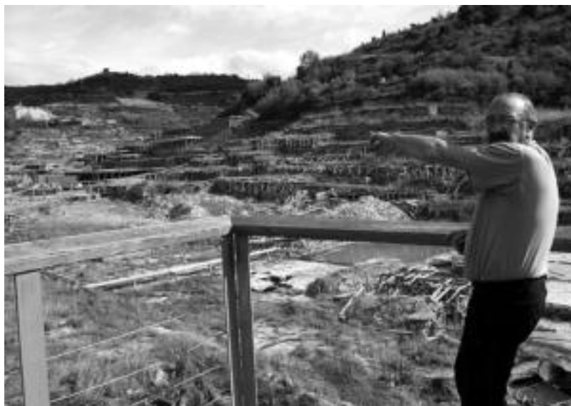
Lapurdiko irteera antolatu duen xerpetako bat. Irudian, Arabako irteeran argibideak ematen. A. IMAZ

LEITZA • Auto batek istripua izan zuen atzo 11:00ak inguruan Leitzako errepidean. NA-170ean gertatu zen istripua, gasolindegitik metro gutxira. Auto batek kontrola galdu zuen eta iraulita gelditu zen Leitzatik Areso noranzkoan. Gidaria mediku zerbitzuek eraman zuten. Zirkulazioa berriz, autoa kendu bitartean, Guardia Zibilak bideratu zuen. ASERIMAZ