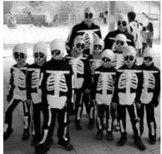
Berrobini iaz eskeleto mozorroa aukeratu zuten; aurten indioz aterako dira. A.I.