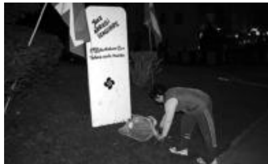
laz egin zuten lore eskaintzako unea. I. GARCIA

«Tortura ohikoa da gaur egun ere eta data hauetan gogoan izan nahi ditugu Euskal Herrian torturatuak izan diren herritarrak, eta bereziki torturak hil dituenak. 2010. urteko otsailaren 13an oraindik orain, torturaren errealitatearekin aurrez aurre aurkitzen gara, atxilotuen inkomunikazioak horretarako zigorgabetasun guztia eskaintzen dielako torturatzailei», azpimarratzen du Amnistia-aren Aldeko Mugimenduak. Azken 40 urteotan, 7.000 euskal herritar