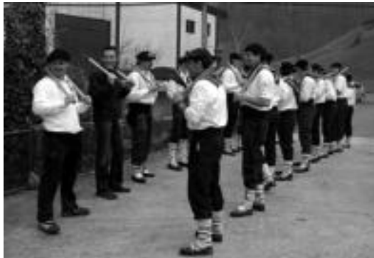
Talai dantzariak ere dantza egingo dute. HITZA