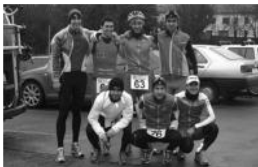
Reinosako proban parte hartu zuten Mahala triatloi taldeko kideak. HITZA