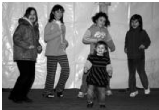
Atzo toka txapelketa jokatu zen eta herenegun berriz disko festa izan zen. E. E.