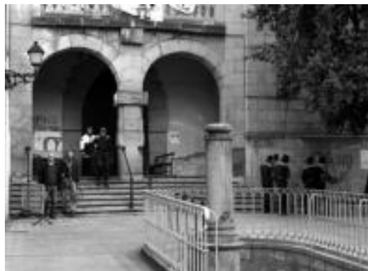
Ertzainak eta perituak Inpernu Gaztetxetik ateratzerakoan. R. CALVO

Barruan bi pertsona baino ez zeuden eta hauek TOLOSALDEKO ETA LEITZALDEKO HITZARI esan zientenez konturatu ere ez ziren egin barrura sartu zirela, nahiz eta atea bota zuten sartu ahal izateko.