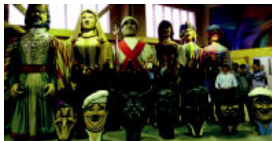
Konpartsak Bonberenean gordetzen ditu erraldoiak eta buruhandiak. HITZA

erraldoiak pozik eta ondo zainduta daude. Etxe berri honetan entseguetarako lokalak eta sormengunea bilduko dira, zalantza gabe, Tolosan orain dela askotxotik behar ziren instalazioak, hain zuzen, eta beste behin ere kolektibo honen gure kulturarekiko sentsibilitatea erakutsi du. Zorionak eta eskerrak asko», gaineratu dute konpartsa-aren ardura-dunek.