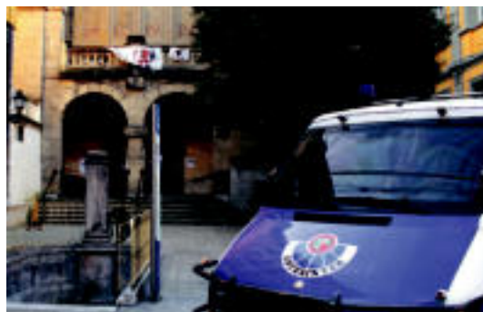
16:00etatik 16:45era izan zen Ertzaintza Inpernu Gaztetxean. R. CALVO

TOLOSA Mezara joandakoek, eskoletakoek... guztiek erosi dituzte erroskilla preziatuak 3