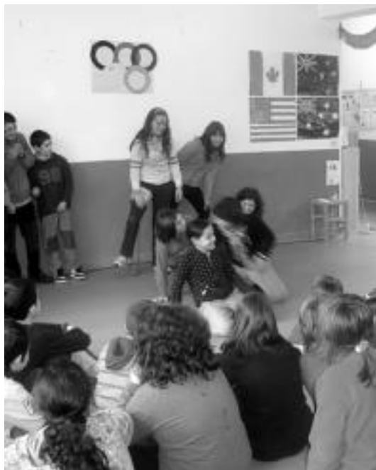
Barnetegian lagun berriak egiteko aukera edukitu dute, hori bai, ingelesez. HITZA

Hasiera hasieratik ingeleseko soilik entzun dute eta ezinbestean ingelesez komunikatu behar izan dira. Bide batez ikasleen arteko harremanak sendotzeko eta lagun berriak egiteko baliagarria izan da.