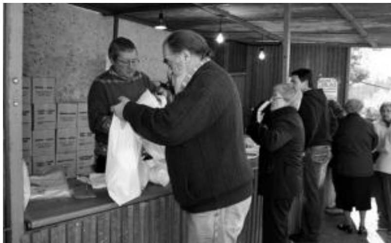
Jende ugari hurbildu zen atzo Tolosako auzora erroskillak erosteko asmoz. E. EZEIZA

Tokiko Inbertsioetarako Estatu Fondoarekin egin diren bost obreratik azkenena da hau.