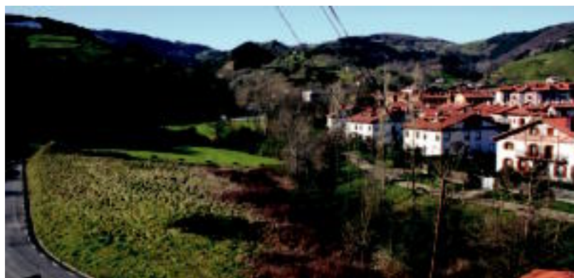
Artzubi inguruan, Larraulera doan bidearen ondoan, eraikiko dira igerileku irekiak.