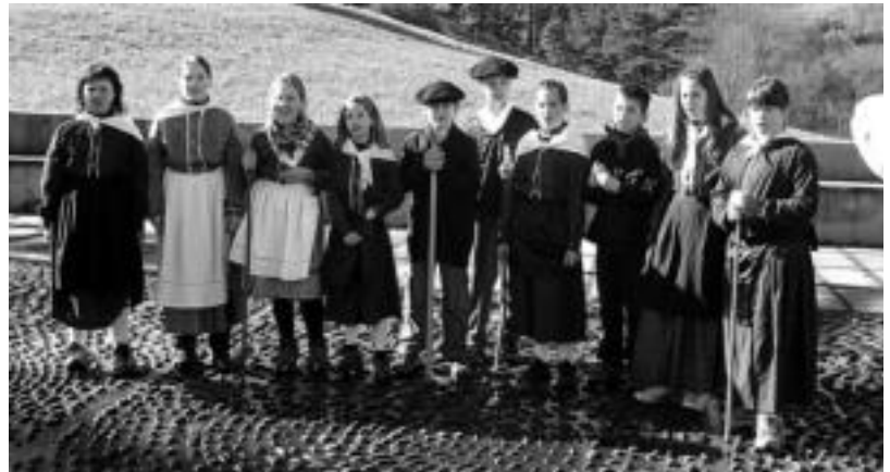
Zizurkilen, San Millan eskolan, Agate Deunaren koplak grabatu zituen 'Hitzetik Hortzera', HITZA