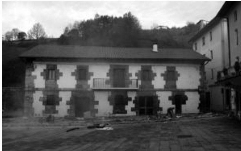
Aierbenea etxea Herri Zentroa bihurtzeko lanak aurki hasiko dira. I. GARCIA

Herri Zentroko obraren esleipenaren berri urtarillaren 28ko osoko bilkuran eman zen. Bertan hainbat erabaki hartu ziren ere,