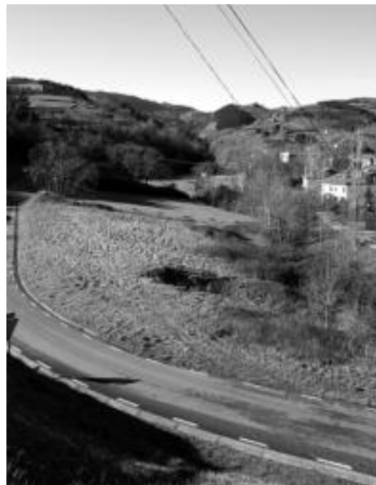
Igerilekuak, Larraulgo bidea eta Artubi errekararen artean egingo dituzte. E. MAIZ

bukatzea espero dute. Egoera txarrean aurkitzen zen eta herritarrek «estropazu» ere egiten zuten. Diputatziotik laguntza jaso du Udalak hau konpontzeko. E. MAIZ