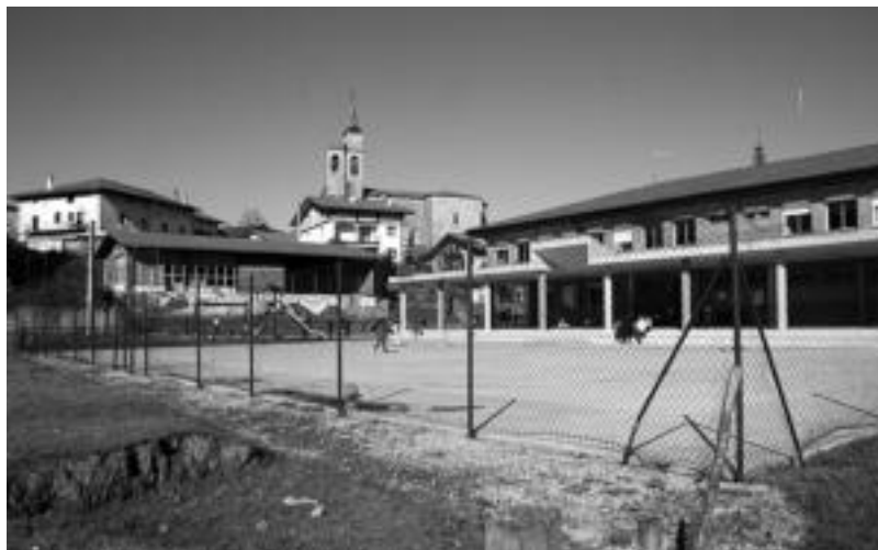
12 hilabeteetan eskola handitzeko obrak bukatuta egotea espero dute. E. MAIZ

berriak ere bi solairu izango ditu «haurreskola eta 6 urte bitarteko haurrentzako gelak egingo dira eta bakoitzak bere jolas lekua izango du. Atzeko aldean dagoen frontoira eta gimnasioa aretora joateko, igarobide bat egingo da eta eraikin guztiak lotuta geratuko dira. Era berean irisgarritasun baldintzeta-