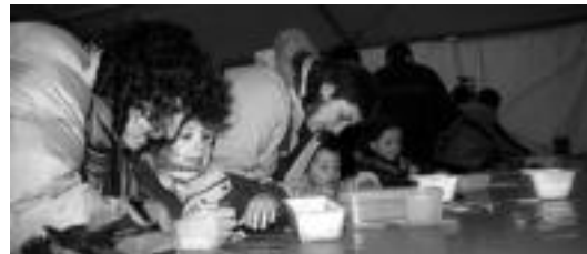
Iaz egin zuten lehen aldiz Sendi Ekintza Eguna Ibarroko plazan. I. TERRADILLOS

«Adin tarte guztiak lekua» izango dutela ziurtatu dute elkartetik eta herritar guztiak gonbidatu nahi dituzte, bide batez, festara. Krosean iaz parte-hartzea handia izan zela gogoratu dute eta aurten ere horrela izatea nahi dute elkarteko kideek.