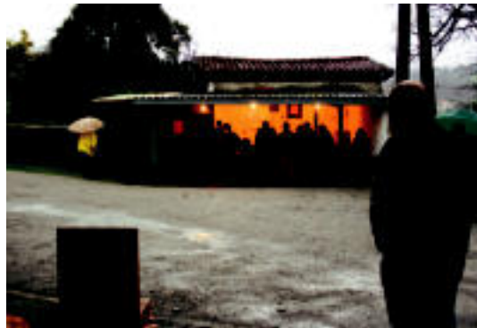
Egurdiak lagundu ez arren hainbat lagun aritu zen tokan. l.t.

Haima jarri zuten Triangulon eta saharar musika entzutearekin batera, bertako ohiko jakiak dastatzeko parada izan zen. Espero baino gutxiago ari dira jasozten, eta jendea animatu nahi dute parte hartzera. l.t.