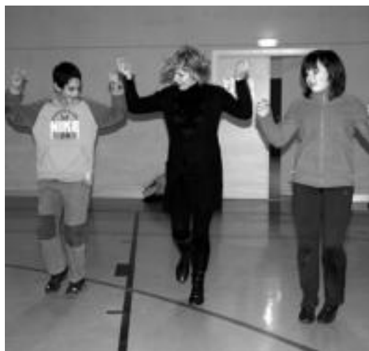
Dakitenek, ez dakitenei erakusten diete dantzan. E. MAIZ

Bukatzeko dantzariak eskerrak eman nahi izan dizkie Kuku Elkarteari, Gazte Asanbladari eta baita herriko talogileei ere. Festa Udaltzen eta kultura batzordearen bidez antolatzen dute.