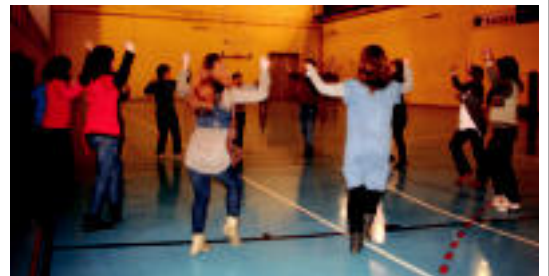
Gaske askok eman dute izena Soka-dantza egunean parte hartzeko. E. MAIZ

TOLOSA Gaur dantzariak, aizkolariak eta bertsolariak izango dira, besteren artean 5