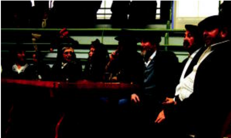
Istorio guztia arretaz jarraitu zuten agintariak. I. TERRADILLOS