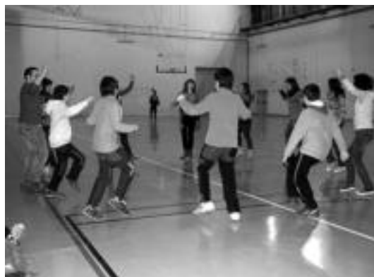
Izena eman dutenak entseguetan elkartzen dira. E. MAIZ

@ Zurea da Hitza. Sartu gure webgunean eta eguneko egunkaria eta azken orduko berri- ez gain, Zurea da Hitza atala aurkituko duzu. Bertan zure herriko, auzoko edota inguruko berri eman dezakezu. Kexak, iritziak edota gomendioak ere idatz ditzakezu bertan. Zure hitzak ere badu tokia gurean: