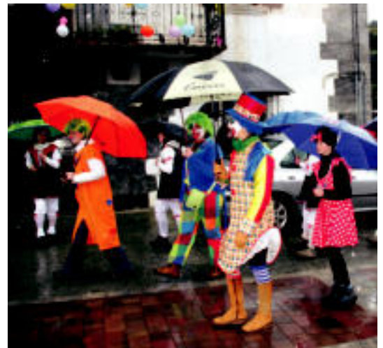
Pailazoz betetako traktorearen atzetik guraso eta herritarrek ibili ziren. E. MAIZ