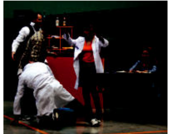
Tabernan gertatzen zen parodiaren zatietako bat. I. TERRADILLOS