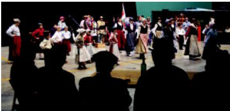
Areson pailazozen karroza izan zen eta Lizartzan agintariak dantzarien emanaldia ikusten aritu ziren. E. MAIZ-I. TERRADILLOS