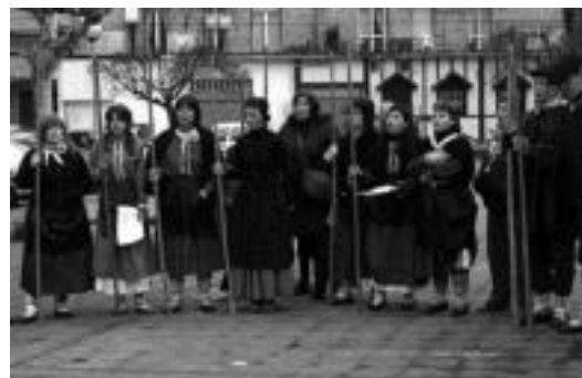
Txintxarri Abesbatzako kideak Agate Deunaren bezperan eskean.

Txintxarri abesbatzak 50 urte bete zituen enge egunean, eta urteurren hori dela eta, ospakizunak egingo ditu urtean zehar. Aurten go emanaldi guztiak bereziak izango dira. Agate Deunaren bezperan Txintxarri Txiki abesbatzarenekin, herriko bertsolariekin eta nahi duten herritar guztiekin bate-