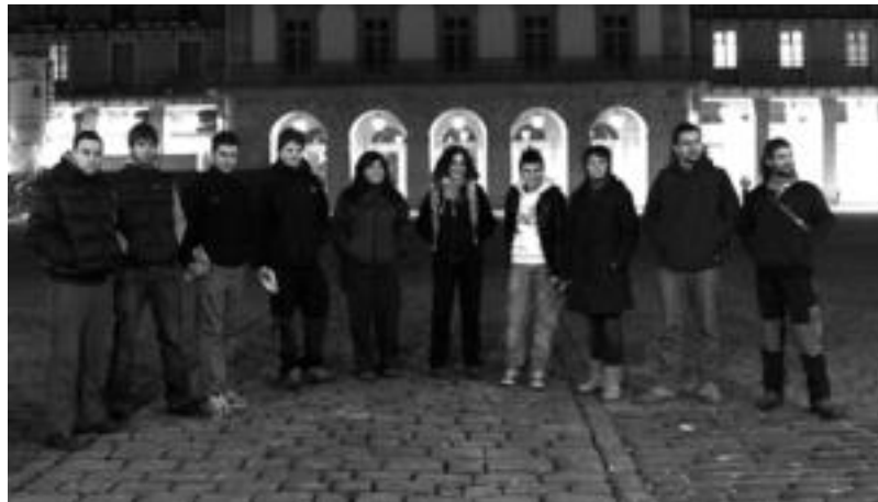
Txosna Batzordeko kideak atzo Euskal Herria plazan eginiko agerraldian. Bertan jarriko dituzte aurten ere.