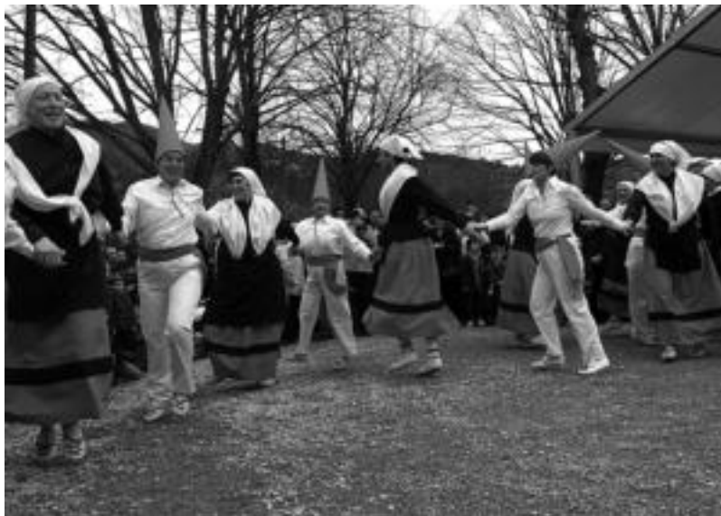
Amarozko dantzariak alaitzen dute giroa San Blas auzoko jaietan. IDOIA LAHIDALGA

Egun horretan, ohitura denez, Amarozkotako taldeak emanaldia eskainiko du, baina ez dira iaz bezalako mozturrotuko. Orduan, zenbait emakumezko gizonezko bezala eta gizonezko batzuk emakumezko bezala jantzi ziren. Aurten goan, besteak beste, agurra, makil dantza, fandangoa eta arin-arina dantzatu dituzte Amarozkoak.