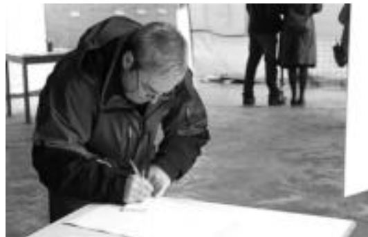
Auzokide ugari eman zuten euren iritzia pasa den asteburuan. N. LATABURU

Auzoak zer nolako ekipamendu komunitarioak eduki beharko litzuzkeen, gai horren inguruan bizilagunek duten iritzia zein den eta zer nolako herria, zer nolako Tolosa nahi duten jakiteko helburuz antolatuta zuten herri galdeketa hau Auzo Elkarteak.