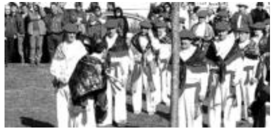
Otsolar dantza taldeak iaz ere emanaldia eskaini zuen. I. LAHIDALGA

Festa gose direnek aukera paregabea izango dute, hortaz, Lizartzara gerturatuz gero.