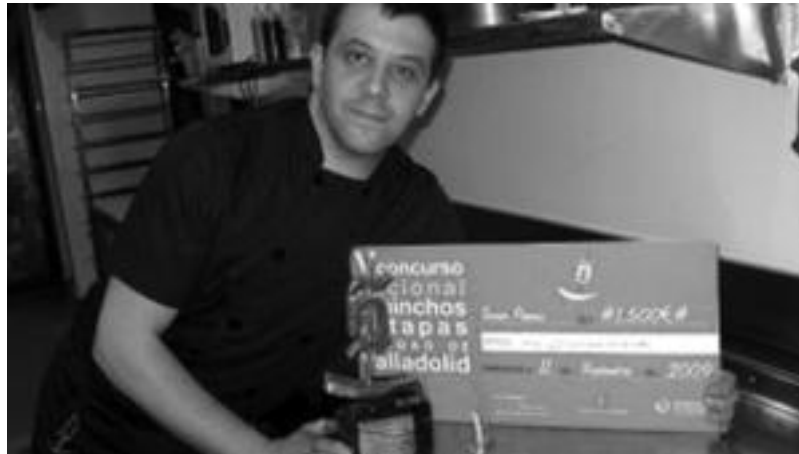
Valladoliden azaroan jokatu den Espainiako V. Pintxo eta Tapa lehiaketan hirugarren geratu zen. HITZA

Ni eta taldea lanean geundela, budo bat edota tortilla bat egiteko arrautzak txikitzen ari ginela, «arrautza forma duen tortilla bat egitea ondo egongo litzateke» pentsatu genuen. Ideia beti horrela ateratzen da eta nola egin daitekeen aztertzen hasten gara orduan. Nola egingo dugu arrautza-oskola? Gauza pila batekin hasi ginen beraz, zurringoa eta goringoa izatea. Eta horrela joan ginen ideia lantzen.