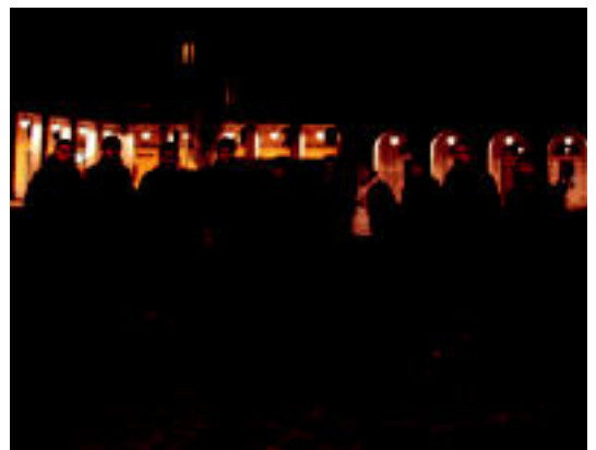
Txosna Batzordeko kideak Euskal Herria plazan. I. TERRADILLOS