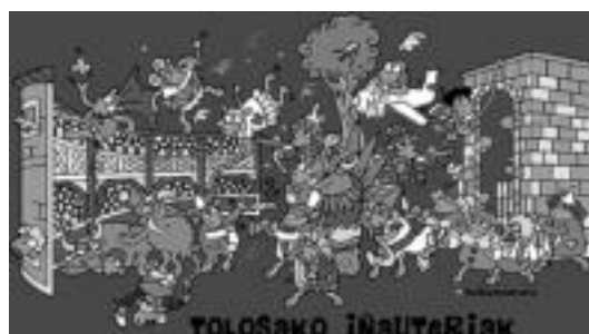
Marrazki honekin irudikatu dituzte Tolosako Inauterietan.