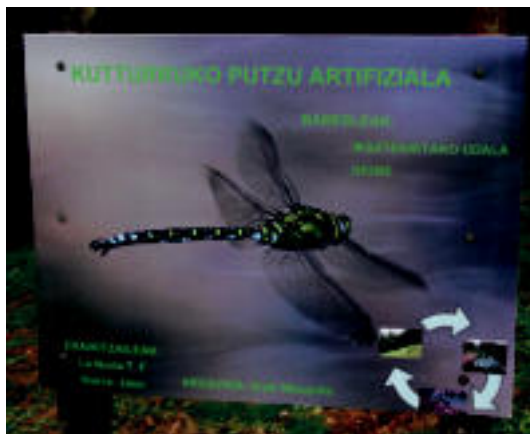
Burruntziak dira putzuaren ikurrak. I. GARCIA

Aurreko ostiralean amaitu zizuten putzuaren eraikitze lanak. Atsedenekuaren alde batean dago. Zortzi metro inguru ditu zabalera eta hamabi inguru luzera. Zorua maldan zegoenez, kerdutako lurra aprobetxatu dute malda handiagoa zuen zatia orekatzeko. Zuloa egin eta gero, zoruaren plastikoa jarri da. Mezquitak jakinarazi duenez, «iraunkortasun bat eman nahi izan diogu. Plastikoa ez bada jartzen, lurra ura xurgatu dezake eta putzua lehortu». Plastikoa gainera organikoz egindako sarea jarri dute, lehenbailehen naturalizatu dadin. Gero belarra eta beste landare batzuk erein dira ekosistema osatzeko.