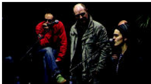
Txolarren aldeko bertsu saioa ere emitituko dute gaur ETB3n 22:00etan. HITZA