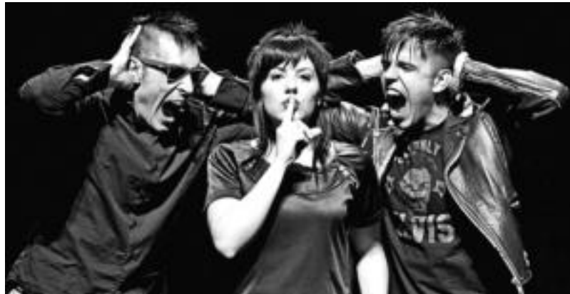
Gose taldeak bere hirugarren lana aurkeztuko du bihar gauean, 22:30etik aurrera, Bonberenean. HITZA

Gose taldeak hiru oinarri nagusi ditu: hiru musikari, hiru zutabe. Taldea hainbat musika estilo eta jario desberdinen bilgunea da. Gose taldeari trikitixak eranstion dion substantibo eta izena world-music da. Gitarrek atxikitzen diotena rock eta punkaren ukitua da. Perkusio elektronikoa eta programazio musika elektronikoa eta