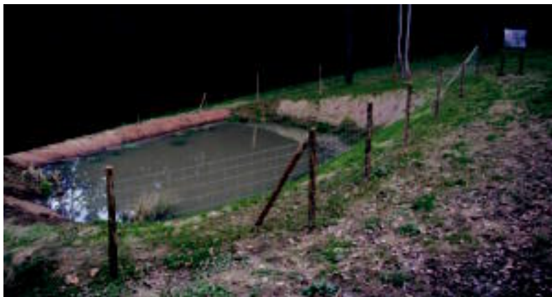
Putzu artifiziala Kutturrun atsedenekuan bertan dago.