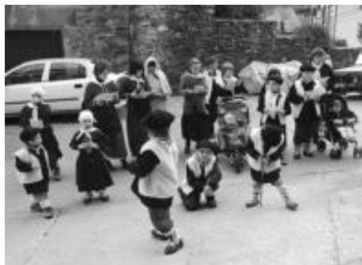
Gabonetan Areson bildu zuten dirua Malira eta Haitira bidaliko dute. HITZA

Hirugarrena, urterto egin ohi den moduan, kantari ibili ziren haurrei meriendatxo emateko erabiliko da. Horretarako haur guztiak Pake-Tokin elkartuko dira ostailaren 5ean, 17:30etan.