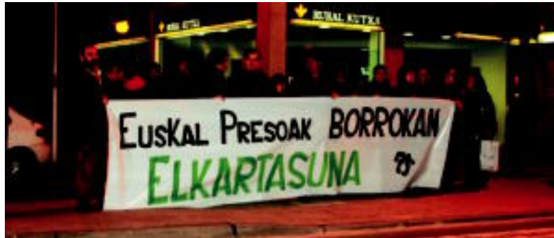
Asteartean, Villabonako herritarrek Euskal Presoiei babesa adierazteko elkarretaratzea egin zuten. E. MAIZ

Bertan daude eskualdekoak ditugun presoak eta hauen senide eta lagunak ere ez daude geldirik egoteko. Aste honetan testu bat argitaratu du Villabonako Amnistiaren Aldeko Mugimendua. «Presoen ahalgintza txalotu eta goraipatzea da barruak eskatzen diguna. Jakina da, azken urteetan muturreko egoerak areagotu direla presoen kolektiboarentzat» esanez hasten dute testua eta «testuinguru gordinean bizi dira preso politi-