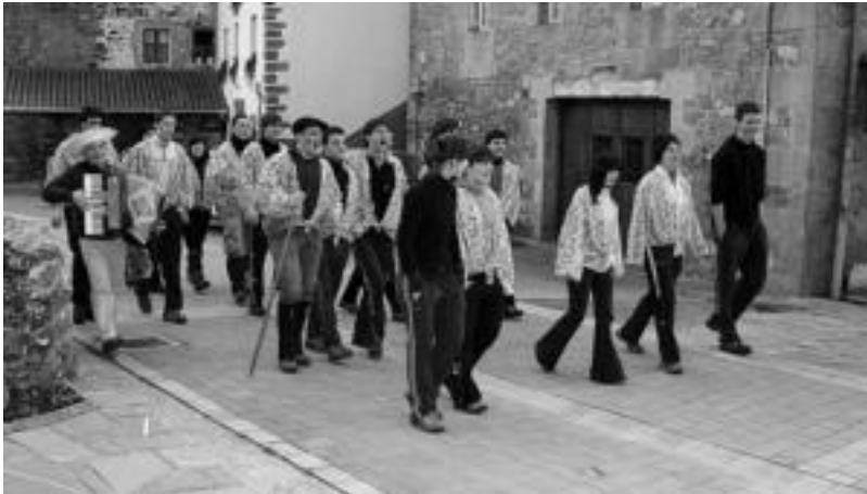
laz bezala, aurten ere Aresoko gazteak baserri-zaserri ibiliko dira eskean. ASIER IMAZ