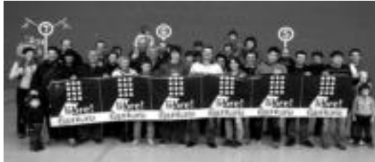
'Egunkaria'-ren alde elkarretaratzera egin zuten igandean Larraulen.