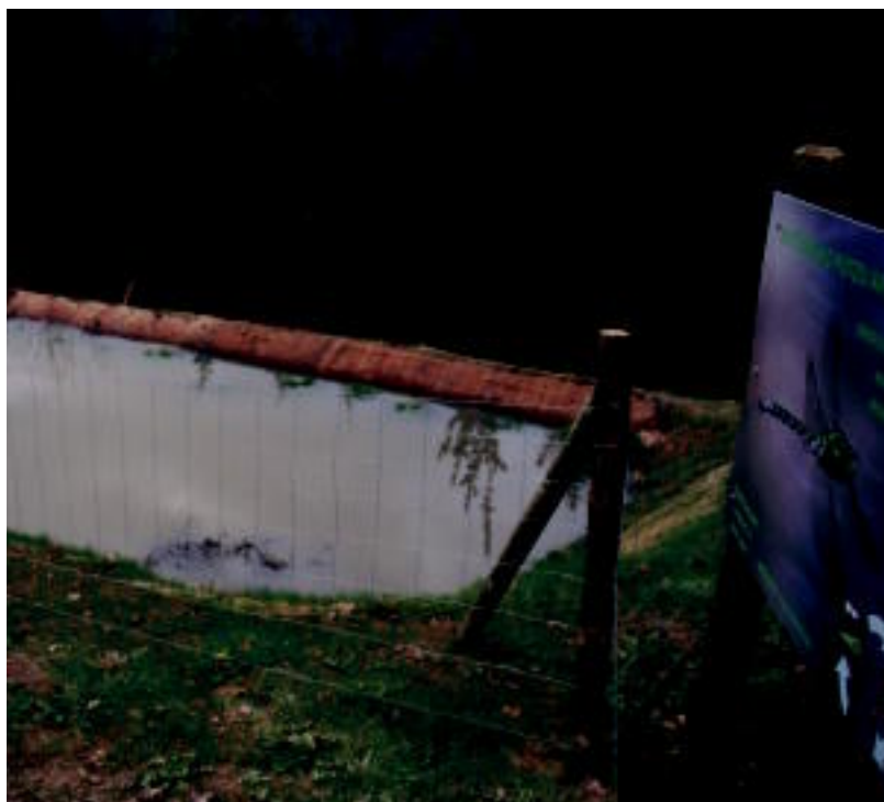
Kutturru atsedenekuko putzuak zortzi metro inguruko zabalera eta hamabi inguruko luzera ditu. I. GARCIA