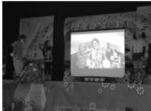
Pailazoek ikusmin handia piztu zuten Ibarako Belabietan. N. LATABURU

Antolatzaileek jakinarazi duteenez etziraiko aurreikusita zegoen graffiti jaialdia bertan behera utzi dute, euria dela-eta margoekin arazoak izan direlako. Baina aurretik ekitaldi ugari geratzen dira