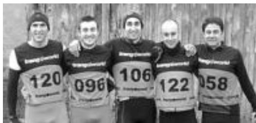
Mahala Triatloi taldekoek ekin diote denboraldi berriari. HITZA

■ Katea. Amezketako Zazpi-Ilturri inguruan urrezko katea bilatu da. J. Z. inzialekin. Harremanetarako deitu 678 47 66 12ra.