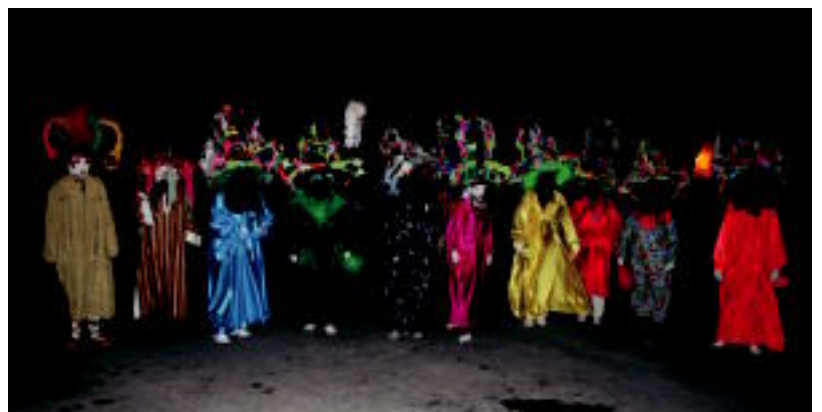
Hoteetako azken egunean haurrak eta atsaureek kalejira egin zuten herrian barna. ASIER IMAZ