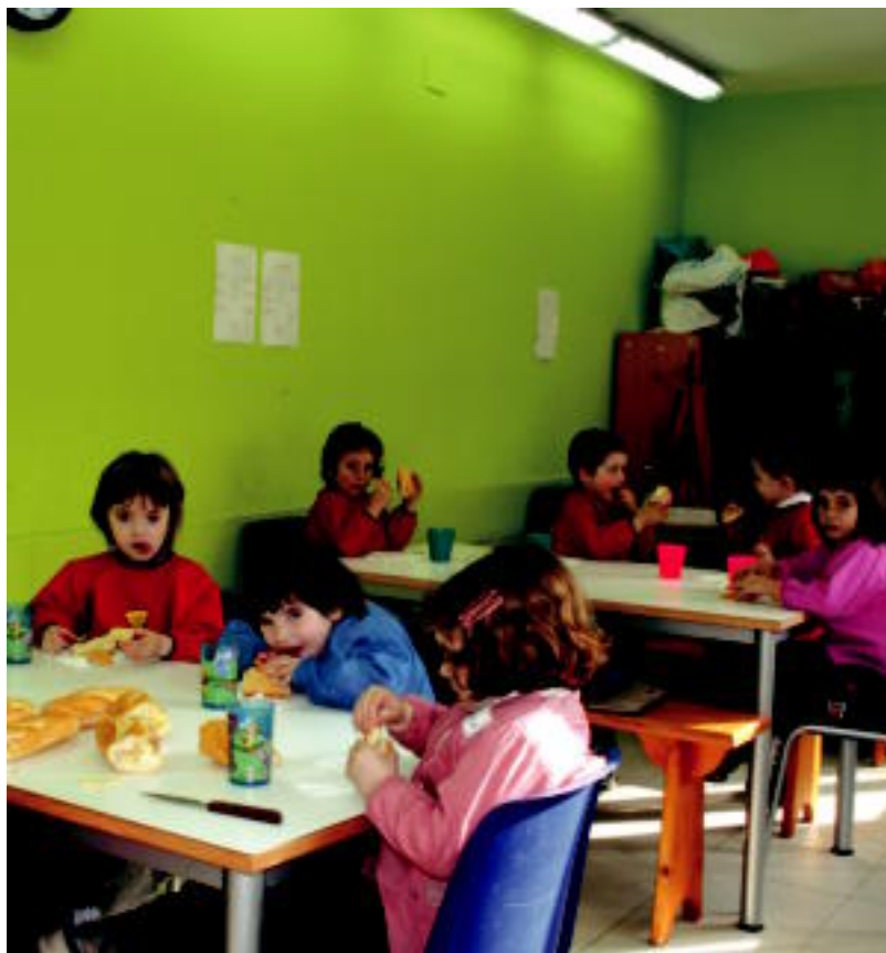
Ikaztegiatako eskolako haurrek ogitartekoak bazkaldu behar izan zituzten atzokoan. E.MAIZ

ESKAERA Jantokietako langileek euren lan baldintzak gainerako langileekin berdintzeko eskatzen dute 7