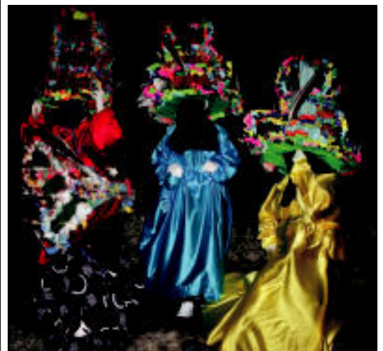
Atsaureek ikuskizun aparta eskaini zuten Ihoteen azken egunean. A.IMAZ