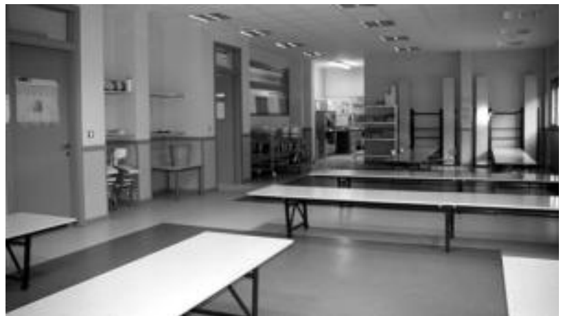
Samaniego ikastetxean, ikasle guztiak etxera joan behar izan zuten bazkaltzera. ESTI EZEIZA

LOATZO » Otsailaren Sean kaldereroak ospatuz, Loatzoko musikariak herri ezberdinetan kalera aterako dira. Anoetan, 18:00etan Loatzoko musika eskolako ikasleen banda Plazatik aterako da. Entsegu orokorra, hilaren 28an 18:30ean ikastolan egingo dute. Iruraren kasuan, 18:00etan Musika Eskolatik aterako dira eta Bonberenea txaranga eta Loatzoko ikasleak izango dira. Entsegu orokorra, hilaren 28an 18:30ean izango dute Musika Eskolan. Ibarra aldiz, 18:00etan Plazatik aterako dira eta Pasaia txaranga joko du. Entsegu orokorra, otsailaren lehen, 18:15ean ikastolan egingo dute.