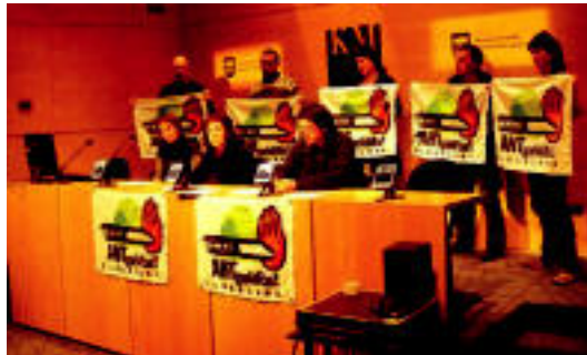
Donostiako Koldo Mitxelena Kulturunean egin zuten agerraldia.

Gogoratu behar da eskualdean Ikaztegieta, Alegia, Tolosa, Hernialde, Anoeta, Asteasu, Zizurkil eta Aduna herriek jasoko dutela Abiadura Handiko Trenaren era-