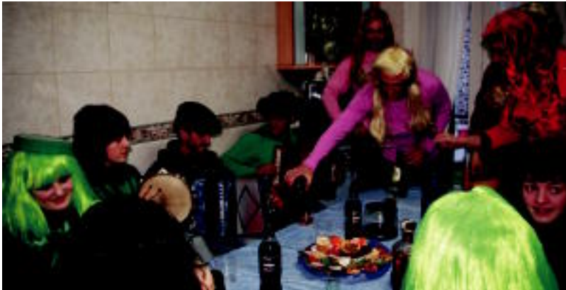
Itsasoko lamiak eta Heineken botilak, trikitalariekin batera Maritxuren etxera joan ziren eskera.