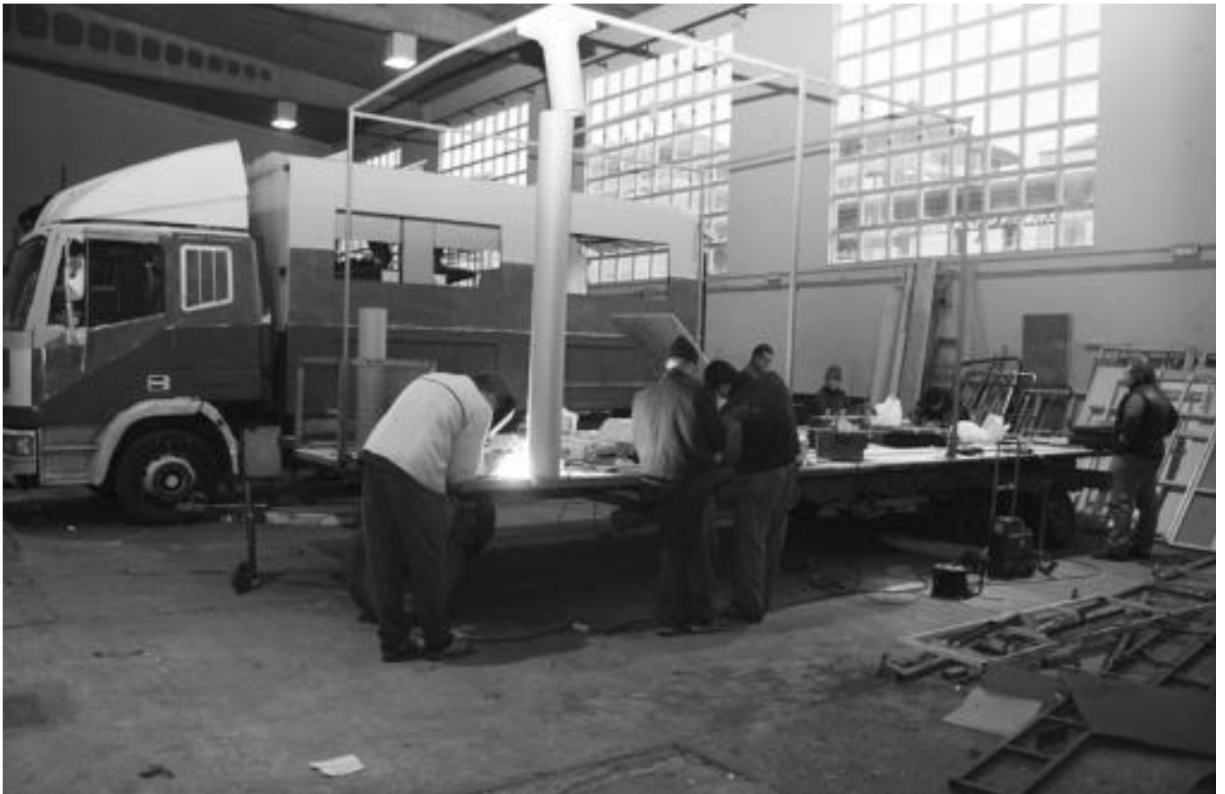
Helburu bera duten hainbat adin talde nahasten dira Ferialekuan. Karrozak egiterako unean, denek Zaldunita eta Asteartita dituzte buruan. ASIER IMAZ