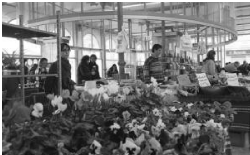
Eskaintza berriek erakarrita edo, jende ugari elkartu zen atzo Tolosako azokara. E. EZBIZA

Zoritzarreko pribilegioa 2010 eko lehen emakume erahila Tolosan gertatu izana. Ea guztion artean, ez Tolosan, ez inon, ez inoiz inori honelakorik ez gertatzeko guztiok ere pixkat gehiago inplikatzin garen. Gizarte hobe eta egitea gure esku ere badagoelako.