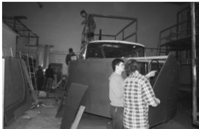
Batzuetan lagun eta besteetan eztabaidan, baina beti helburua zein den argi dutela. Ferialekua laborategi handi bat bilakatu da Inauterien aurreko egun hauetan. A. IMAZ

karka horrelako gauza handi eta polit bat egitea ezinezkoa zelako. Aurtengoa berezia izango da gainera; iaz, modu onean, autobus bat erosteko aukera sortu zitzaigun eta inbertsio gisa planteatu genuen. Hurrengo urteetarako oinarria ibilgailu hau izango da, eta ideiak honekin zerikusia izango dute. Gauzak horrela, zertaz atera nahi genuen aztertzen hasi ginean, itsasontzi bat egitea bururatu zitzaigun. Hortik marineen kontua etorri zen eta azkenean ho-