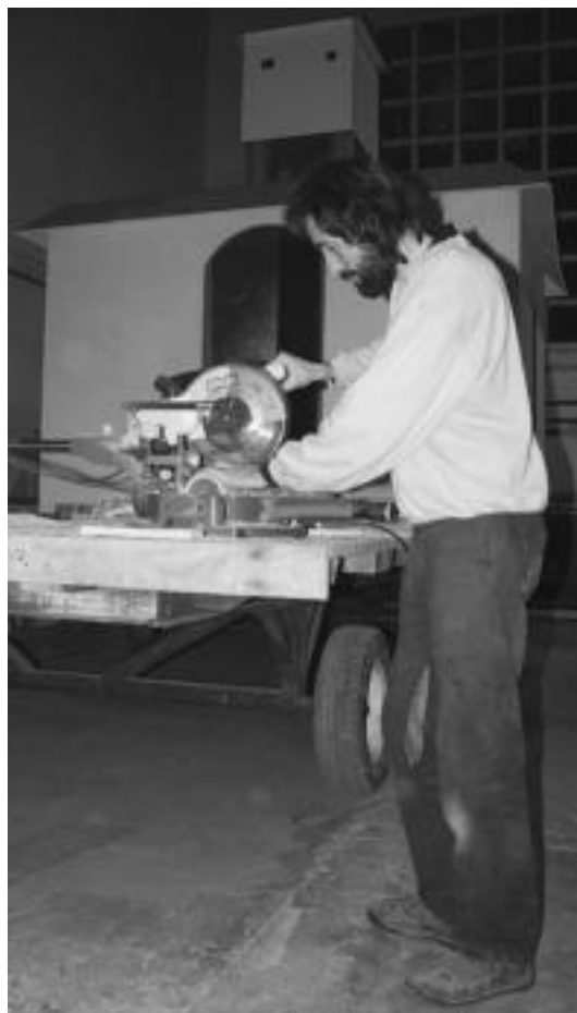
Lanetik atera eta Ferialekura, berriro lanari ekitera. A. IMAZ

Ferialekuko laborategian sortzen diren ideiak, Tolosako Inauterietan aterako dira kalera. Benetako ikuskizuna hor egongo den arren, Ferialekuan aspaldi hasi ziren Inauteriak.