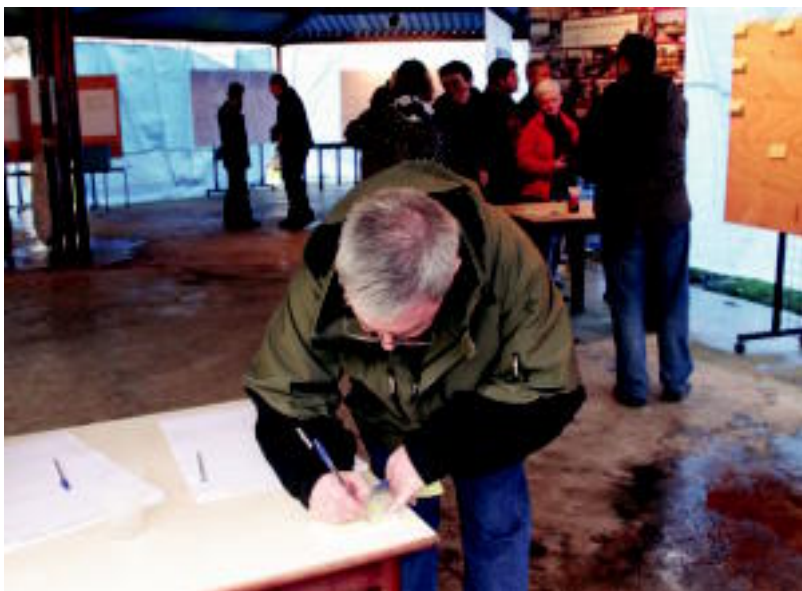
Herri galdeketa lehene eguna ospatu zuten atzo Amartz. N. LATABURU