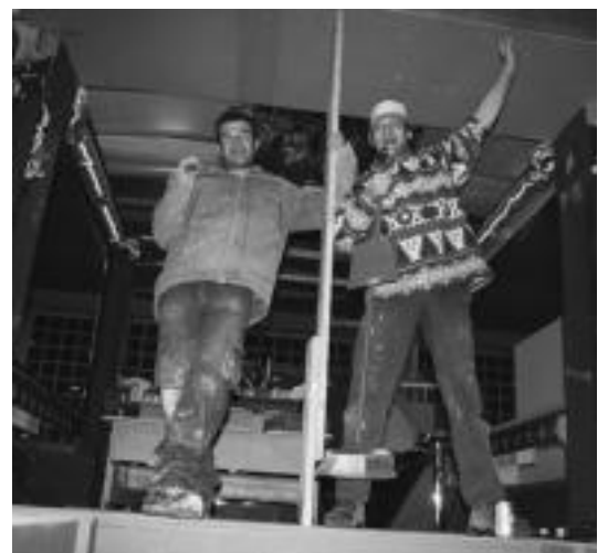
Beti dago artistentzat lekua Tolosako Inauterietan. A. IMAZ

Batuetakoa marinez irtengo diren bi koadrila daude. Itsasontziaren itxura eman nahi diote ibilgailu zaharrari. Batzuk brankan, besteak popan eta bi kapitainak autobusbaten gainean. Nahaste honetatik zerbait polita aterako dela pentsatzea zilezkoa da: «Tolosakoak eta Ibarraoakoak gara. Inauterietarako beti elkarrekin gabiltzan bi koadrila elkartzea erabaki genuen, ba-