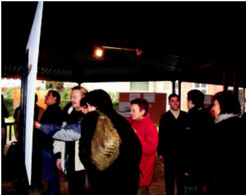
Panelen euren iritzia ematez gain auzoko argazki zaharrak ikusteko aukera daukate amarotzarrek. N. LATABURU