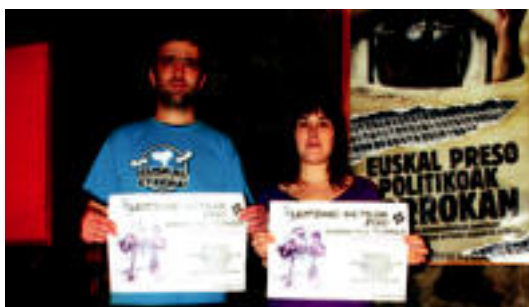
Torrea elkarteko kideek VI. Barrikotera joateko deialdia egin dute. A. IMAZ

Torrea elkarteko kideek usadio bilakatu den Barrikotea antolatu dute Ihoteetan