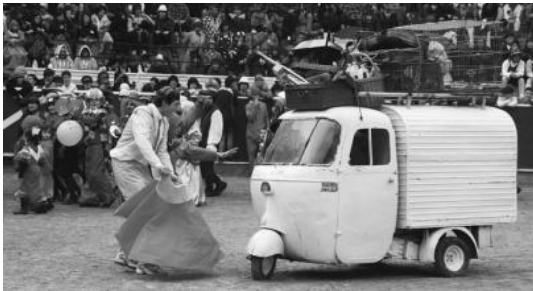
Pasa den urtean bezala, neurri bereziak jarriko dituzte «zezen-plazara gerturatzen direnen segurtasuna bermatzeko helburuz». I. GARCIA