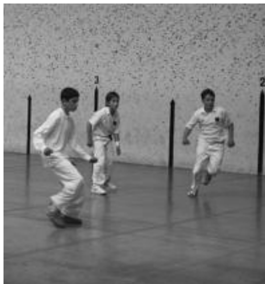
Behar Zana Elkarteko pilotariak partida jokatzen.

Gaur Villabonako Bearzana pilotalekuan Udaberri txapelketari dagozkion lehen mailako bi partida jokatu dira 19:00etan hasita. Lehen partida jubeniil mailakoa izango da eta Karrera-Artaza bikoteak Antiguako bikotearen aurka jokatu du. Ondoren nagusi mailan, Esnaola eta Benoit Errekak Antiguako bikotearen aurka jokatu du.