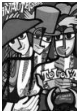
Aurtengo Inauterietako kartela.

Karroza eta konpartsen soinu-anplifikadoreak kalean erabiltzeko muga ere aldatu egin dute. Hala, aurrerantzean, 01:00ak arte baino ezingo dira erabili. Orain arte, 02:00etatik aurrera ezarrita zegoen neurria.