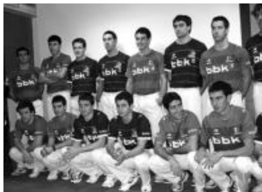
Bigarren Mailako Binakako Txapelketaren aurkezpen ekitaldia.