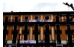
Sahararen aldeko ekimena. I.T.

TOLOSA Iritzia emateko panelak eskola aurrealdean jarriko dituzte 4