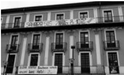
Tolosako Kultur Etxean kanpoaldean ikus daiteke jasotako kilo kopurua. IT.

■ Berokia. Tolosan, Kikara tabernan, hilaren 5ean, mutilen bi beroki beltz nahastu ziren. Nirea (Crazy markakoa) daukanak dei dezala 686 87 04 07 telefono zenbakira.