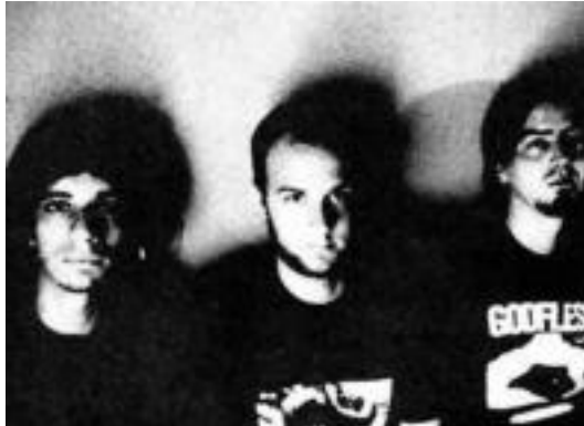
Bilboko Loan musika taldeko kideak. HITZA

Picore taldea ariko da lehendabizitako gauetan. Zaragozatik datorren taldeak Espainian eta Europan zehar hainbat kontzertu eman ostean egingo du geldialdia Bonbereneako eszenatoki gainean.