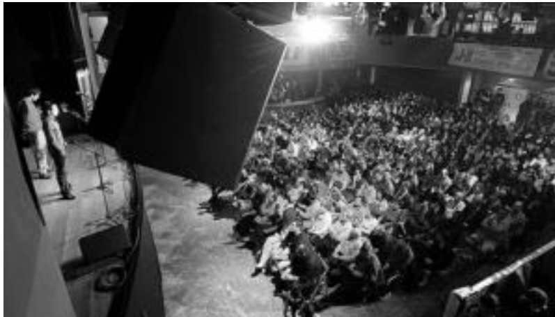
2008an Elizdoko Lur dantzalekuan jokatuko zen finala, baina aurten, berriro Lesakara itzuliko da. JOSU SANTESTEBAN

Etzi arratsaldean jokatuko da txapelketako lehen kanporaketa, eta