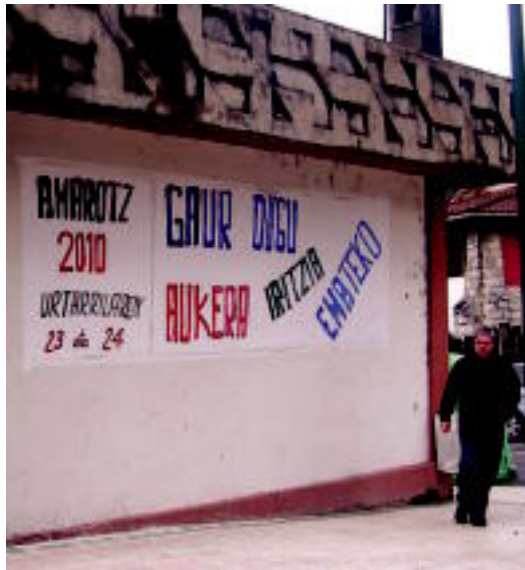
Herri kontsultan parte hartzeko deia egiten du Amaro auzo Elkarteak. HITZA

Asteburu honetako kontsulta bukatu ondoren, jasotzen dituzten