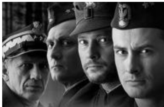
'Katyn' film poloniarra ikusgai izango da bihar, Leidorren. HITZA

Zine emanaldi ugari izango dira aste honetan Leidorren. Hasteko, ohi bezala, gaur Zine Foruma izango da. 19:15ean eta 21:45ean izango dira saioak. Andrzej Wajda zuzendariaren Katyn filma ikusteko aukera izango da jatorrizko bertsi-