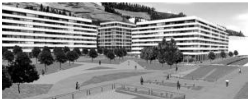
Voith-Gorostidi eremuak itxura hori izango du proiektuaren arabera.

taren bidez esleitu dituzte. Gaur udaletxeko batzar aretoan egingo duten zozketarako Tolosaldeko 17 lagunek eman zuten izena. Horien baldintzak aztertu ostean, azkenean 15 lagunek osatu dute zerrenda. Onartuen eta ez onartuen zerrenda udaletxeko erregistroan dago.