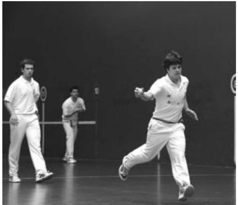
Pasa den urteko VI. Berria Txapelketako partidetak bat. ESTI EZEIZA

Kanporaketa horietan sailkatzen diren aurka jokatzeko zain