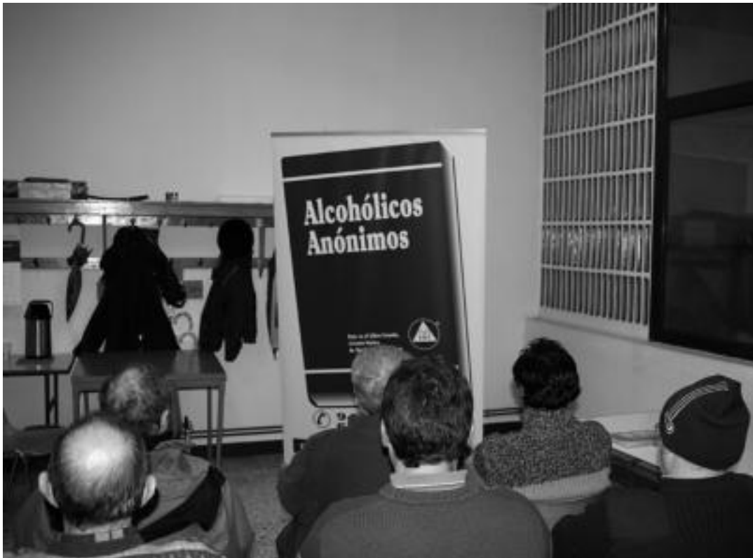
Uzturre taldeko zenbait kide Tolosako Sakramentinoetan bitzen diren lokalean.

Alkoholiko Anonimoak elkarteko Tolosako Uzturre taldeak hitzaldia antolatu du gaurko Alegiako kultur etxean. Alkoholak sortzen dituen arazoez hitz egingo dute hainbat esparrutik solasaldian.