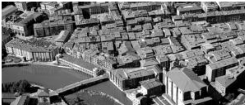
463 lagun aritu dira parte-hartze prozesuan, eta bertako ekarpenekin osatu dute plana. HITZA

2006. urtetik ari dira Tolosako Udalean «etorkizuneko garapenak markatu behar dituen ardatzak» definitzen. Tolosa 2015 egitasmoaren baitan «etorkizuneko Tolosa nola eraiki jakin asmoz» prozesu parte-hartzailea jarri zuten abian. «Ahalik eta herritar gehienek parte hartzea izan da gure asmoa, eta azkenean norbanako eta elkarleen artean 463 lagunek hartu dute parte; horrez gain, webguneko foroa bezalako erra-