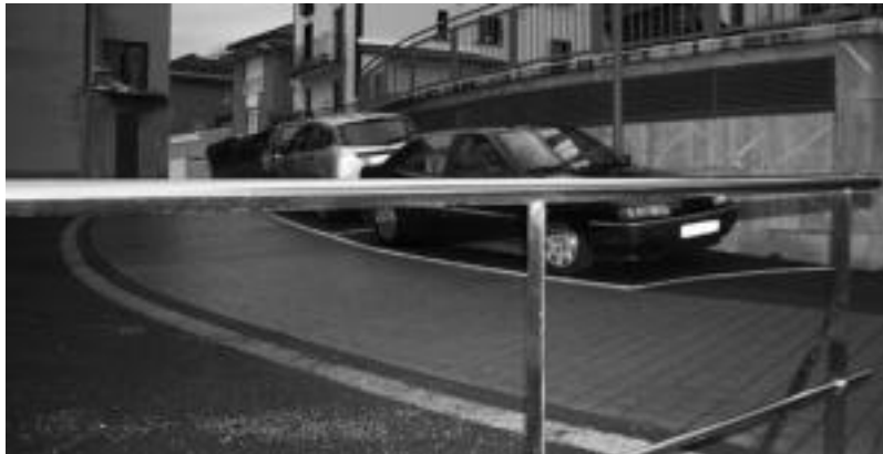
Baranda eta eskailera berriak, lurra konponduta... dira Julian Gaiarren egindako aldaketak, besteak beste.