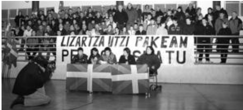
Tolosaldeko Ezker Abertzaleak prentsaurrekoa eskaini zuen atzo Lizartzako plazan. A. IMAZ

Lehenik eta behin, Olanori, bere sendiari eta bere lagunei elkartzesuna azaldu zien Ezker Abertzaleak: «Lizartzak, Tolosaldeak, Euskal Herriak, ez ditu Otaola, Rubalcaba, Ares edo horrelakoak behar, ezta nahi ere. Euskal Herriak, Tolosaldeak eta Lizartzak herritarren eguneroko lana behar du. Peio bezalako kideak eta herrita-