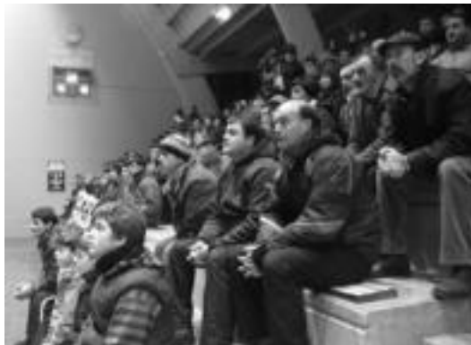
Bearzana pilotalekuan ikuslerik ez zen falta izan. E. EZEIZA

Lehen partiduak kadeteen mailako izan zen eta eskualdekoen arteko lehia izan zen bertan. Bi alegiar, Nazabal eta Artola, Olano aresoarria eta Tolosa anoetarraren