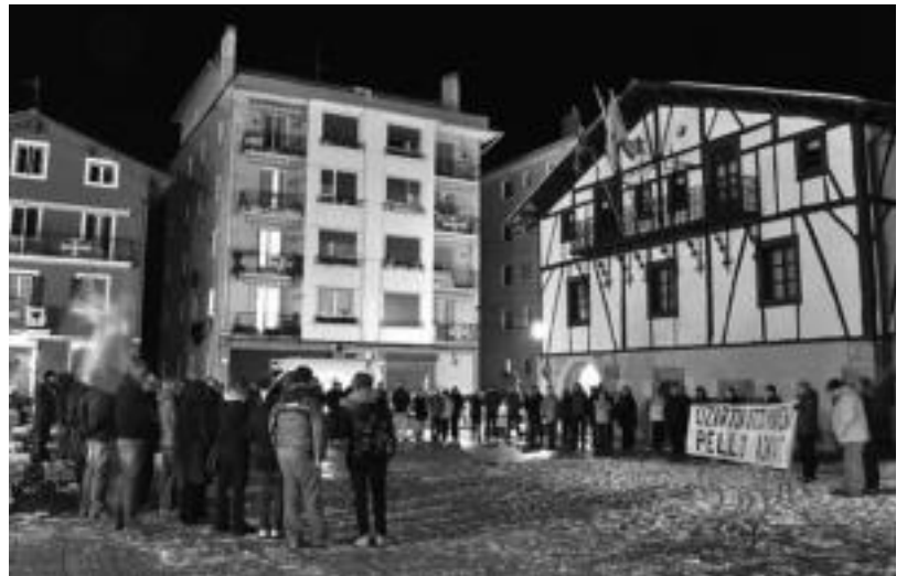
Herenegun iluntzean, azken bost egunetan bezala, plazan bildu ziren lizartzarrak; 200 lagun inguru elkartu ziren. HITZA

AAMk hainbat galdera egin ditu «Olanoren tortura kasuen aurrean», bereziki torturaren erabilera