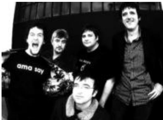
Goian, Capsula taldeko kideak. Behean, Ama say taldekoak. HITZA

kan zehar bidaia egiten dute, rocketik psikodelia doinuetera igarotzen eta garage soinuak landuz.