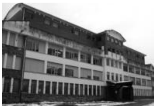
Erleta eskolako azken bi solairuak berritu nahi ditu Udalak. ASIER IMAZ