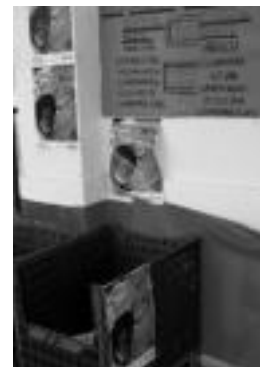
Tolosako Eroskin ere utzi daiteke. I.T.

Hilabete bukaeran amaituko da kanpaina, eta orain arte «poliki, beste urteetan baino mantoago» doala azaldu dute Tolosaldea Sahararekin elkartekoek. Horregatik herritar guztiak animatu nahi dituzte ekimenean parte hartzera.