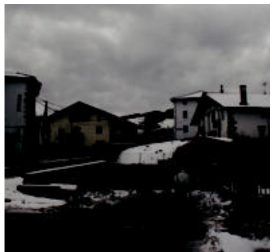
Armoi gailurrean ur biltegia egiten hasi dira. E. MAIZ

VILLABONA Txapelketa urte amaieran berriz ere antolatzea adostu dute 4