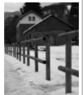
Plazaolako Geltokiaren ingurunea. A.L.

Zabalo eta Barriolaren esanetan, lan hauek burutzeko diru-laguntza ez da Nafarroako Gobernutik iritsi, komunikabide batzuetan azaldu den bezala, proiektu hau Espainiako Ingurumen Ministeriotik bideratu baita.