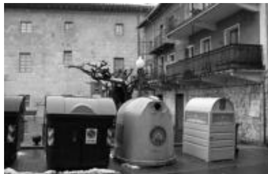
Udaletxearen ondoan dago olio jasotzeko edukiontzietako bat. HITZA

Udalak, bestealde, Alegiako Orri udal informazioarako argitalpenen gogorarazi ditu hondakinak ateratzeko ordutegiak. Hala, zabo-