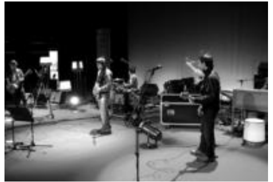
Leidorren iaizko urtarrilaren 16an eskainitako kontzertuaren irudia. I. TERRADILLOS