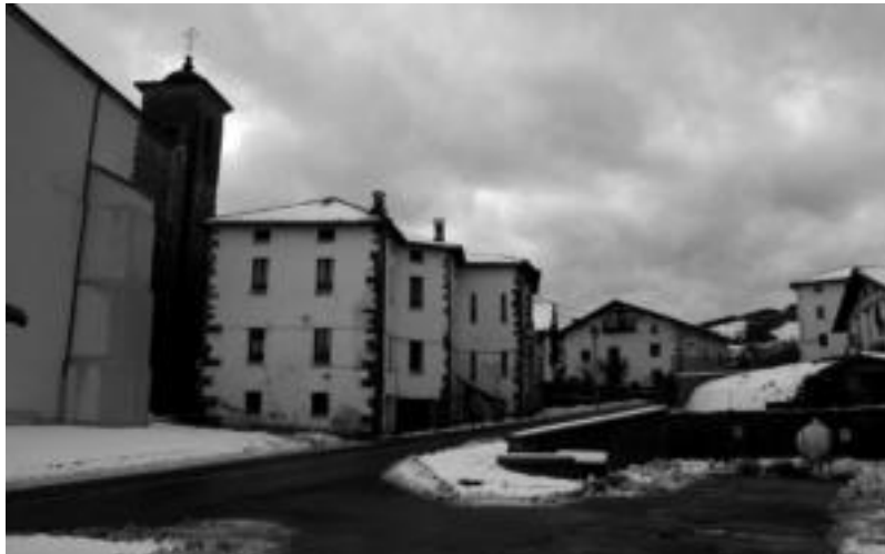
Goiazzen 652 metro tara dagoen Armoi gailurreko ur biltegia egiten hasi dira. E. MAIZ

Bideen kasuan esaterako gehienez ere kostuaren %80 laguntzen du Foru Aldundiak.