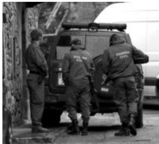
Azaroaren 29ko gertaerak argitu gabe jarraitzen dute.

Erantzunik jasotzeko esperantzarik gelditzen zaion galdetuta, erantzuna argia da: «Zero».