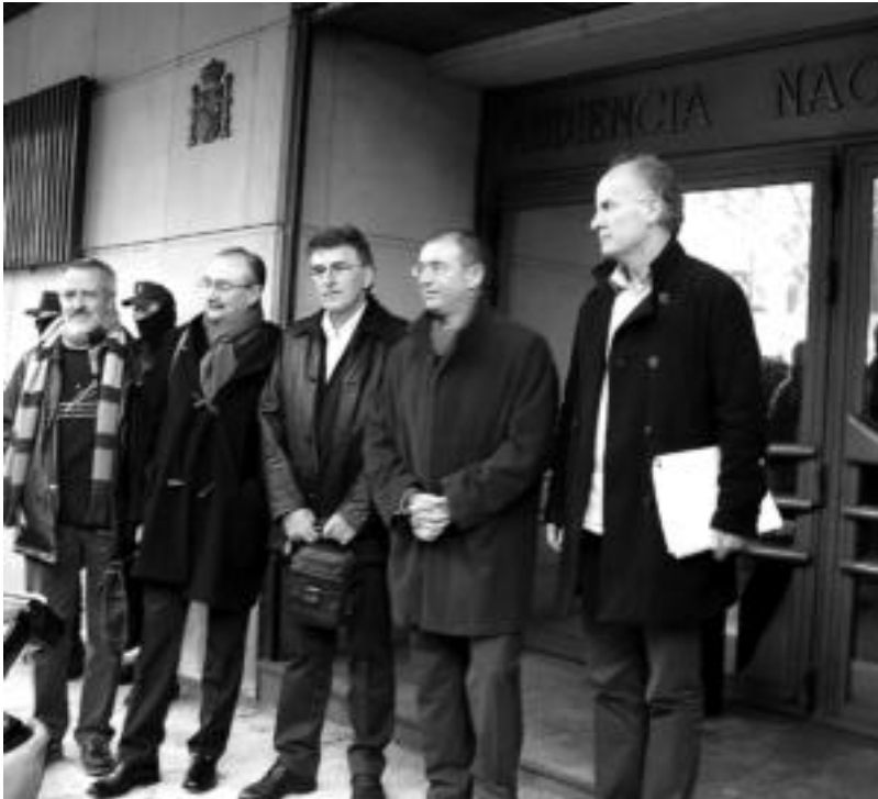
Pasa den abenduan hasi zen 'Egunkaria auziko' epaiketa; atzokoaren ondotik hilaren 25ean jarraituko du epaiketak. HITZA