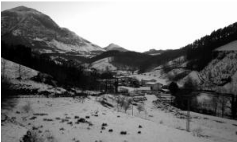
Ola auzoan aurreikusita dauden pabilioi berriak errekararen atzean egiteko aukera erabaki du Udalak. A. IMAZ

Beste erabaki garrantzitsua Udalarren euskararen barne erabilera plana onartzea izan da, IV. Plan-gintzaldirako neurriekin. Plana-