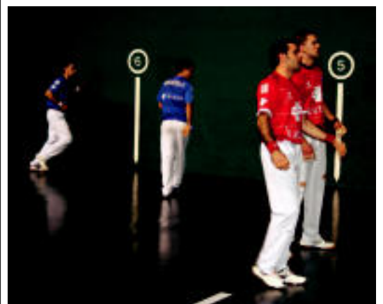
Tolosako Beotibarren izan zen Binakako Txapelketako partida.

TOLOSA Topic-en obrak baliatuz argitasun baldintzak hobetu zituzten, orain zoladuraren eta hiri altzari berrien txanda iritsi da <3