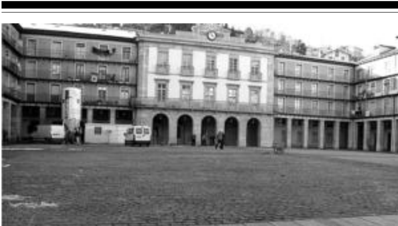
Itxura ezberdina du atzotik Euskal Herria plazak, bertako zoladurakonpontzen hasi ziren langileak.