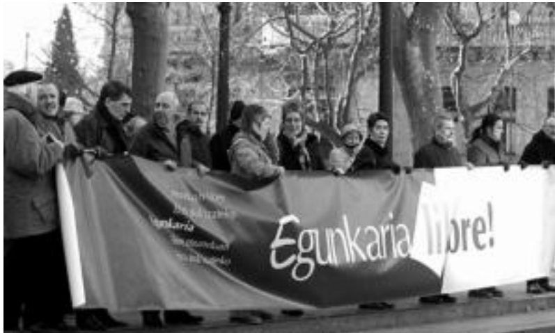
Arte plastikoetan dihardutenek sostengua adierazi zieten larunbatean Egunkaria-ko auzipetuei.

Gabonetan eginiko geldialdiaren ondoren, beraz, gaur ekingo diote epaiketari, eta jarraipena hilaren 25ean, 26an eta 27an izango du, berriro ere otsailean segitzeko.