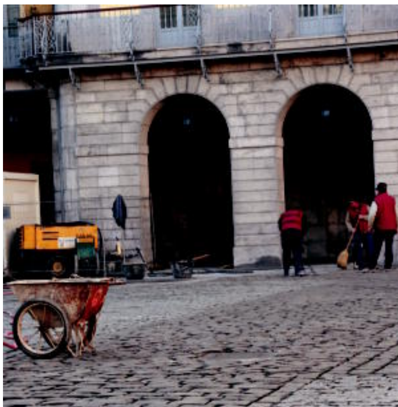
Atzo hasi zituzten Euskal Herria plazako lanak; eremua oinezkoentzat berreskuratu nahi du Udalak. E. EZBIZA

« GARAIPEN BOROBILA » Herenegun izan zen azken jardunaldia; «garaipen handia» izan da kirolarientzat <6