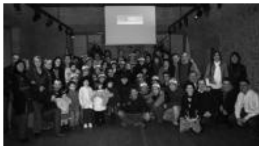
Joan den urteko lehiaketako irabazleak, sari banaketa ekitaldian. I. TERRADILLOS

etzi, jai batzordearen bilera izango da. 19:00etan elkartuko dira Kultur Etxeko bigarren pisuko gelan. Inauterietako izango dira hizpide. Honetan ere edonork hartu dezake parte.