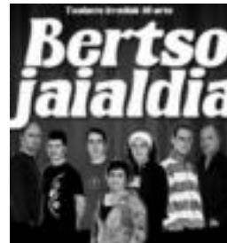
Jaialdia iragartzeko kartela. HITZA

Bere arduren artean, irratia programazioa eramatearena