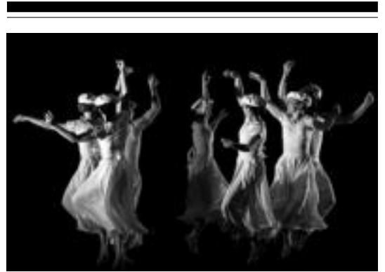
Aukeran dantza taldeak bere azken lana aurkeztuko du martxoan.

Birgaitze lan hauek Eusko Jaurlaritzako Industria, Berrikuntza, Merkataritza eta Turismo sailak sustatutako Merkagune-Hiri merkataritza planaren bitartez finantzatu dira. Hala, 148.000 euro jaso ditu Udalak ekimen hau laguntzeko, eta beste horrenbeste, plazaren inguruan, albo batera utzita dauden lokalak erosteko. Ondoren, hauek eman nahi ditu, ostalaritzako eta merkataritzako negozioetarako.