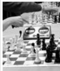
Xake lehia. ESTI ZEIZA

Hor ikusiko dira hobeto mailaz igo ahal izateko bi taldeek dituzten aukerak.