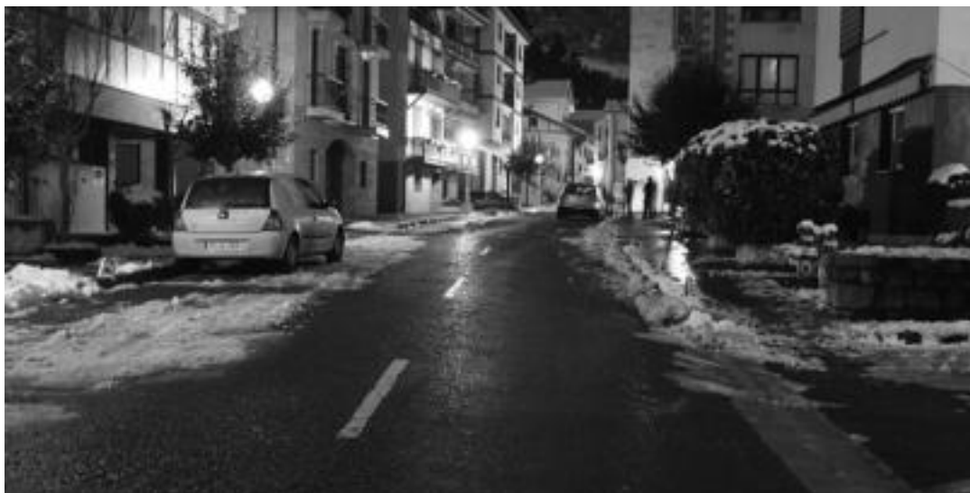
Plantxenetik Medikuei etxeraino bitarteko oinarrizko sareak eta lurzorua berri nahi ditu Udalak.