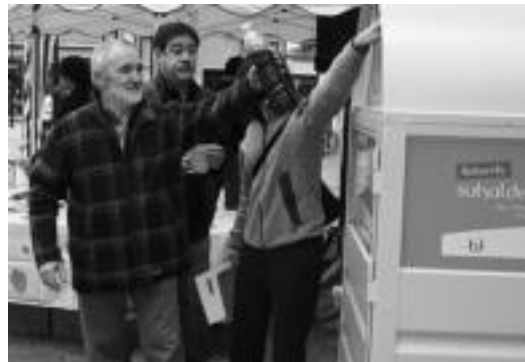
Sukaldako olioak uzteko edukiontzia jarri berri dituzte Tolosan. A. IMAZ

Olio bilketaren sistema aldatu dutela jakinarazi dute Tolosaldeko Mankomunitatetik. Hala, sukaldako olioaren bilketa egiteko zerbitzu iraunkorra izango da ezarri berri diren edukiontzien bidez. Bestalde, hondakin arrisksutsuak leku eta ordutegi hauetan jaso ahaliko dira: Tolosan (Trianguloa), bigarren eta azken larunbatetan goizetan, eta Villabonan, (Errebotte plaza) azken asteartean goizetan. Tolosako San Blas Garbigunean ere jasotzen dituzte astelehenean ostiralera goizez eta arratsaldean eta larunbat goizetan.