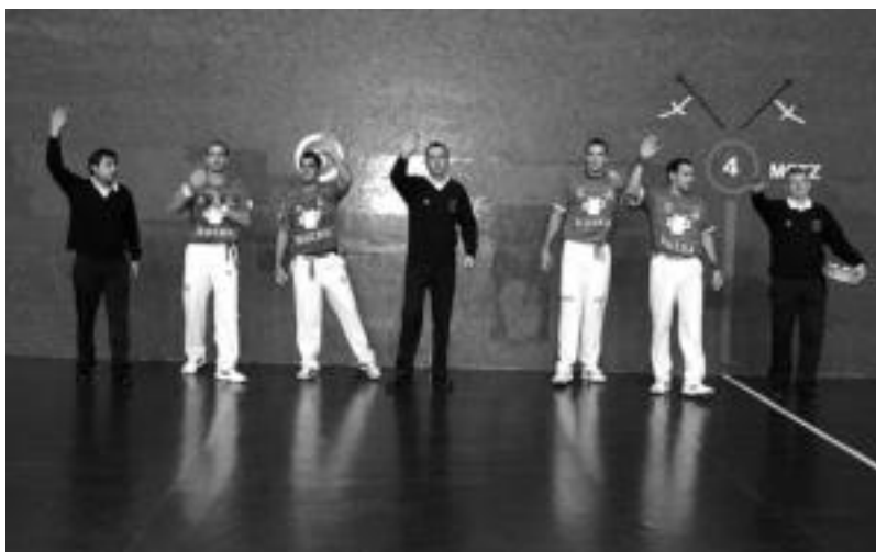
Jende ugari elkartu zen atzo Tolosako Beotibar pilotalekuan. Urdinak, Bengoetxea VI.a-Beloki, nagusitu ziren. ASIER IMAZ