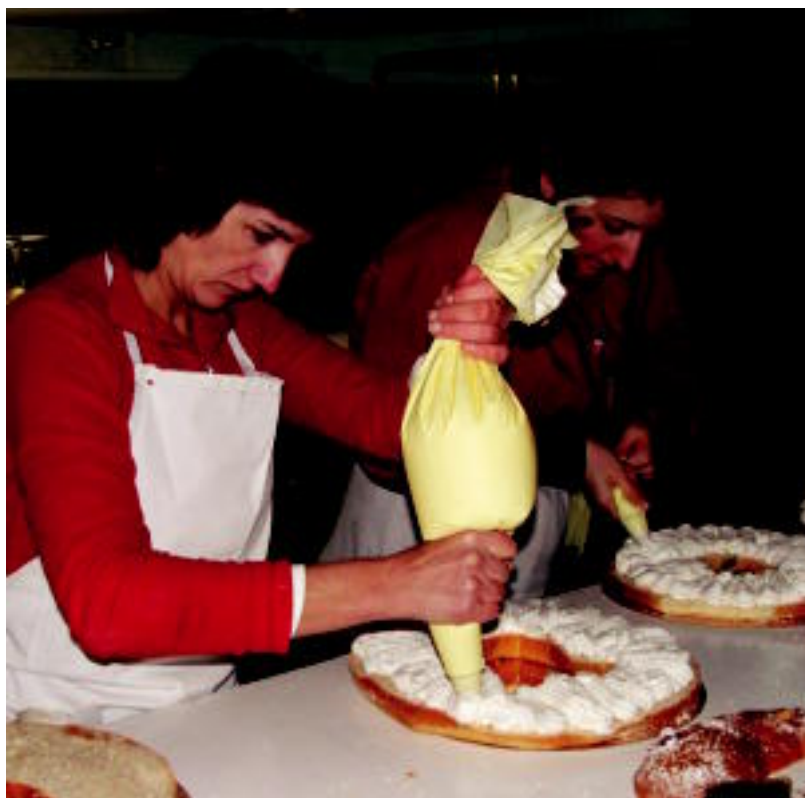
Albizturko Ogi-Ona okindegian familian gaupasa egin zuten, Errege opil goxoak prestatzeko helburuarekin. HITZA