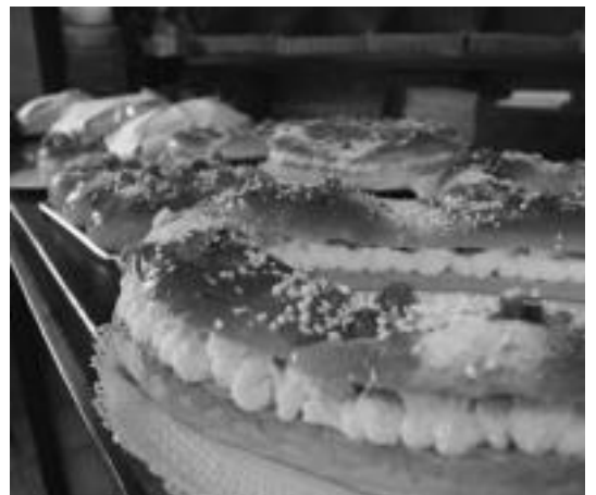
Ogi Berri okindegioko erakuslehoia errege opilez beteta zegoen atzo. E. EZEIZA

Eta, errege opilaren eguna Errege Eguna bada ere, oraindik, aste honetan ere, erosteko aukera izango da ziurren saltoki gehienetan.