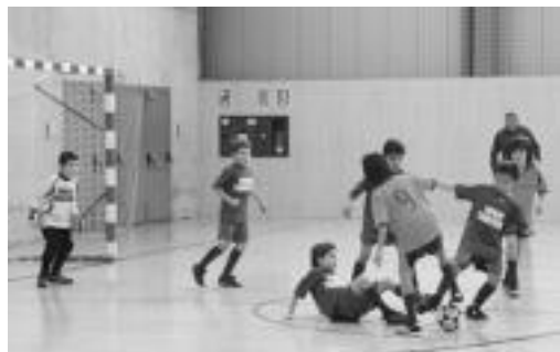
Partida lehiatua izan zen Galaktikoak eta lurre Tabernak-en artekoa; parte-hartzaileentzat opariak izan ziren. E. EZEIZA

Lehendabizi, benjamin neskek atera ziren kantzara. Laskorain eta Izurdeak, hain zuzen ere, hemen bigarrenak gailendu ziren, 0-6ko emaitzarekin. Bigarren partida benjamin mutilen kategoriakoa izan zen, Tigre txiki eta Trumoi taldeen arteko partida 1-2an amaitu zen. Jardunaldiko hirugarren norgehiagoka berriro ere nesken artekoa izan zen. Alebinetan, Denok bat-ek Intxurre izan zuen aur-