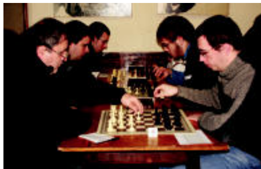
Oargi elkartean Xake Txapelketa jokatu zen atzokoan. ESTI EZEIZA

TOLOSA Natura 2000 sarea zer den argitzen du 'Bizitzeko tokiak, pertsonentzako tokiak'-ek » 2