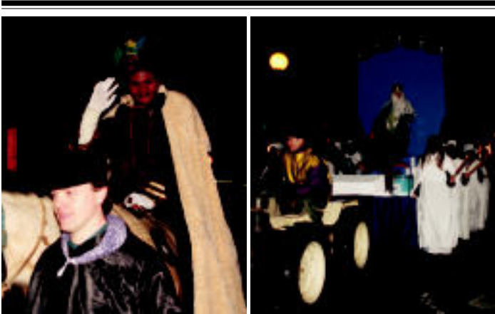
Tolosako kabalagatan, Baltasar Erregea ikusiten da agurtzen. Bigarren irudian, Villabonako kabalagataldeko Melchor erregea ikus daiteke.