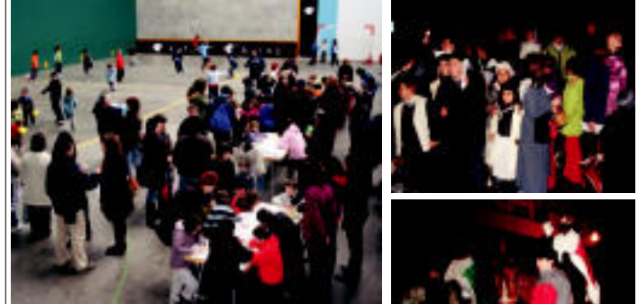
Inuran herrian buelta egin ostean plazan elkartu ziren guztiak opariak jasotzeko.