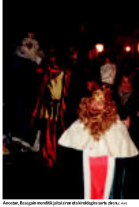
Anoetan, Basagain mendirik jaitu ziren eta kiriolegira sartu ziren.

Hala ere, herri guztietatik pasatzen dira eta gutxi edo asko, denentzat izaten dute zere edo zere. Berastegi, hiru Errege Magoekin batera Olenzero ere iritsi zen eta helduek Gasteizko alreporrituzuzenaren ekarritako leuek banatu zitzen. Haurrei berriz Erregeek opariak eman zitzen. Astesura ere, Elizmendirik barrena, Olenzero eta Erregeak iritsi ziren. Orenan etxetz etxe ibili ziren eta baita Areson ere. Leitzan herriko belesnara gerturatu ziren eta bertan herriko abesbatzak egintzen hartara. Berrobi eta Bidegoianen ere galdialdi egin zuten eta jaiotza ibizidunak izan zituzten. Tolosara Itasakundik, Amozolara San Martindik, Lizartza Zelain aldetik eta Villabonara Amozolatik gerturatu ziren. Muxuak, negarrak, gozokiak eta opariak izan ziren herri guztietan jaun eta jabe.