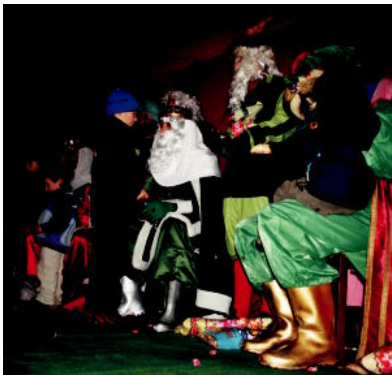
Leitzan herriko abesbatzak egin zien harrera plazara gerturatutako Errege Magoei. A. IMAZ