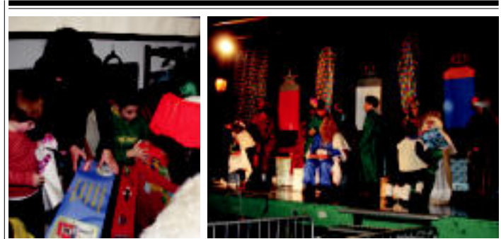
Areson Erregeak etxetz etxe ibili ziren opariak banatzen.

120-180 zentimetroko luzera, 90 zentimetroko zabalera eta 76 zentimetro altuera du. Interesa duenak, 699 467 654 telefono zenbakira deitu behar du.