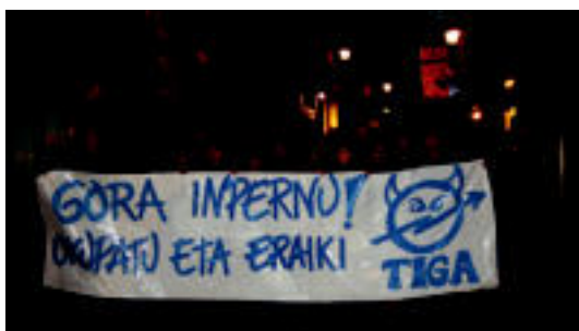
Manifestazioa egin zuten atzo arratsaldean Tolosako kaleetan. E. EZEIZA

TOLOSA Duela astebete okupatu zuten hutsik zegoen Korazonisten eliza » 3