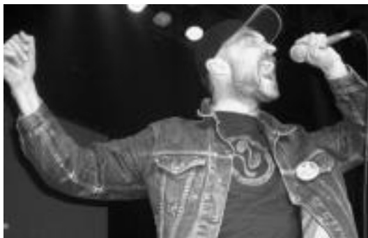
Hertzainak taldeko abeslari ohia Tolosan izango da bihar. HITZA

Musika • Bakarleri legazpiarrak bere azken lana, '16 lore' izenekoa, aurkeztuko du etzi zuzenean 22:30ean.