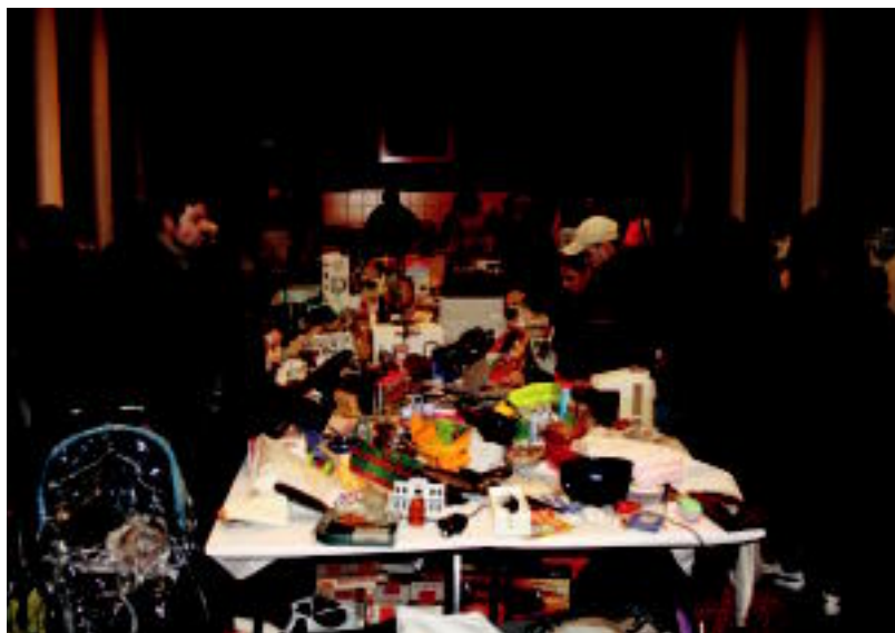
Jende asko bildu zen Merkatu Txikiko atzoko azken egunean Tolosako Kultur Etxean. E. EZEIZA