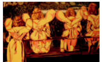
Guztiak ez dira erretratuak eta naturak ere garrantzi handia izaten du bere koadroetan.