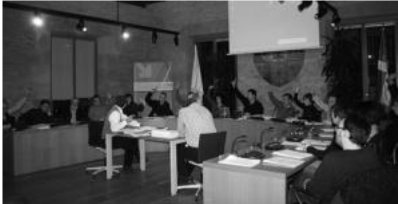
Eusko Alderdi Jeltzaleko zinegotziak eta Hamaika Bat-ekoek bozkatu zuten aurrekontu proposamenaren alde.