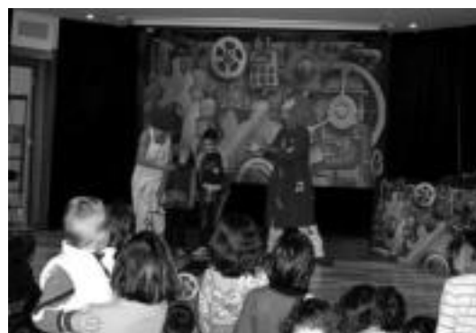
Musika Tresnen Fabrika emanaldia Ibarren.

personaia. «Kortxea jaunari zentzutasuna jartzen saiatzen da, eta bide batez fabrikari txukuntasuna mantentzen du», diote. «Instrumentuak jotzen ditu Kortxea jaunarekin batera. Kantatu eta dantzatuta ere egiten du». Hirugarren pertsonaia Koxme da, Kortxea Doktoare eta Filomenaren laguntzaile eta mekaniko bezala argitzen dena.