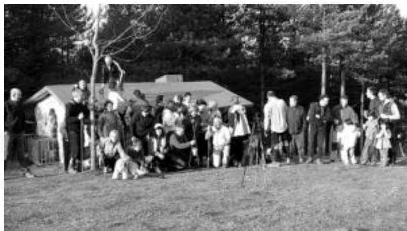
Urtero bezala, iaz ere Loatzora joan ziren Aizkardi Mendi Elkarteak kideak urtarilaren 1ean. HITZA

Villabonan berriz, bailarako hainbat eragilek deituta manifestazioa egingo dute gaur. Herriko plazatik 19:00etan abiatuko dira eta Zizurkilen amaituko da mar-txa. Ekimenak Villabonako Udalaren babesarekin jaso du.