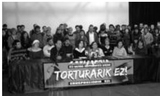
'Tortura erabaziz egindako galdeketa' salatu dituzte.