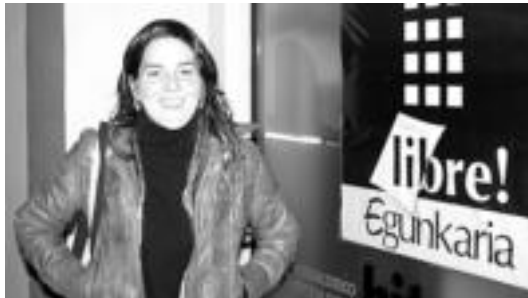
Artetxe Tolosaldean ariko da «herriz herri eta auzoz auzo» lanean.

Berez, egitasmoa 2002-2003 urteetan jaio zela esan daiteke. Bahardugu euskara elkarrearen eskutik eta lehenik eta behin Eibar inguruan hasi ziren lanean. «Ondorengo 3 urteetan, 2004-2007 bi-