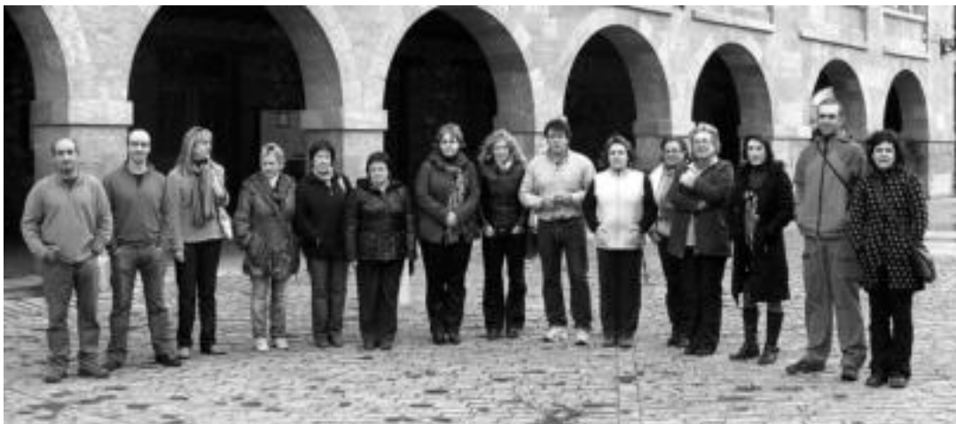
Kaxkabeltza Elkarteko hainbat kide herriko plazan. Merkatarikoa Elkartea Eguberrietako kanpainan murgildurik aurkitzen da buru-belarri.

Beste hainbat herrik bezala, Leitzak ere badu azaroz geroztik bere Merkatarikoa. Dagoeneko 38 bazkide dira, baina elkartu nahi dutenentzat ateak zabalik jarraitzen dute.