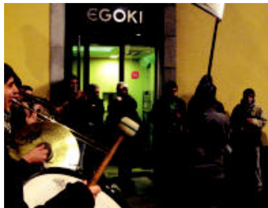
Bonberenea Txarangak alaitu zituen atzo Tolosako kaleak.

ALEGIA Afizionatuen goi mailan aritzen da aurrelaria eta aurten sei txapel jantzi ditu »5