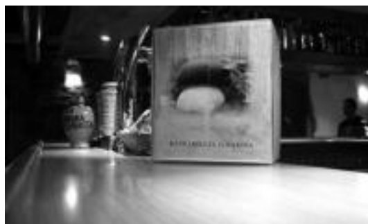
Merkatarien zozketa ilbeltzaren Sean egingo dute.