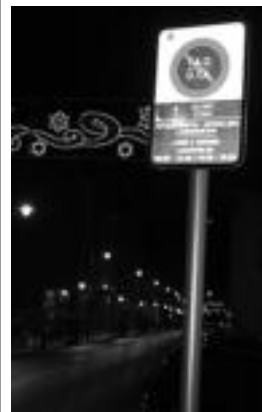
TAO gune urdina Ibarra. A. IMAZ